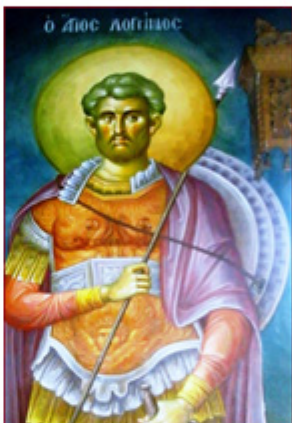
ΑΓΙΟΣ ΛΟΓΓΙΝΟΣ 16 Οκτωβρίου