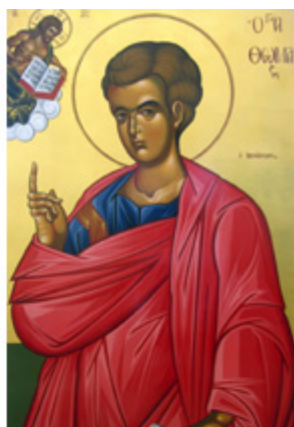
ΑΠΟΣΤΟΛΟΣ ΘΩΜΑΣ 6 Οκτωβρίου