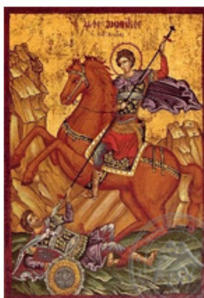
ΑΓΙΟΣ ΔΗΜΗΤΡΙΟΣ 26 Οκτωβρίου