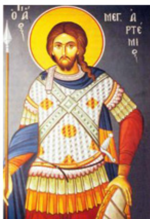
ΑΓΙΟΣ ΑΡΤΕΜΙΟΣ 20 Οκτωβρίου