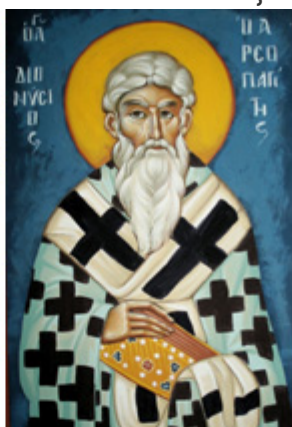
ΑΓ. ΔΙΟΝΥΣΙΟΣ Ο ΑΡΕΟΠΑΓΙΤΗΣ 3 Οκτωβρίου