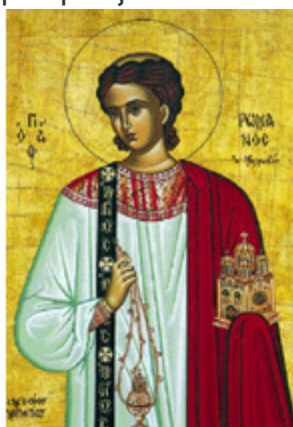
ΑΓ. ΡΩΜΑΝΟΣ Ο ΜΕΛΩΔΟΣ 1 Οκτωβρίου

Τον μήνα αυτόν γιορτάζουν και οι πολιούχοι των δύο μεγαλύτερων πόλεων της πατρίδας μας. Ο Άγιος Διονύσιος ο Αρεοπαγίτης για την Αθήνα και ο Άγιος Δημήτριος για τη Θεσσαλονίκη. Βέβαια έχουμε και τις γιορτές κι άλλων αγίων, που μπορείς να δεις παρακάτω.