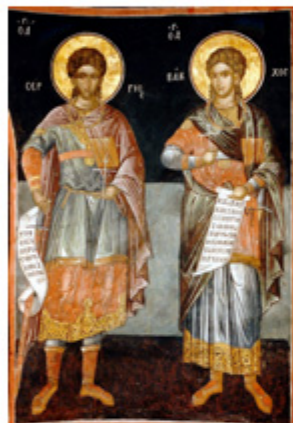
ΑΓ. ΣΕΡΓΙΟΣ & ΒΑΧΚΟΣ 7 Οκτωβρίου