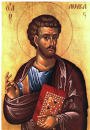
ΑΠΟΣΤΟΛΟΣ ΛΟΥΚΑΣ 18 Οκτωβρίου