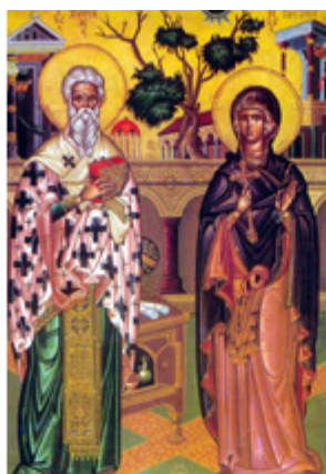
ΑΓ. ΚΥΡΙΑΝΟΣ & ΙΟΥΣΤΙΝΗ 2 Οκτωβρίου