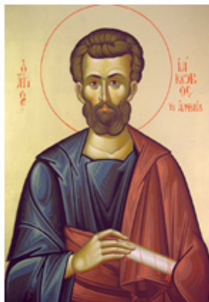
ΑΠ. ΙΑΚΩΒΟΣ ΑΛΑΦΙΟΥ 9 Οκτωβρίου