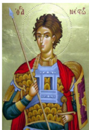
ΑΓΙΟΣ ΝΕΣΤΟΡΑΣ 27 Οκτωβρίου

Ο Οκτώβριος είναι ο μήνας της Θεσσαλονίκης. Κι αυτό, επειδή εκτός από τον πολιούχο Άγιο Δημήτριο, η πόλη γιορτάζει την απελευθέρωσή της από τον τουρκικό ζυγό. Αυτό συνέβη στις 26 Οκτωβρίου 1912, όταν ο ελληνικός στρατός