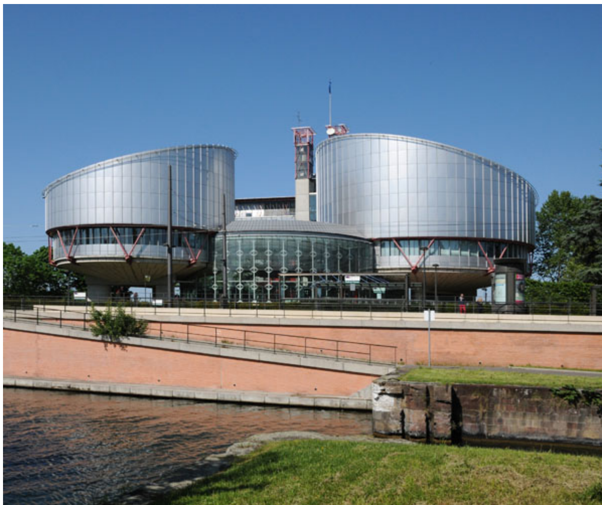
Το Ευρωπαϊκό Δικαστήριο των ανθρωπίνων δικαιωμάτων (Γαλλία)