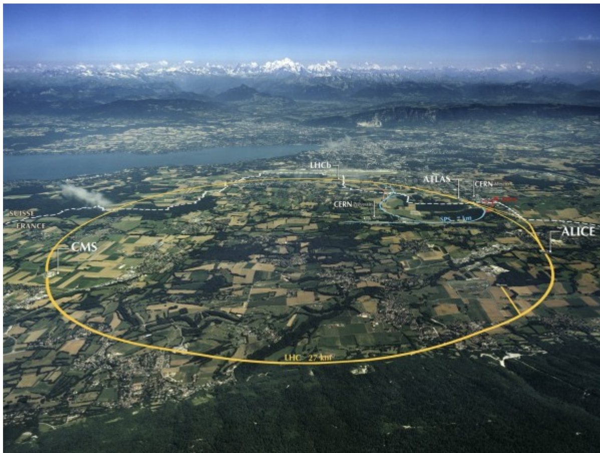
Άποψη της περιοχής της Γενεύης από ψηλά, με σημειωμένη τη θέση της μεγάλης σήραγγας του επιταχυντή αδρονίων (LHC) και τα σημεία που είναι εγκατεστημένοι οι διάφοροι ανιχνευτές.

Ο τεράστιος κυκλικός επιταχυντής LHC με μήκος 27 χιλιομέτρων, αποτελείται από χιλιάδες χιλιόμετρα καλωδιώσεων, χιλιάδες ηλεκτρομαγνήτες και ερευνητικές συσκευές με δεκάδες δισεκατομμύρια τρανζίστορ. Επί πλέον 128 τόνοι υγρού ηλίου κρατούν την θερμοκρασία των υπεραγωγίμων μαγνητών στους 1,8 βαθμούς πάνω από το απόλυτο μηδέν, θερμοκρασία δηλαδή 271 βαθμών Κελσίου κάτω από το μηδέν. Στον LHC οι ροές σωματιδίων επιταχύνονται σχεδόν στην ταχύτητα του φωτός (300.000 χιλιόμετρα το δευτερόλεπτο), εκτελούν δηλαδή περίπου 11.200 βόλτες γύρω από τον κυκλικό επιταχυντή κάθε δευτερόλεπτο!