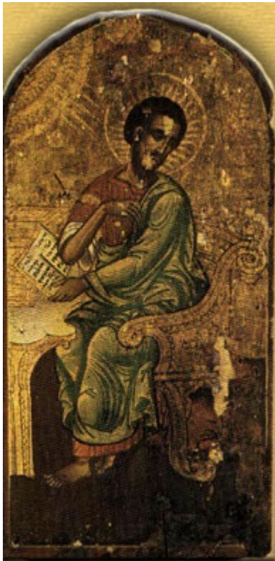
Άγιος Λουκάς ο Ευαγγελιστής - Φανάρι, Κωνσταντινούπολη