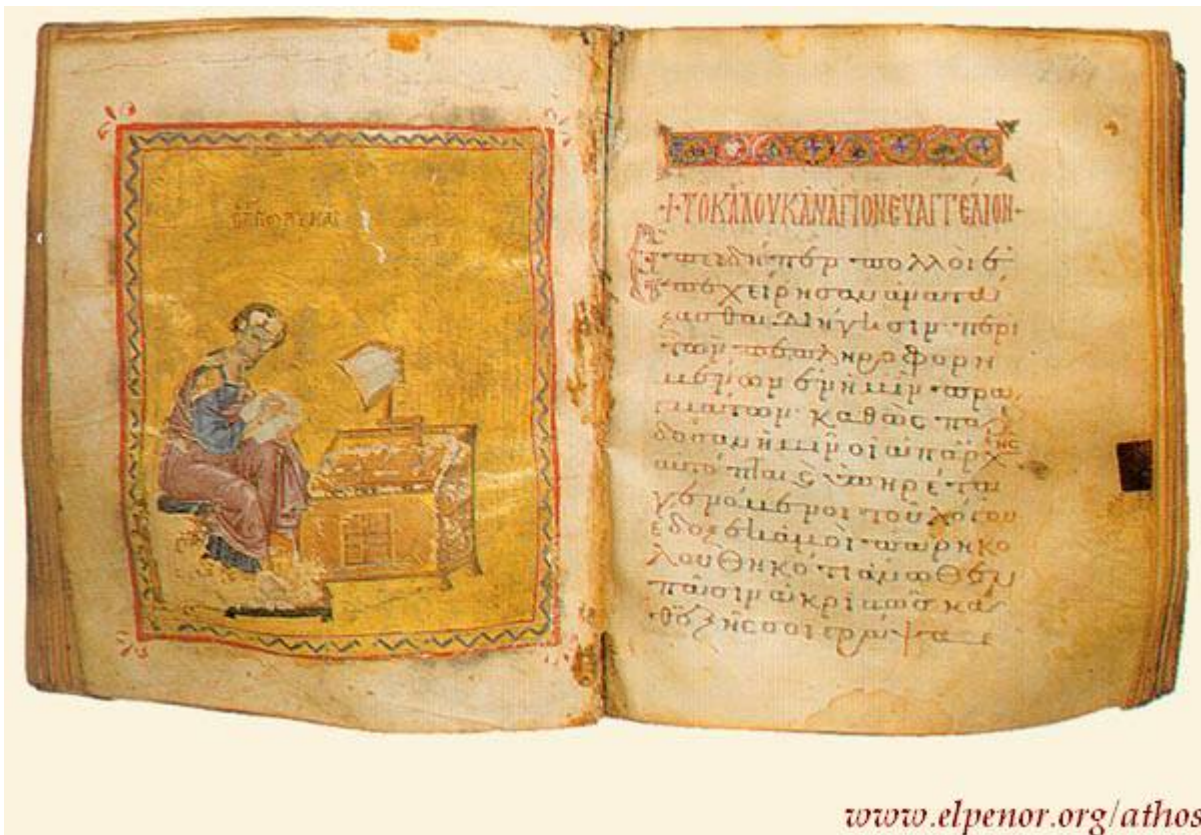
Άγιος Λουκάς ο Ευαγγελιστής (Τετραευάγγελο σε περγαμνή) - 13ος αι. μ.Χ. - Μονή Καρακάλλου, Άγιον Όρος