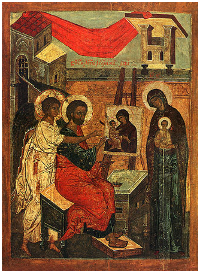
Άγιος Λουκάς ο Ευαγγελιστής