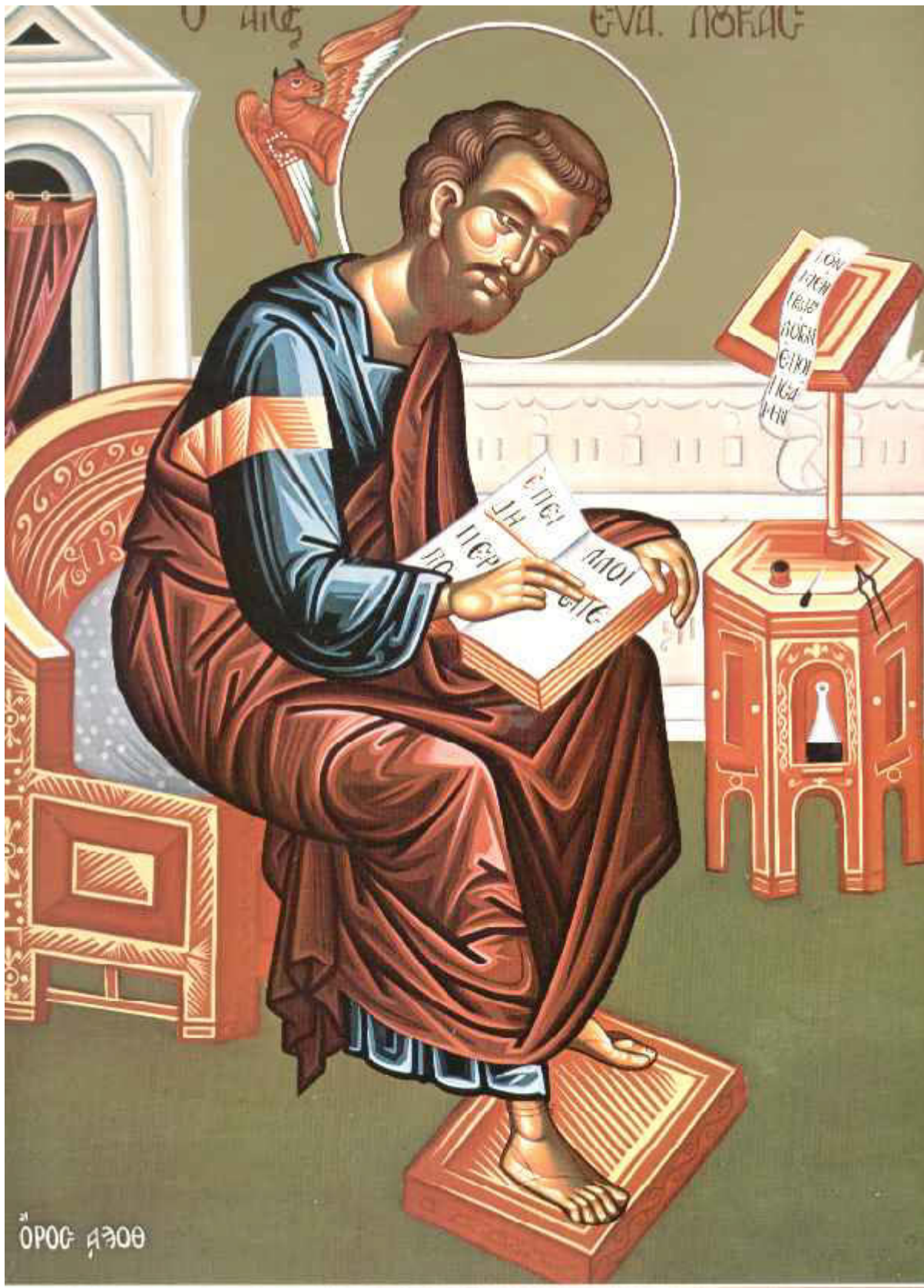
Άγιος Λουκάς ο Ευαγγελιστής