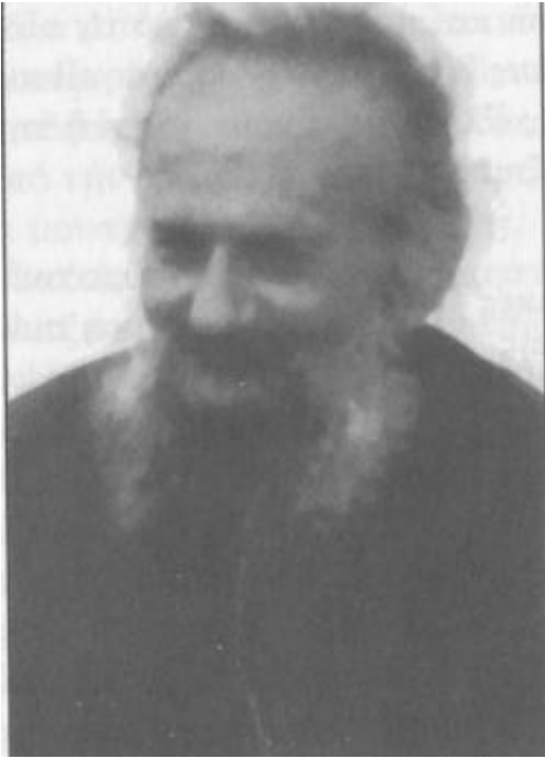
π. Σεραφείμ Δημόπουλος 2

Ανέπτυξε επίσης μεγάλη δράση, βοηθώντας, κατηχώντας και βαπτίζοντας πάνω από χίλιους μετανάστες και κάποιους που ήταν φυλακισμένοι στις φυλακές Λαρίσης.