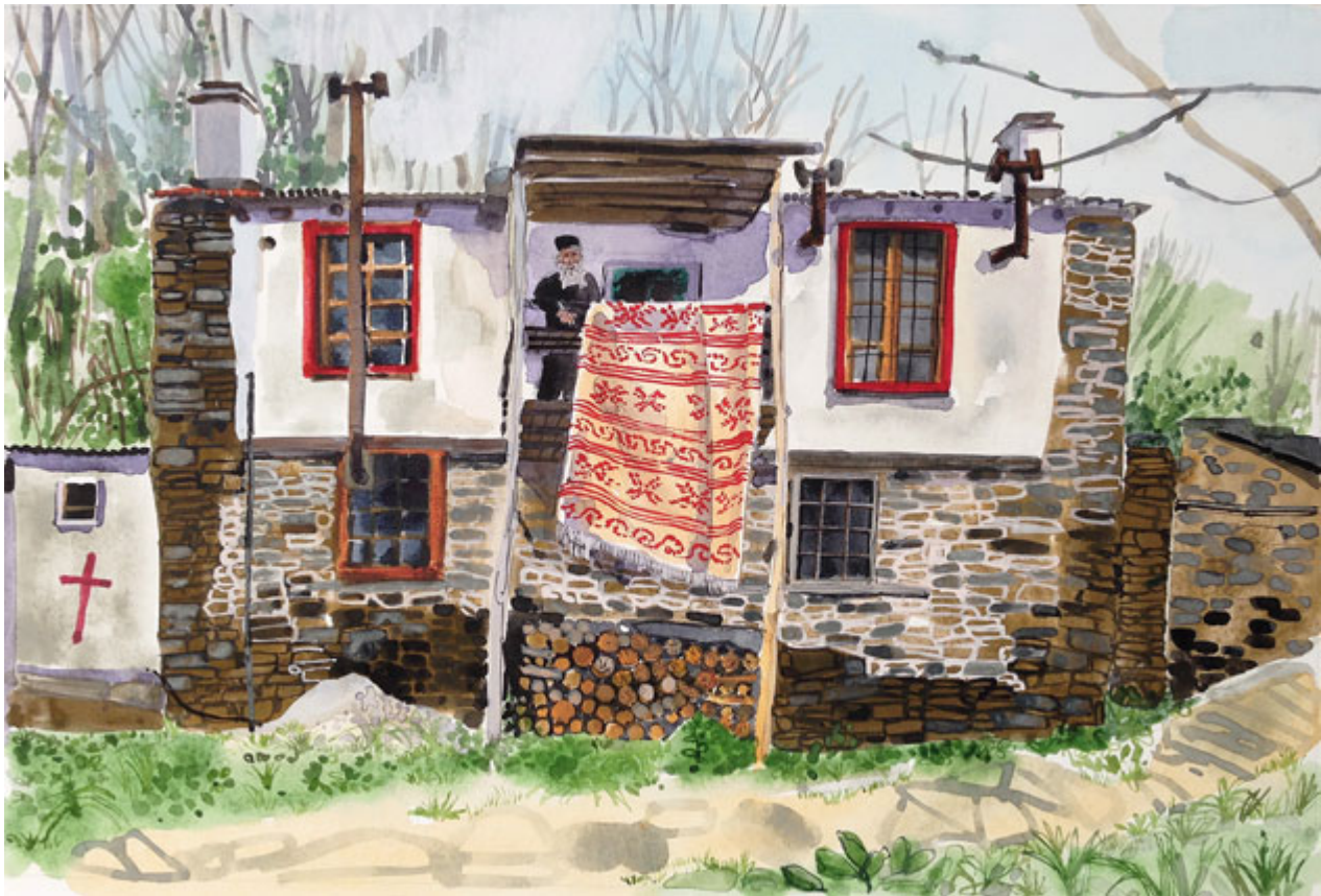
Ακουαρέλλα - Κελί στο βουνό

? ?????????? " DOUG PATTERSON – ROYAL COLLEGE OF ART – MOUNT ATHOS CENTER " ?????????????? ?? ?????????????? ??? ??????? ?????????????? ????????? DOUG PATTERSON ??? ?????? ?????????????? ?? ROYAL COLLEGE OF ART ,? ????? ?????????????? ??? ?????? ?????? ??? ? ?????????????????? ??????.