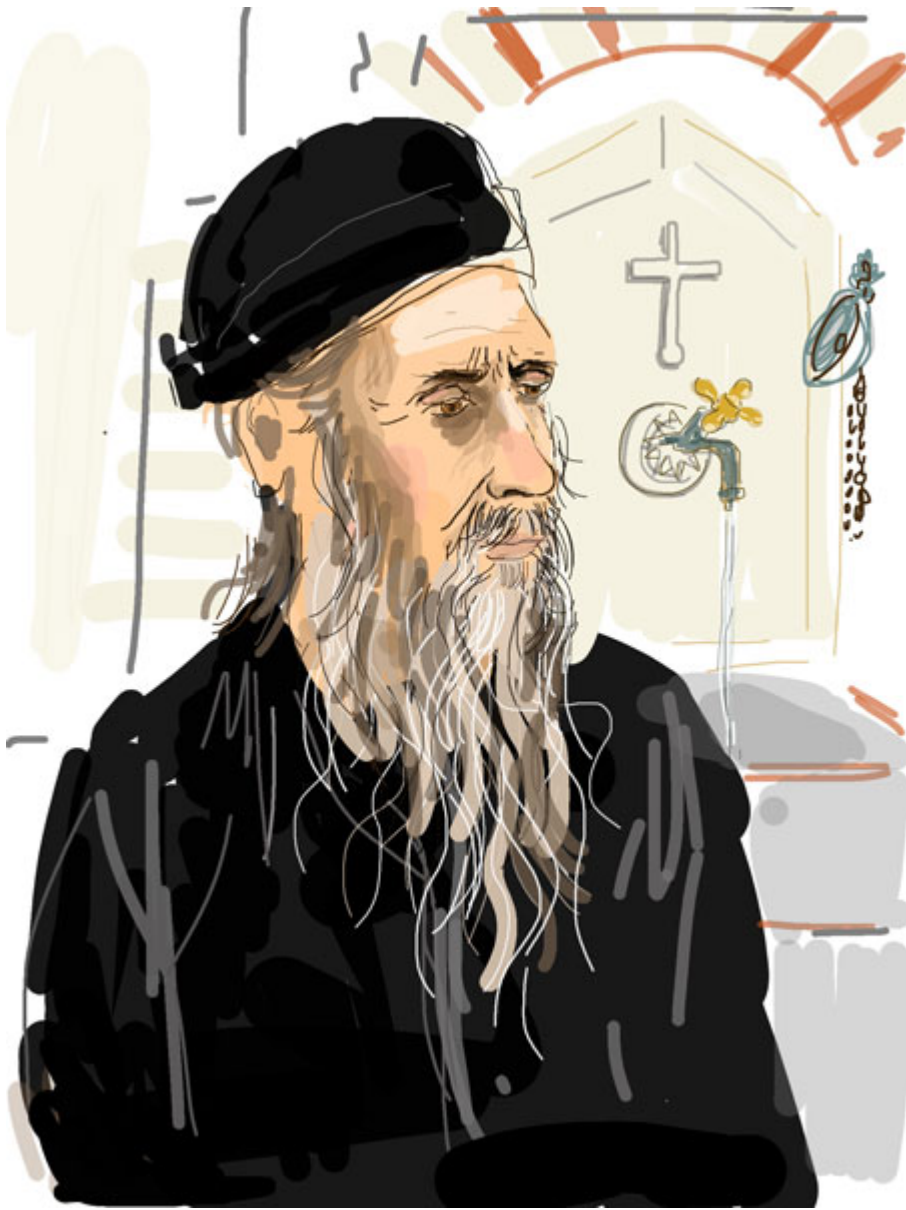
Πορτρέτο Μοναχού (I-pad drawing)

? ??? VYNER ?????????? ?????????? ??? ?????????????? ??? ?????? ????? ??? ??? ?????????? ????????? RCA – ?????????????????? ??????? ?????????????????????????? ?? ??? ?????????? ??? ??????? ?????, ????? ?????? ?????????????????? ????? ??? ??? ?????????? ??? ?????? ???, ??? ?????????? ??? ?? ?????????????????? ???????.