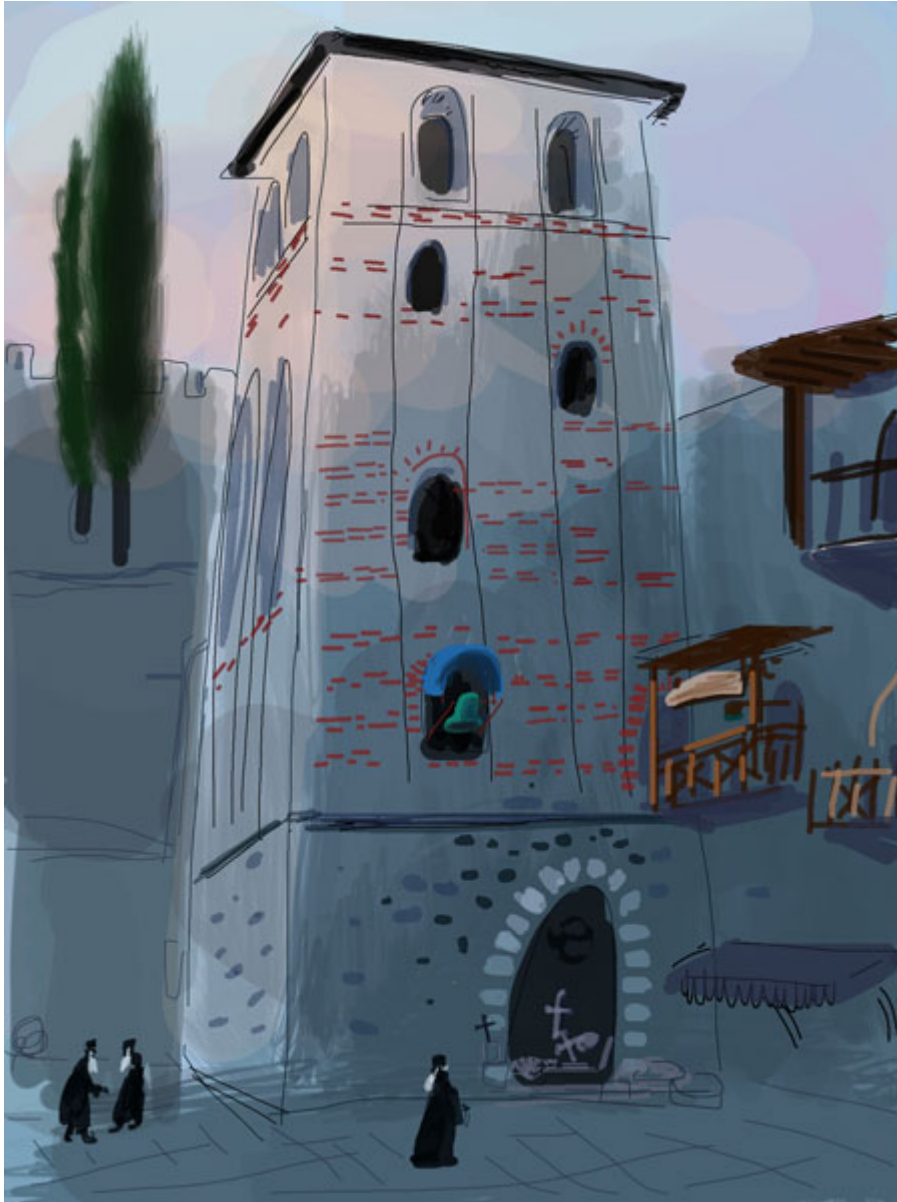
Καμπαναριό - Ι.Μ.Αγ.Παύλου (I-pad drawing)

???????? ???? ????????????? ?????????? ??? ?????.