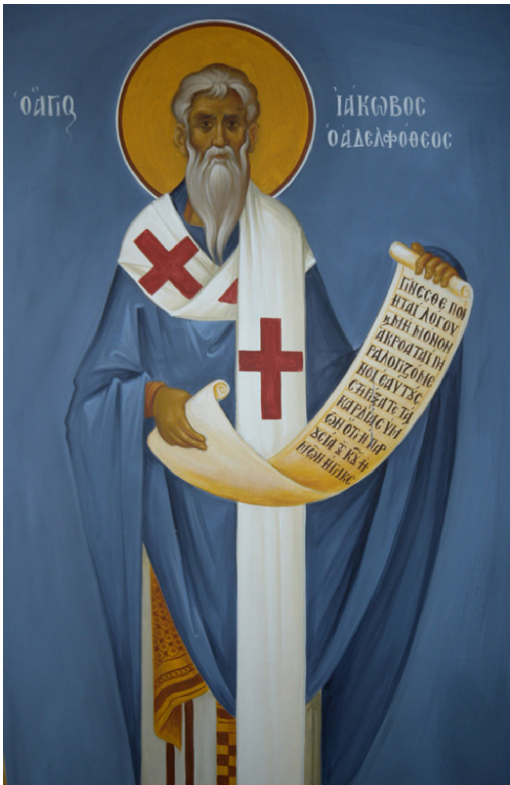
Άγιος Ιάκωβος ο Απόστολος και Αδελφός του - Ι. Ν. Οσίων Παρθενίου και Ευμενίου των εν Κουδουμά, δια χειρός Παναγιώτη Μόσχου (2006 μ.Χ.)

Εορτάζει στις 23 Οκτωβρίου εκάστου έτους.