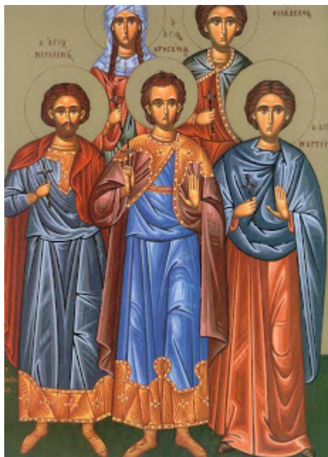
Άγιοι Μαρκιανός και Μαρτύριος οι νοτάριοι