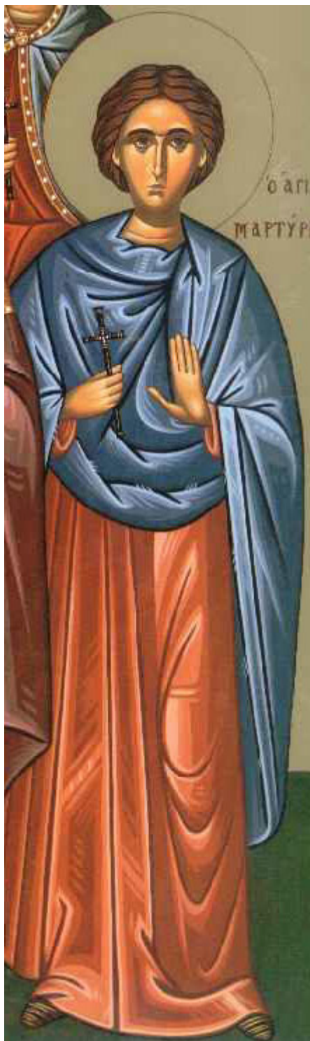
Ἅγιοι Μαρκιανός και Μαρτύριος οἱ νοτάριοι