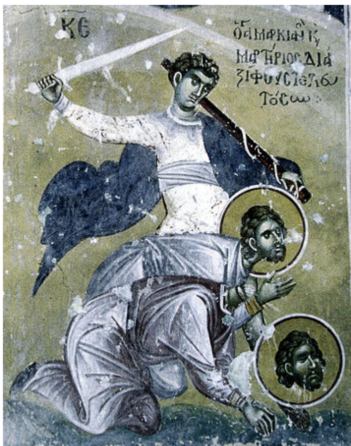
Άγιοι Μαρκιανός και Μαρτύριος οι νοτάριοι