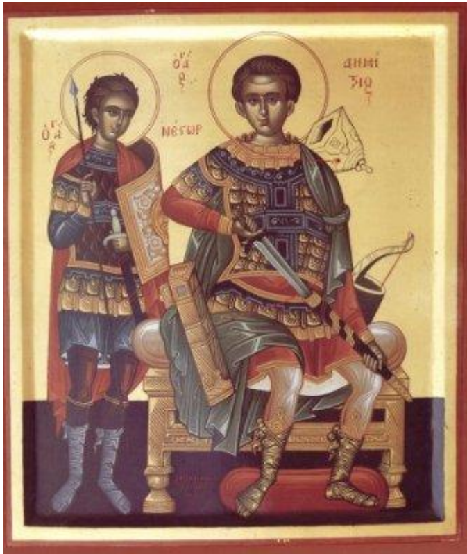
Ο Άγιος Δημήτριος μαζί με τον Άγιο Νέστωρ