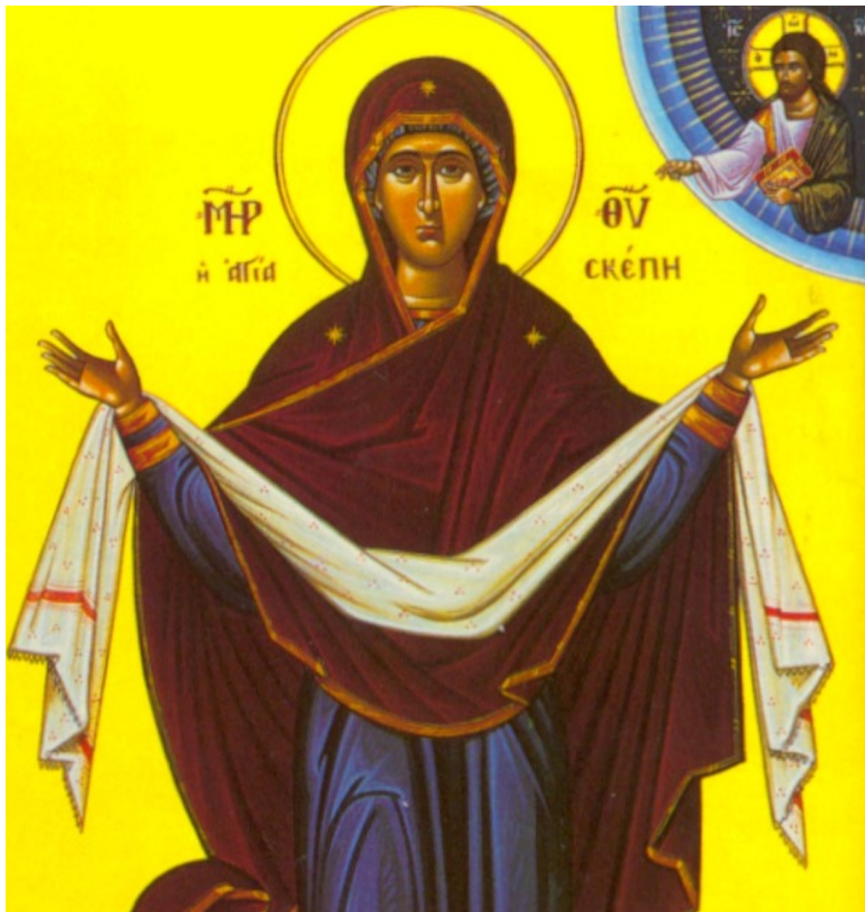
Αγία Σκέπη της Υπεραγίας Θεοτόκου