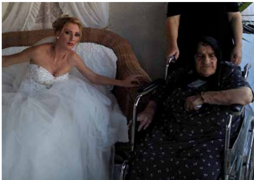
Στο γάμο μιας από τις δισέγγονες της, μαζί με μια από τις κόρες της

Ο αγώνας για να βρεθούν τα οστά του άντρα της