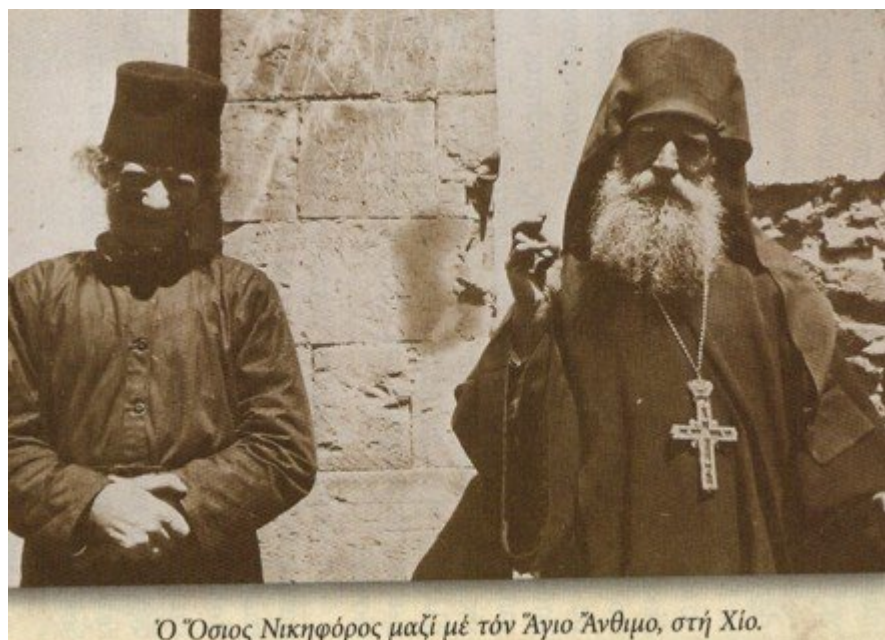
Ο Όσιος Νικηφόρος μαζί με τόν Άγιο Άνθιμο, στή Χίο.

Θεία Λειτουργία Οσίου Νικηφόρου του Λεπρού 3/1/2013