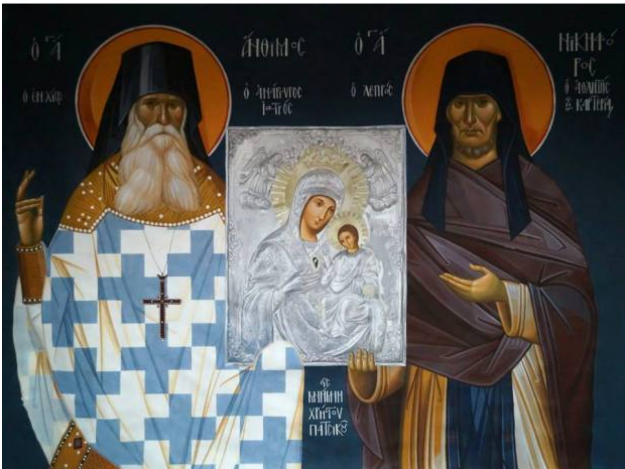
Άγιοι Άνθιμος-Χίους Νικηφόρος ο λεπρός και η θαυματουργή εικόνα (αγιογραφία Κωνσταντίνου Γιαννάκη)

Εορτάζει στις 4 Ιανουαρίου εκάστου έτους.