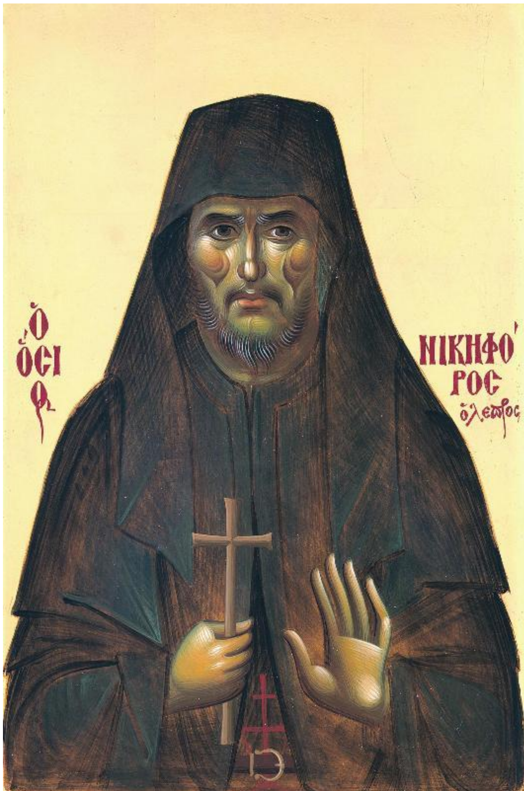
Όσιος Νικηφόρος ο Λεπρός