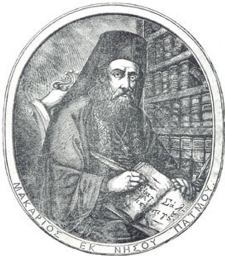
ος Ιεροδίακονος Άγιος Μακάριος ο Καλοντικός, ιδρυτής και πρώτος διδάσκαλος του Ελληνικού

Από την ίδρυση της Σχολής το 1713, ορισμένοι χώροι της Αποκαλύψεως χρησίμευσαν όχι μόνο ως αίθουσες διδασκαλίας, αλλά και ως κοιτώνες των μαθητών. Η θρησκευτική και παιδαγωγική δύναμη του Ιερού Σπηλαίου εξυπηρετούσε τις θρησκευτικές ανάγκες μαθητών, αλλά και διδασκάλων, διέπλαθε το χαρακτήρα των μαθητών, συνδυάζοντας την ακαδημαϊκή παιδεία με την κατά Θεόν κατάρτιση και την αληθινή Θεογνωσία. Πλήθος μαθητών, αλλά και προσκυνητών κατέκλυσε τη Σχολή για να ακούσει τον Άγιο των Ελληνικών Γραμμάτων. Επειδή λειτούργησε μέσα στο κτιριακό συγκρότημα του Καθίσματος ονομάστηκε «ένδον της Αποκαλύψεως Φροντιστήριο».