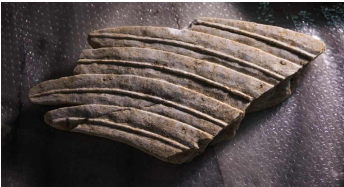
Λεπτομέρεια από τις σφίγγες, φωτο 1

https://www.wetransfer.com/downloads/dbbbe827671b2573cfb729b9b6edceed2014102809