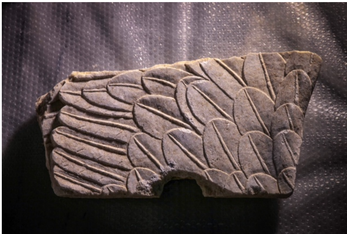
Λεπτομέρεια από τις σφίγγες, φωτο 3

Ως προς τις προσδοκίες που υπάρχουν, ότι δηλαδή κάποιος βασιλιάς είναι θαμμένος εκεί, ανέφερε ότι «το ποιος είναι θαμμένος, δεν μπορούμε να το πούμε πριν ολοκληρωθεί η ανασκαφή και πολύ πιθανόν πριν να ολοκληρωθεί και η μελέτη του μνημείου η οποία μπορεί να κρατήσει κάποια χρόνια. Όμως τις προσδοκίες όλων μας το μνημείο τις έχει ήδη ικανοποιήσει, εξαιτίας της μοναδικότητας του. Είναι εξαιρετικά σημαντικό ως αναπτυξιακός πόρος για τον τόπο. Είναι ένα μοναδικό εύρημα για την επιστήμη της Ιστορίας».