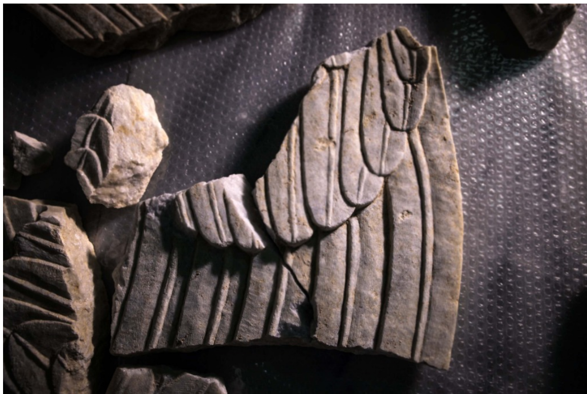
Λεπτομέρεια από τις σφίγγες, φωτο 2

Η Γενική Γραμματέας του Υπουργείου Πολιτισμού και Αθλητισμού Λ. Μενδώνη, απάντησε στην ερώτηση αν ο τάφος είναι συλημένος, τονίζοντας ότι «ο τάφος έχει δεχθεί σαφέστατα ανθρώπινη παρέμβαση, μέχρι εδώ που βρισκόμαστε. Από την αρχή της ενημέρωσης είχαμε πει-κι έχουμε πολλές φορές επαναλάβει-ότι έχουμε ισχυρότατες ενδείξεις δράσης τυμβωρύχων».