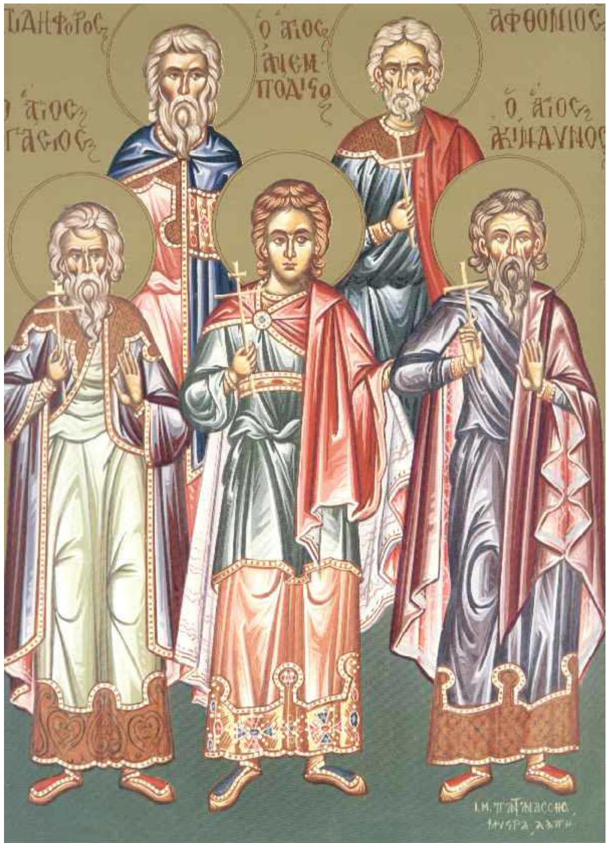
Άγιοι Ακίνδυνος, Αφθόνιος, Πηγάσιος, Ελπιδηφόρος και Ανεμπόδιστος

Εορτάζει στις 2 Νοεμβρίου εκάστου έτους.