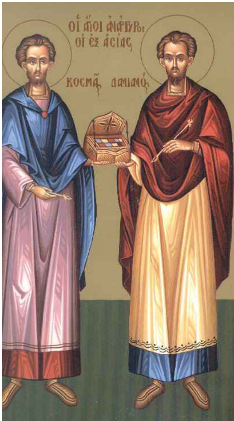
Άγιοι Κοσμάς και Δαμιανός οι Ανάργυροι και θαυματουργοί