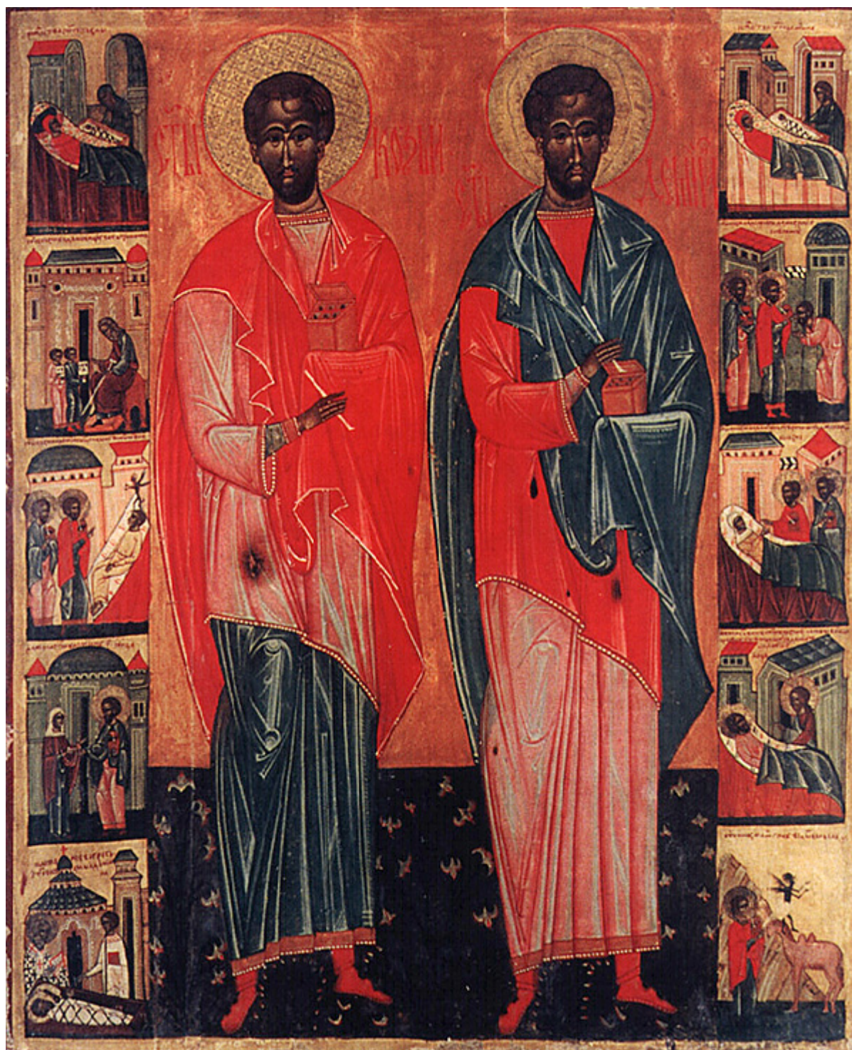
Άγιοι Κοσμάς και Δαμιανός οι Ανάργυροι και θαυματουργοί