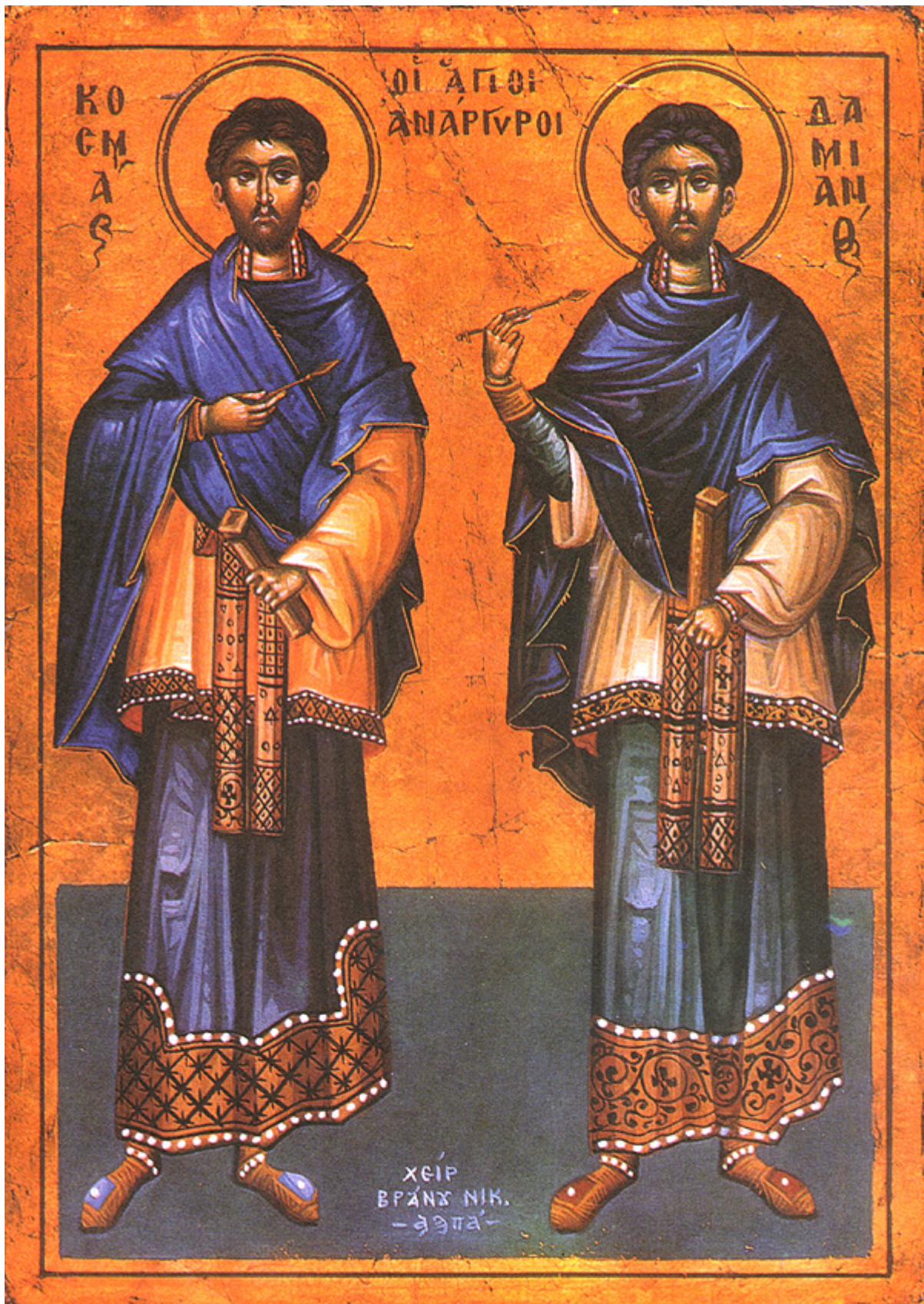
Ἅγιοι Κοσμάς και Δαμιανός οι Ἀνάργυροι και θαυματουργοί

Εορτάζει στις 1 Νοεμβρίου εκάστου έτους.