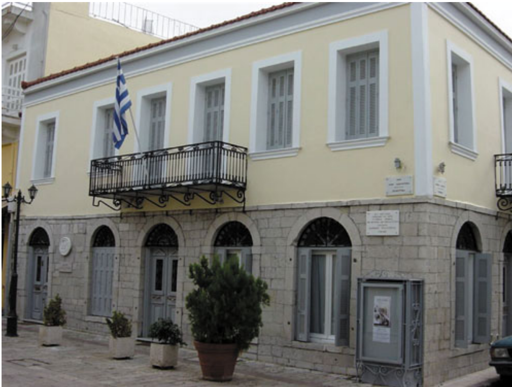
«Διέξοδος» Κέντρο Λόγου & Τέχνης

Εδώ και δεκαπέντε χρόνια η «Διέξοδος» ως Κέντρο Λόγου & Τέχνης αλλά και ως Ιστορικό Μουσείο, της Ιερής πόλης του Μεσολογγίου, αποτελεί έναν ενεργό πολιτιστικό φορέα με μία αδιάλειπτη παρουσία, στα πολιτιστικά δρώμενα της πόλης.