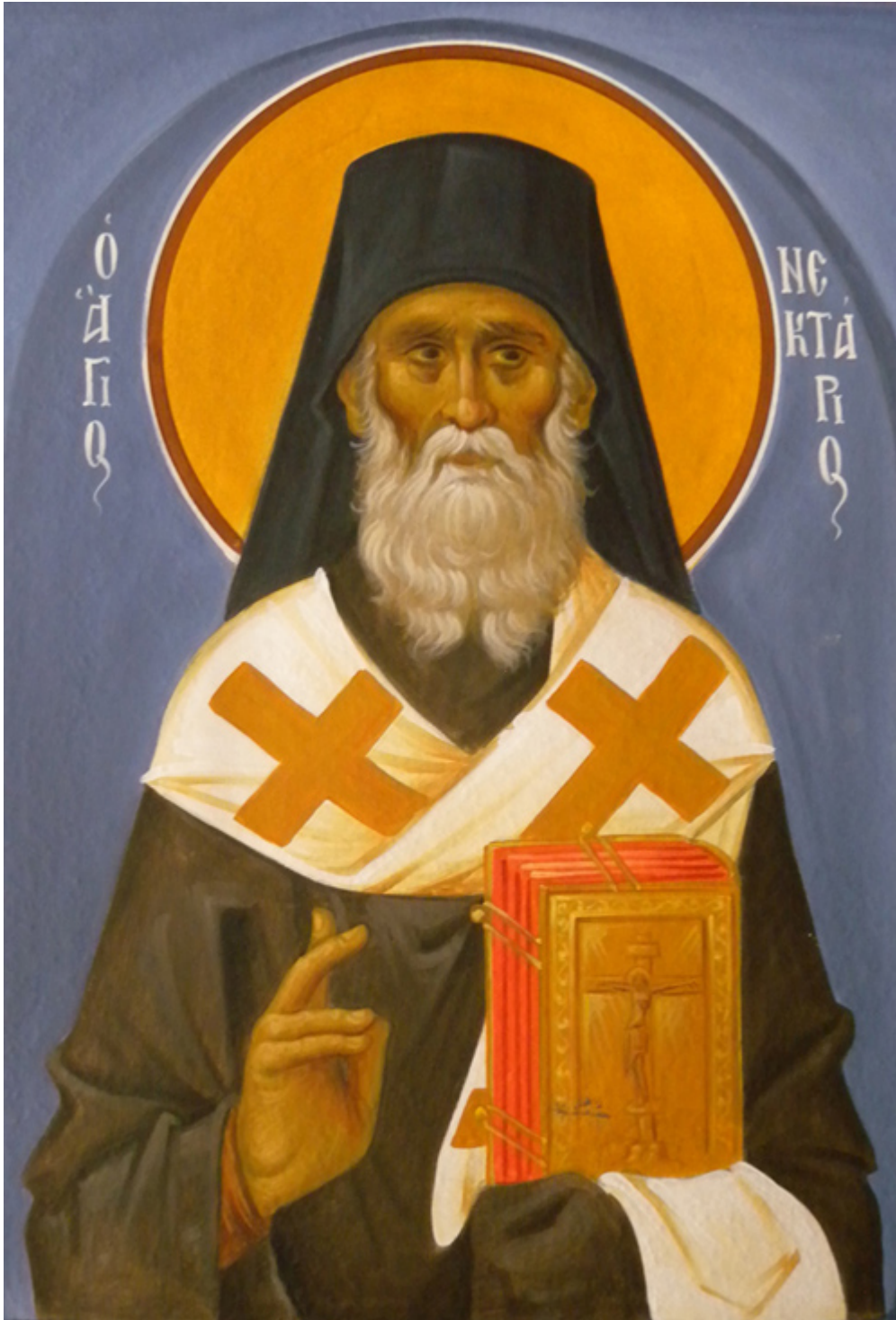
Άγιος Νεκτάριος Μητροπολίτης Πενταπόλεως Αιγύπτου - Ι. Ν. Οσίων Παρθενίου