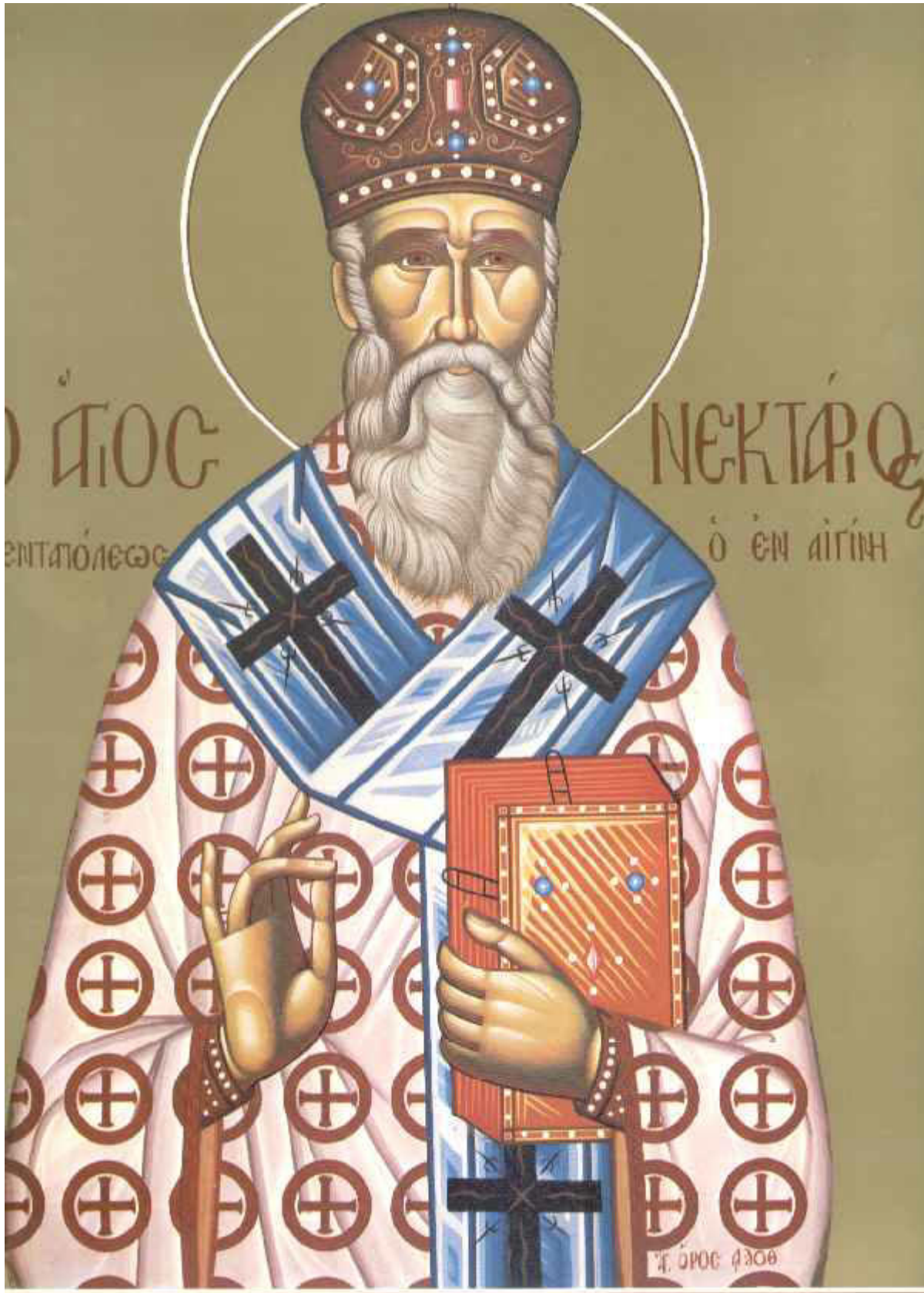
Άγιος Νεκτάριος Μητροπολίτης Πενταπόλεως Αιγύπτου