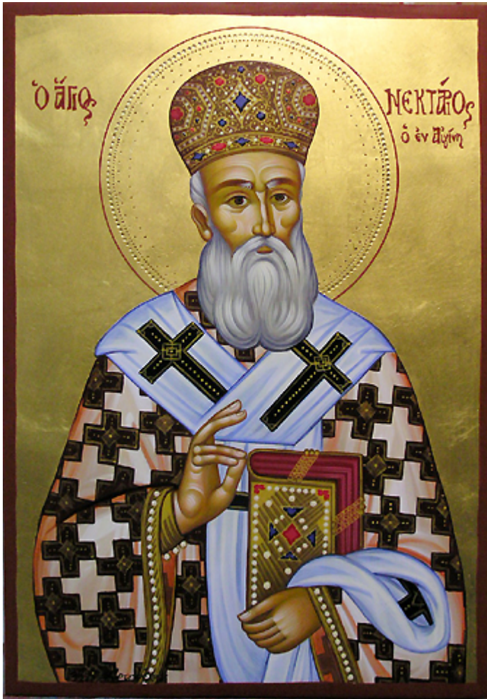
Άγιος Νεκτάριος Μητροπολίτης Πενταπόλεως Αιγύπτου

Εορτάζει στις 9 Νοεμβρίου εκάστου έτους.