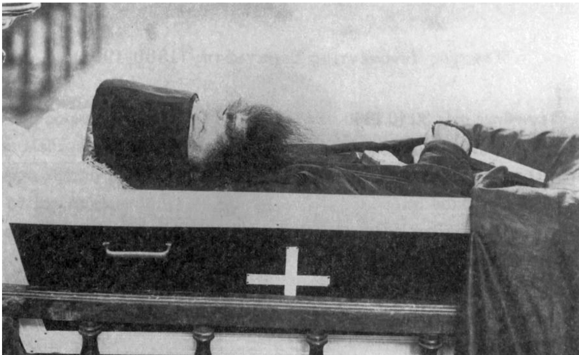
Κηδεία μοναχού Ιννοκέντιου Σεραγιώτου

Γεννήθηκε στις 30.10.1860 στο Ιρκούτσκ της Σιβηρίας. Μικρός έμεινε ορφανός από τους γονείς του και ζούσε με τα πέντε αδέρφια του. Ο πατέρας του τους κληροδότησε χρυσορυχεία. Νέος μετέβη στην Πετρούπολη, όπου σπούδασε φυσικές επιστήμες, μαθηματικά και νομικά. Ζώντας ο ίδιος πολύ λιτά, ασκητικά και αγνά ασκούσε πλούσια την αρετή της ελεημοσύνης σε άπορους συμμαθητές του και σε όποιον είχε μεγάλη ανάγκη. Μία επίσκεψή του στην Ευρώπη τον απογοήτευσε, για την εντελώς κοσμική ζωή που ζούσαν οι άνθρωποι. Πίστευε ότι τα χρήματα δεν χαρίζουν την πραγματική ευτυχία και αύξησε τον ασκητικό του αγώνα.