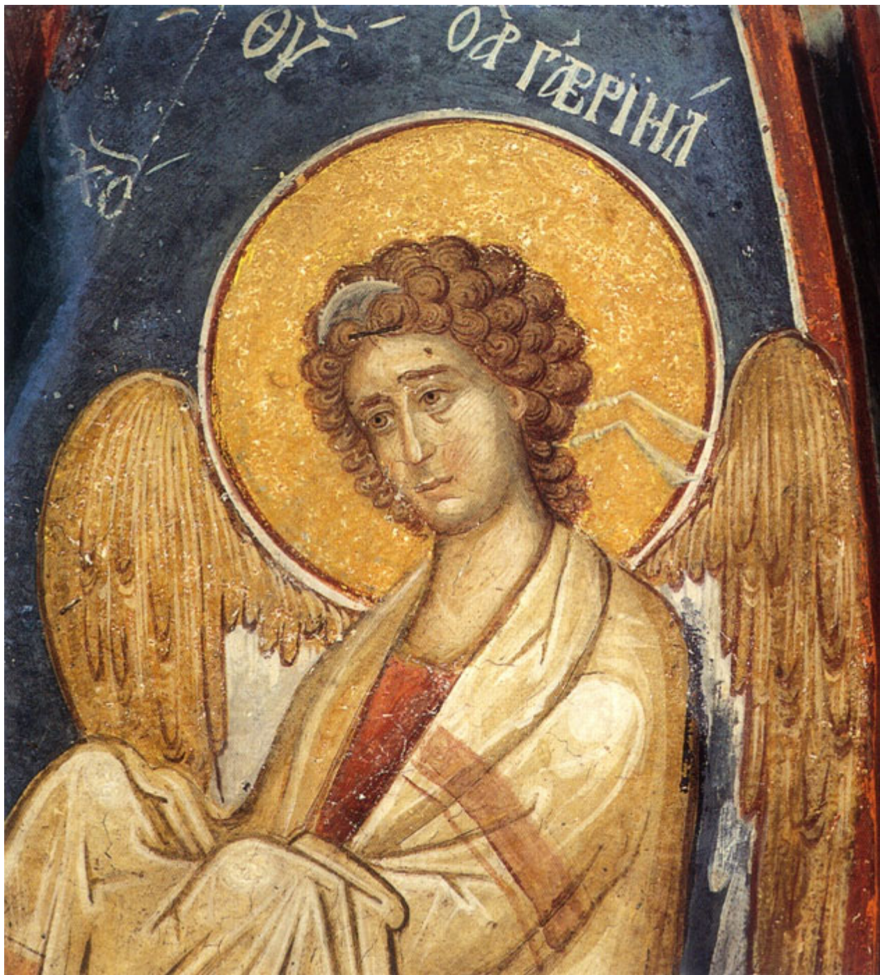
Ο Αρχάγγελος Γαβριήλ. Τοιχογραφία από το παρεκκλήσι των Αγίων Αναργύρων της Ι.Μ.Μ. Βατοπαιδίου.

Οι Άγγελοι είναι σχεδόν πανταχού παρόντες στο λατρευτικό χώρο της Εκκλησίας. Με το θρίαμβο της διδασκαλίας των εικόνων η απεικόνιση των Αγγέλων λαμβάνει νέες διαστάσεις. Αρχίζουν να παίρνουν συγκεκριμένους ρόλους και να είναι αναπόσπαστα πρόσωπα στα χριστολογικά και θεομητορικά εικονογραφικά θέματα. Όσο προχωρούμε στην ιστορία της χριστιανικής τέχνης και στο χρόνο οι Άγγελοι εικονίζονται στην ουράνια φρουρά του Χριστού, είτε Αυτός εικονίζεται ως Παντοκράτορας, είτε εικονίζεται ως σαρκωμένος λόγος, στην εικονογραφία της Παναγίας, ως βοηθοί και συνεργάτες στο σωτηριολογικό και λυτρωτικό έργο του Χριστού, ως φρουροί των ναών και ως ψυχοπομποί. Όπως κι όπου κι αν