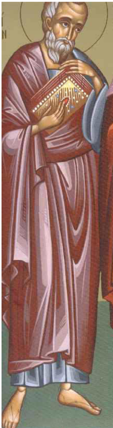
Άγιος Φιλήμων ο Απόστολος