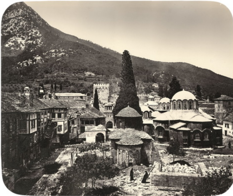
ΛΑΥΡΑ ΟΣ. ΑΘΗΝΑΣΙΩ ΕΡΧΟΜΕΝΟΣ. (Επίσκοπος «Πατριάρχης Κωνσταντινουπόλεως»)