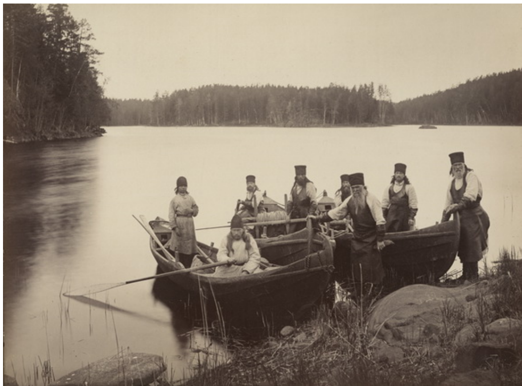
Μοναχοί της Μονής Βαλαάμ, ψαρεύουν

Σημαντικό γεγονός για το μοναστήρι αποτέλεσε η επίσκεψή του αυτοκράτορα Αλέξανδρου Α΄, το 1819. Η φήμη του μοναστηριού διαδόθηκε όχι μόνο μέσα στην ορθόδοξη Ρωσία, αλλά ξεπέρασε και τα όριά της. Οι φιλοξενούμενοι έρχονταν ακόμη και από μοναστήρια του Αγίου Όρους. Το 1858 η βασιλική οικογένεια επισκέφθηκε την Ι. Μονή. Ο 19 ος αιώνας ήταν η εποχή της υψηλότερης ακμής του μοναστηριού, την οποία αποτυπώνουν οι φωτογραφίες. Εικονογραφούν με λεπτομέρειες τα οικοδομήματα και το χρονικό του μοναστηριού. Στην αρχή του 20ου αιώνα η Ι. Μονή Βαλαάμ είχε 13 σκήτες.