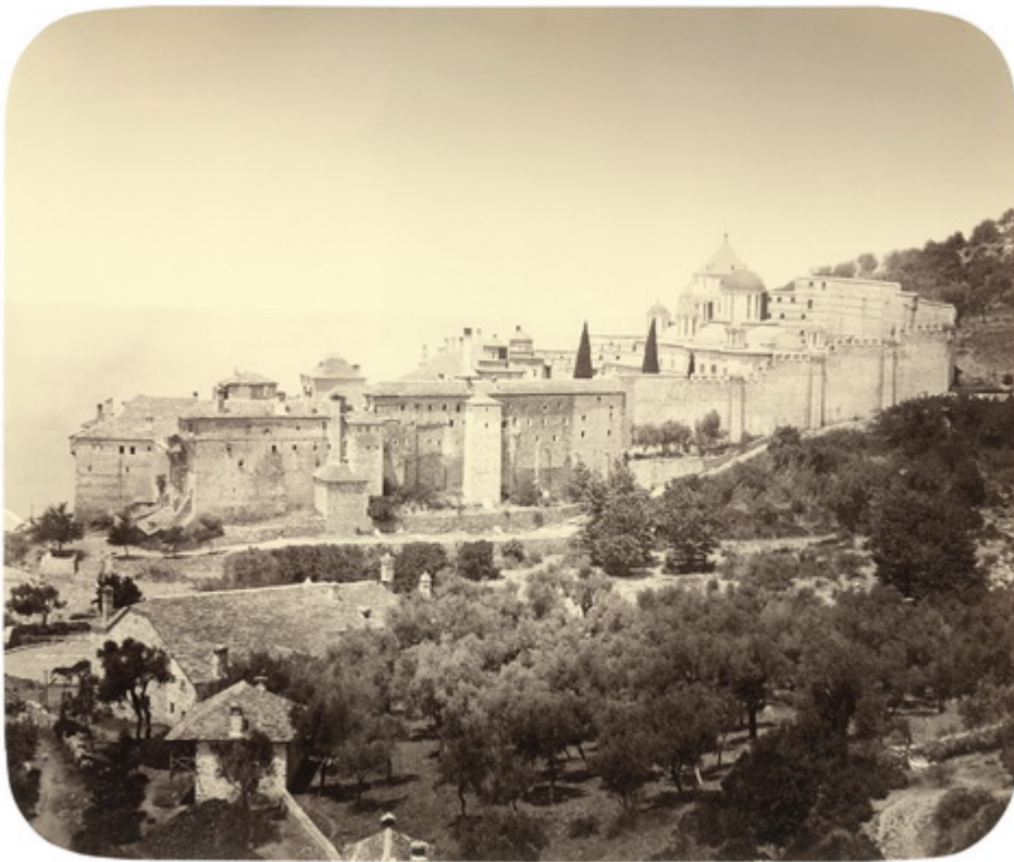
ΞΕΝΟΦΩΝΤΟΣ ΓΡΕΥΣΚΙΩ ΜΟΝΑΣΤΗΡΙ.