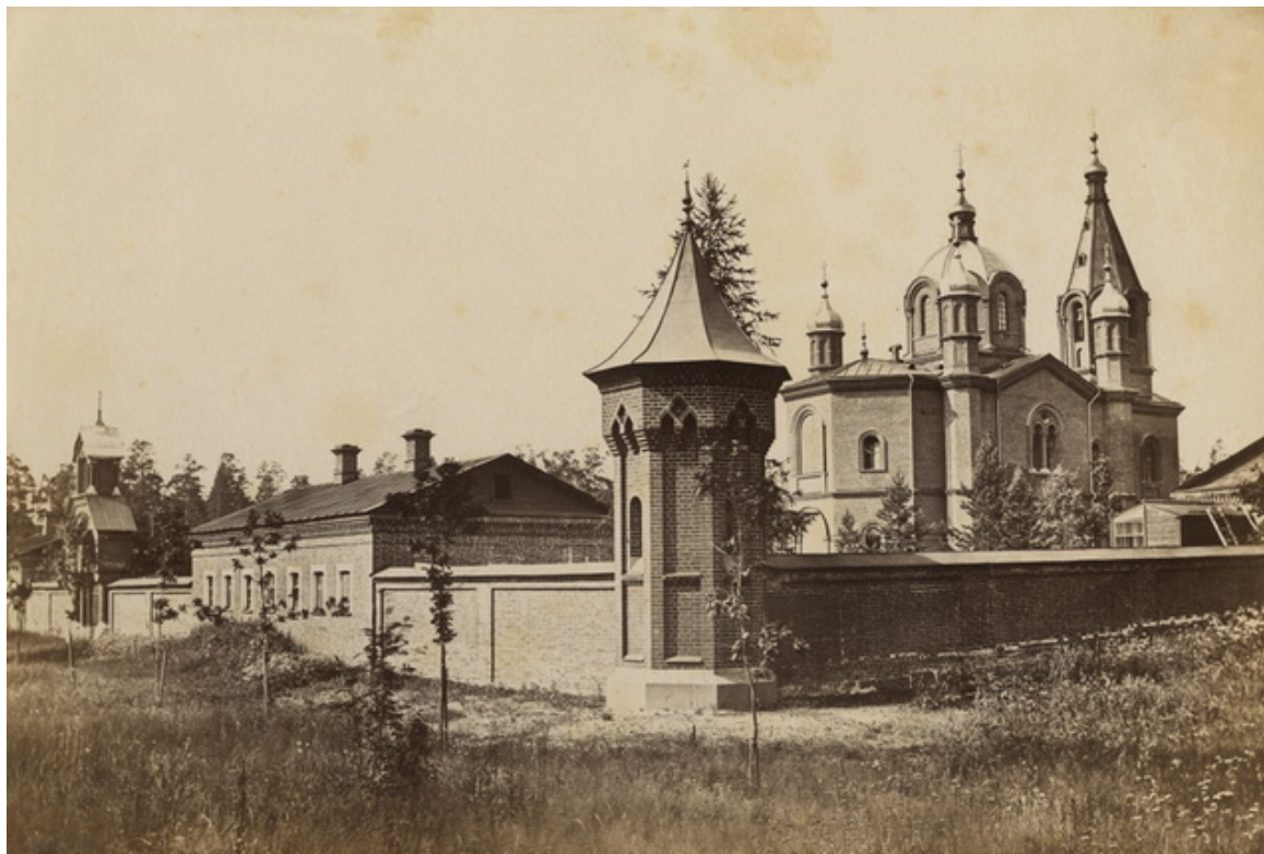
Η σκήτη των Αγίων στο Βαλαάμ

Οι ιστορικοί δεν συμφωνούν για τη χρονολόγηση της ιδρύσεως του μοναστηριού του Βαλαάμ. Μερικοί την συνδυάζουν με την εποχή του βαπτίσματος των Ρώσων, ενώ άλλοι την ανάγουν σε μεταγενέστερη περίοδο. Στα χρόνια της ακμής της, τον 15 ο -16 ο αιώνα, η Ι.Μ. Βαλαάμ ήταν κέντρο και πρότυπο μοναχικού βίου για το ολόκληρο Βορρά, όπως η Λαύρα των Σπηλαίων του Κιέβου στη νοτιοδυτική περιοχή της Ρωσίας και η Λαύρα του Αγίου Σεργίου στο κεντρικό της μέρος.