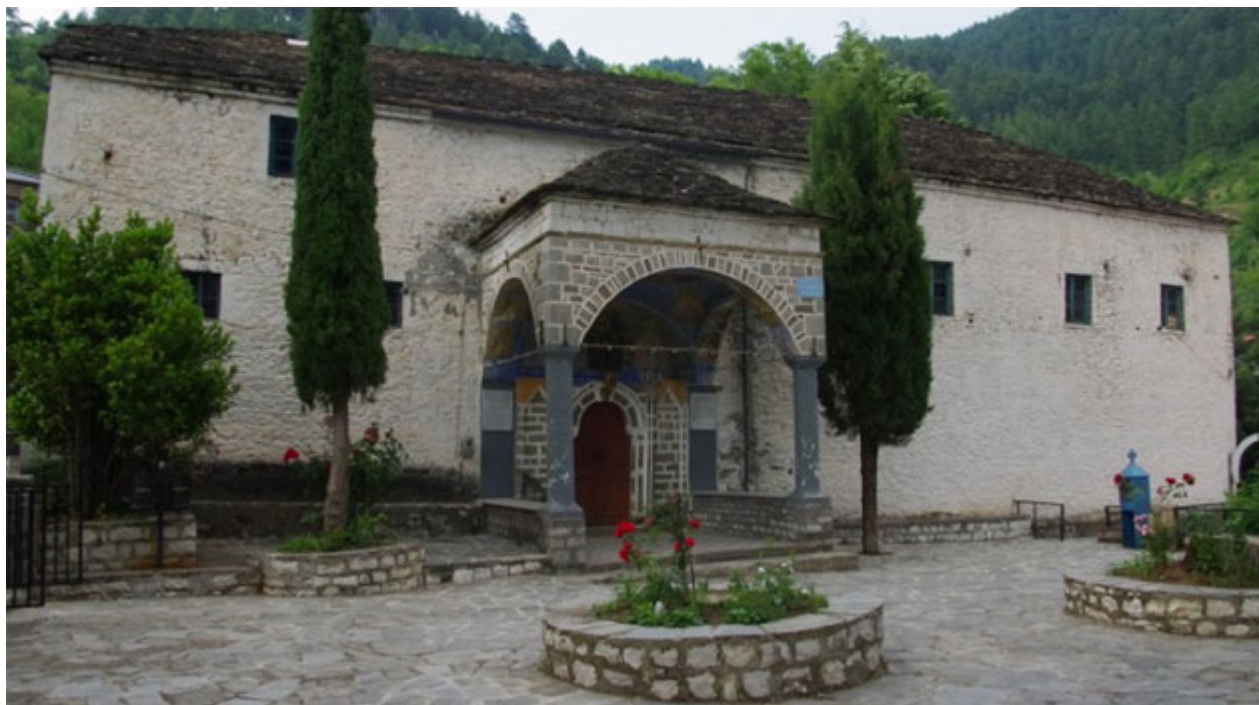
Ιερός Ναός Αγίας Παρασκευής Παλαιοσελλίου.

Κάθε χρόνο τῆς Ἀγίας Παρασκευῆς λειτουργάει ὁ πατήρ Παῦλος στὸ χωριό του.