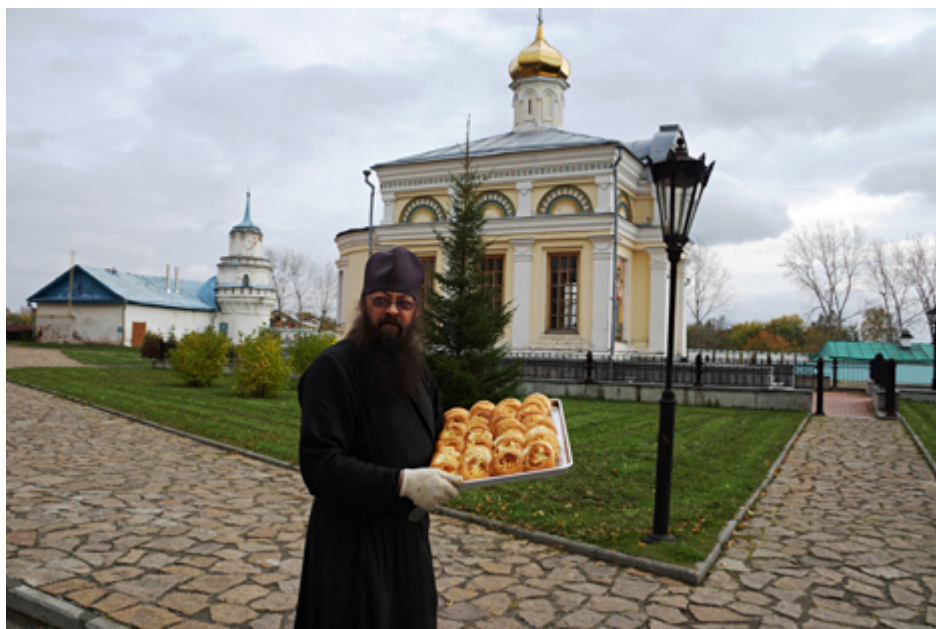
Το μοναστήρι του Αγίου Νικολάου.