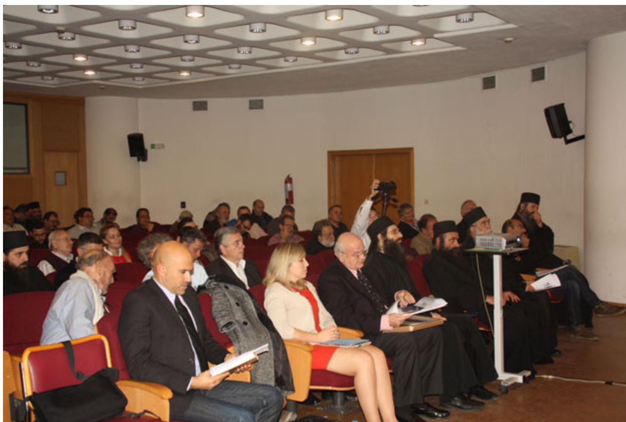
Στιγμές από τις εργασίες του Συνεδρίου