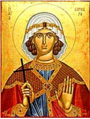
Αγία Βαρβάρα -