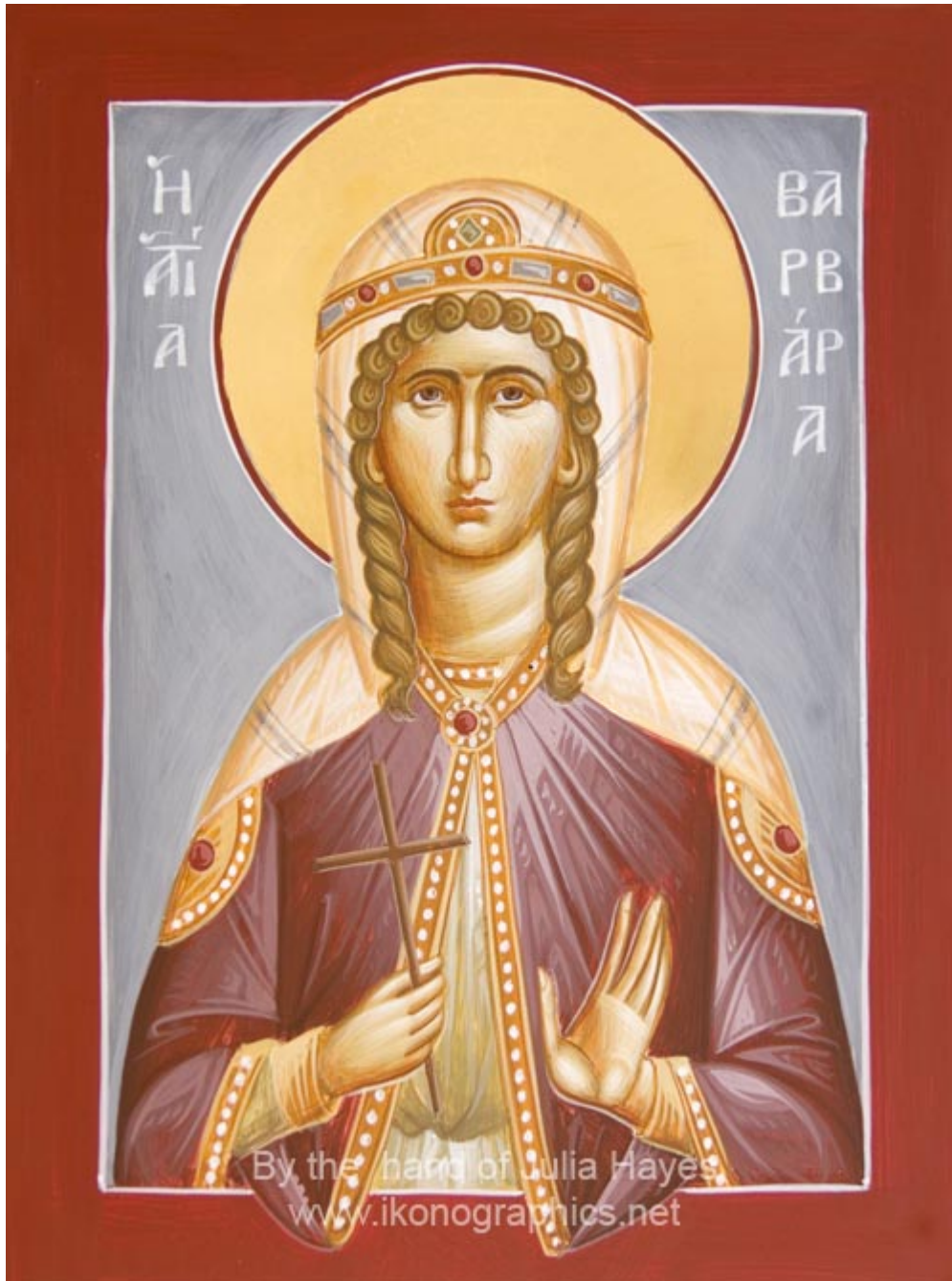
Αγία Βαρβάρα – Julia Hayes© ( www.ikonographics.net )