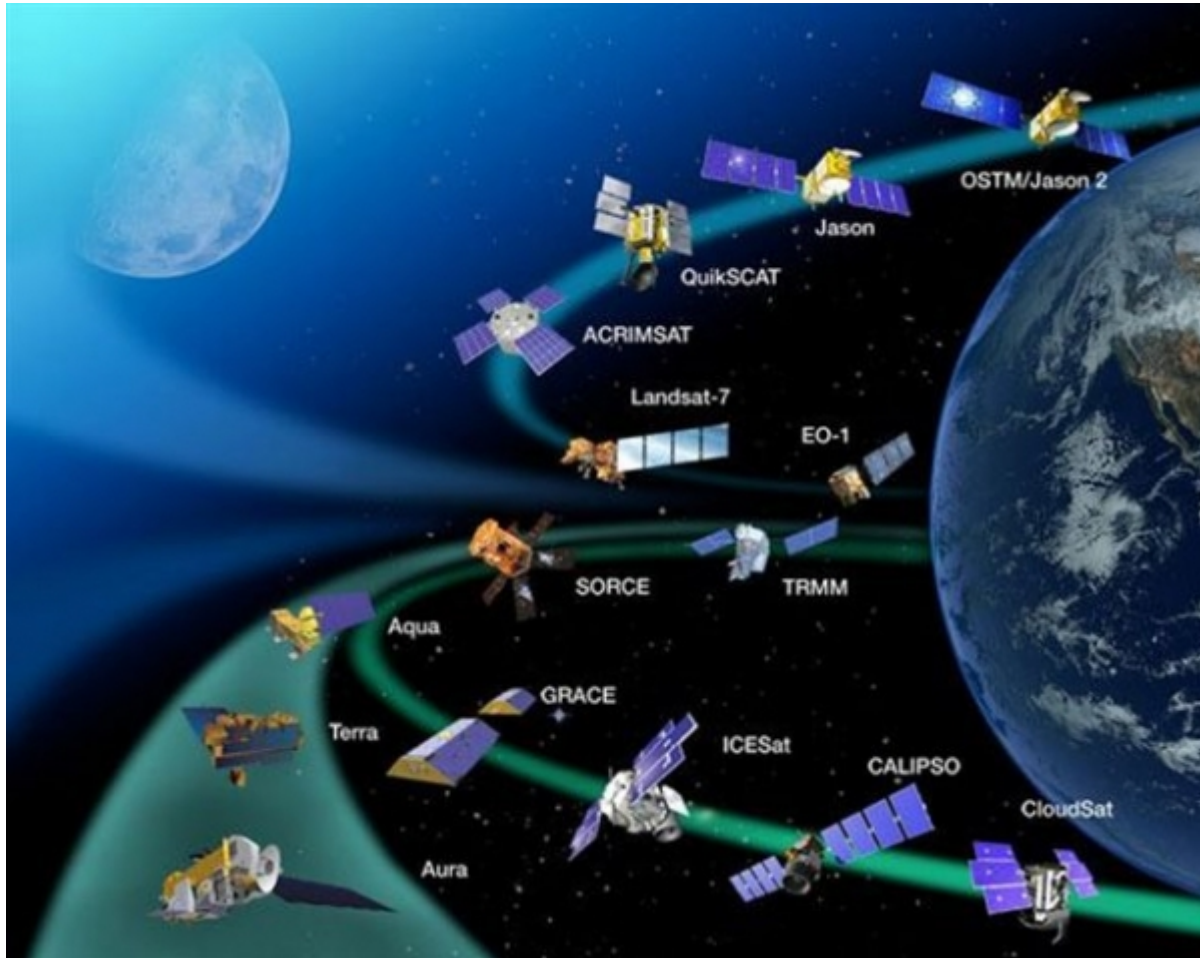
Δεκάδες δορυφόροι βρίσκονται σε αποστολές στο ηλιακό μας σύστημα