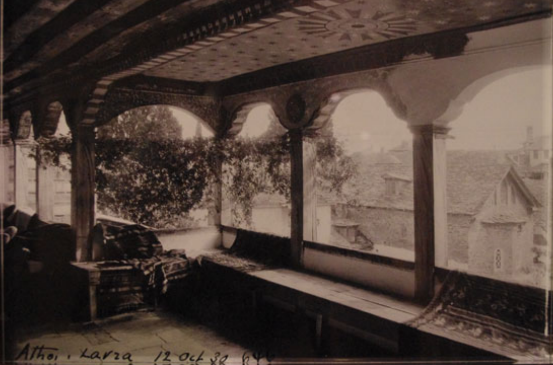
Athos, Larza 12 Oct 32 (P)