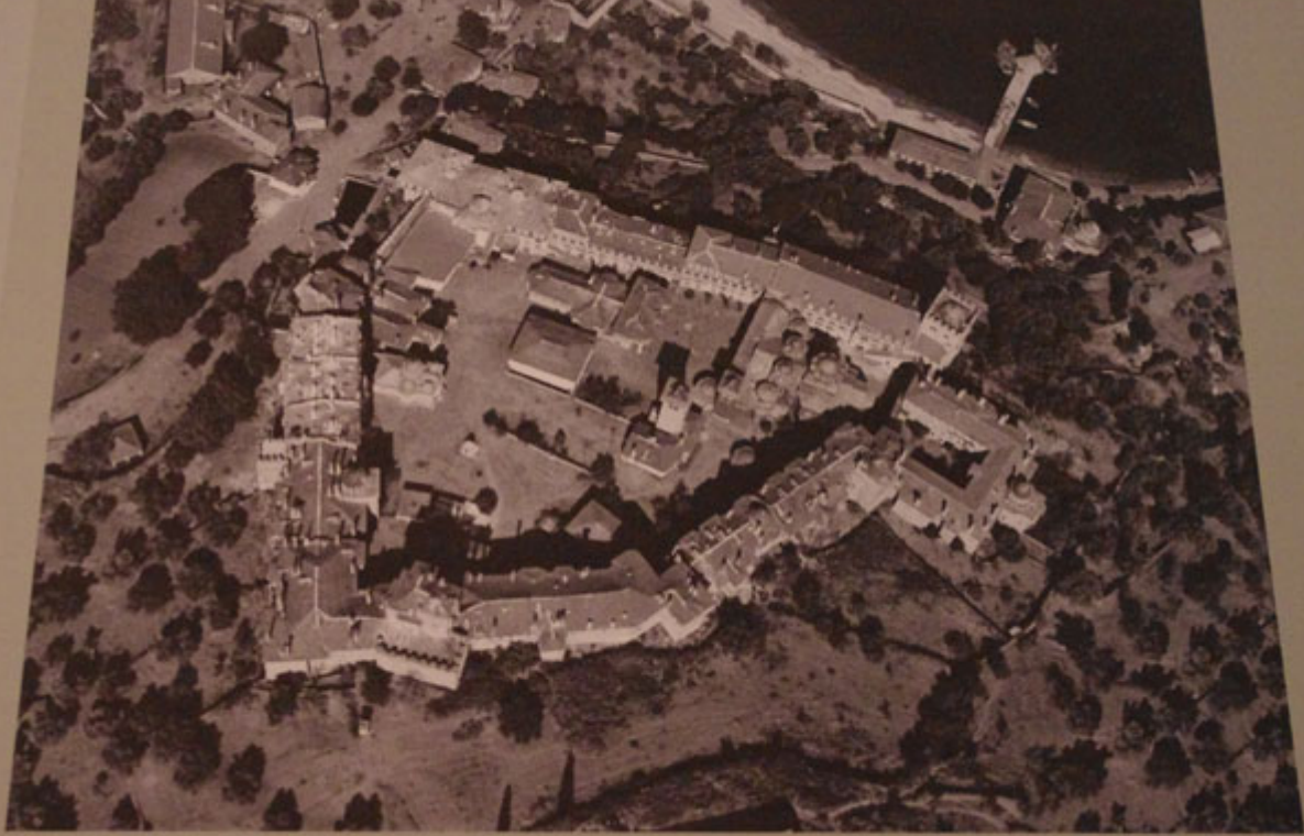
Ι.Μ. Βατοπεδίου, κατακόρυφη λήψη (Ιούνιος 1970)