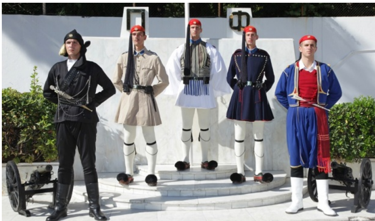
Ποντιακή στολή, θερινός ντουλαμάς, επίσημη ευζωνική στολή, χειμερινός ντουλαμάς, κρητική στολή

γίνει ο διαχωρισμός. Ιδανικά, τα ζευγάρια έχουν παρόμοια χαρακτηριστικά και χρώματα. Πετυχημένο ευζωνικό ζευγάρι, όμως, θεωρείται εκείνο που καταφέρνει να συγχρονίζεται στα λεγόμενα τυφλά βήματα. Είναι εκείνα τα βήματα όπου ο ένας έχει στραμμένη την πλάτη στον άλλο.