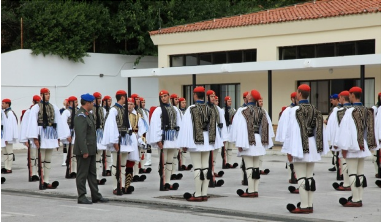
Μέσα στο στρατόπεδο, λίγο προτού φτάσει η μπάντα για να ξεκινήσει η παρέλαση

Είναι η δεύτερη μέρα του ρεπορτάζ μας. Είναι Κυριακή και έχουμε επιστρέψει στο στρατόπεδο.