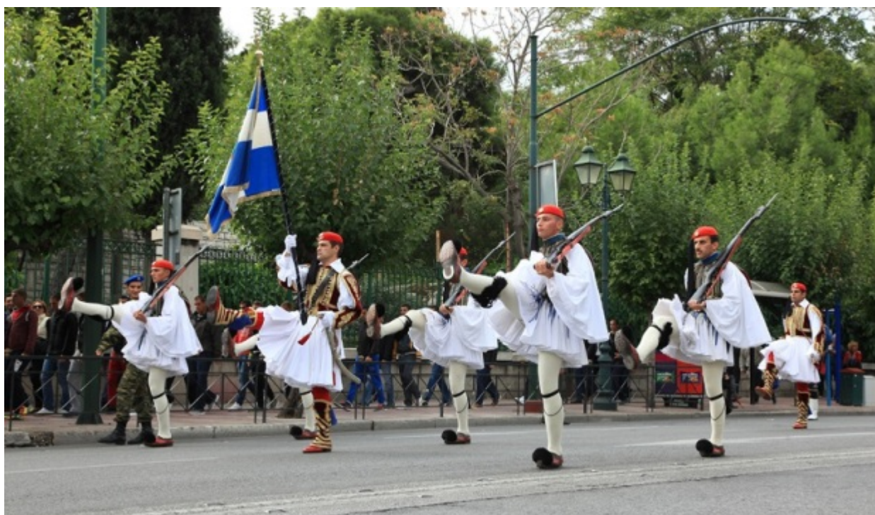
Στιγμιότυπο από την παρέλαση της Κυριακής στη Βασ. Σοφίας