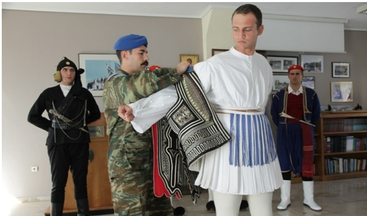
Ο Εύζωνας φοράει τη φέρμελη (γιλέκο) ενώ πίσω του διακρίνονται δύο Εύζωνες με την ποντιακή και την κρητική στολή. Το rontos-news βρέθηκε μέσα στο στρατόπεδο της Ηρώδου Αττικού

«Μας πιάνει ρίγος για τη Φρουρά. Οι Εύζωνοι φεύγουν από εδώ και πάνε κάτω στο μνημείο. Κάποια στιγμή χτυπάνε τα πόδια τους επιβλητικά. Τα χτυπάνε για να ακούν οι πρόγονοί μας ότι είμαστε ζωντανοί και ελεύθεροι. Ντύνεται η Φρουρά και βγαίνει έξω και βγαίνουμε και εμείς και τους χαζεύουμε, που τους βλέπουμε καθημερινά», λέει ο τσαρουχοποιός Γιώργος Δερματάς.