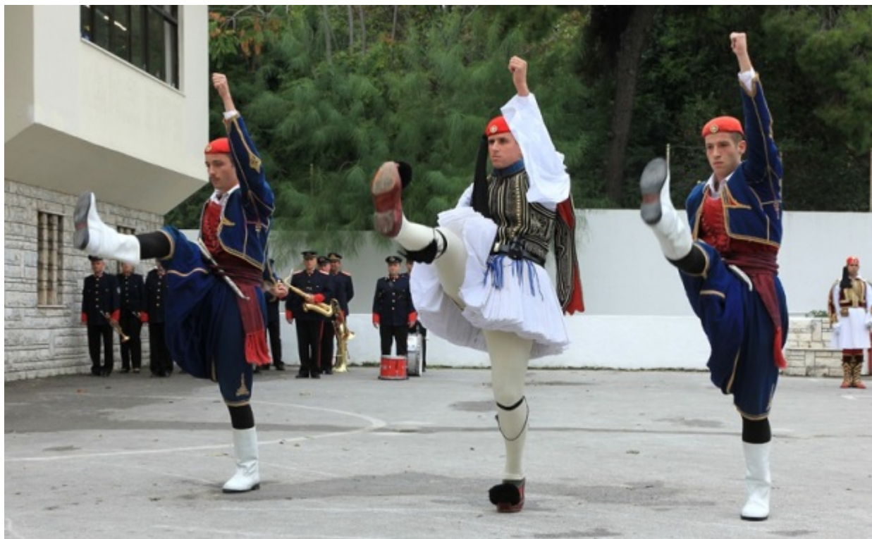
Πριν από την παρέλαση της Κυριακής γίνεται παράδοση-παραλαβή της σημαίας μέσα στο στρατόπεδο

Τους Εύζωνες που είναι έτοιμοι να παρελάσουν τους βλέπουν και οι νεοσύλλεκτοι. Δεν έχουν παρακολουθήσει όλη την προετοιμασία, «για την αναμονή και την προσδοκία», μας εξηγεί ο διοικητής. Αργότερα, μας αποκαλύπτει ότι είναι παράδοση οι νεοσύλλεκτοι να μην πατούν στον λεγόμενο «τσαρουχόδρομο», στο πεζοδρόμιο της Βασιλίσσης Σοφίας. Όσο και αν φαίνεται δύσκολο, εξαιτίας του κόσμου που στριμώχνεται όσο η Προεδρική Φρουρά παρελαύνει στο οδόστρωμα, πράγματι οι νεοσύλλεκτοι δεν πατούν στο φθαρμένο από τα τσαρούχια κομμάτι του πεζοδρομίου.