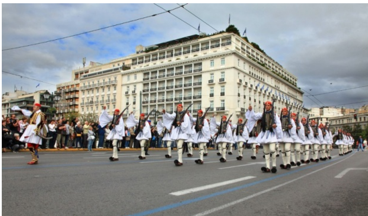
Στιγμιότυπο από την παρέλαση της Κυριακής στη Βασ. Αμαλίας