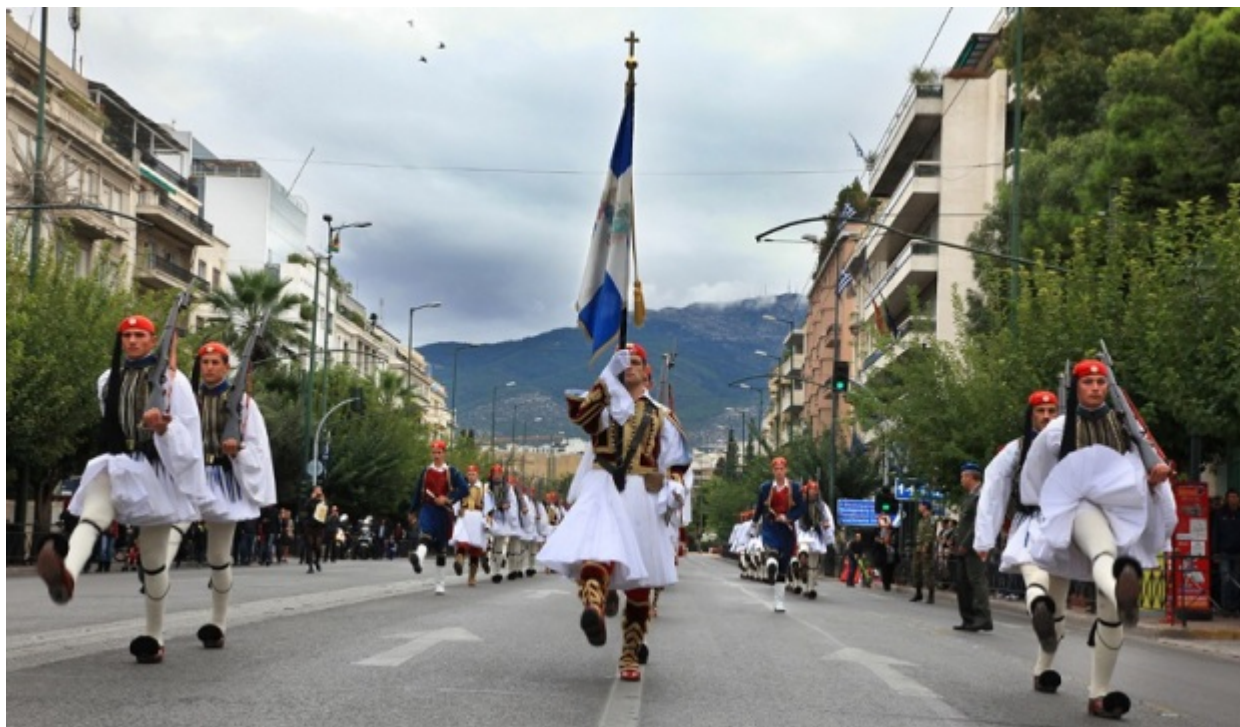
Στιγμιότυπο από την παρέλαση της Κυριακής στη Βασ. Σοφίας