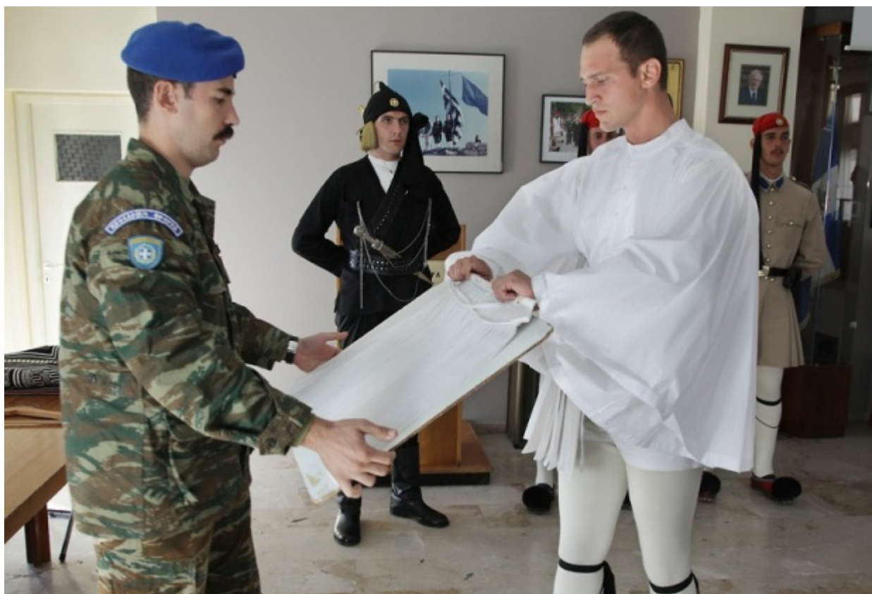
Οι πιέτες της φουστανέλας ισιώνονται μία-μία πάνω στην τάβλα

Το πιο περίτεχνο κομμάτι της ευζωνικής στολής είναι η φέρμελη, το γιλέκο. Στα πόδια μπαίνουν οι καλτσοδέτες, πάνω από τη φουστανέλα τα μπλε και άσπρα κρόσσια και στο κεφάλι το φάριο από κόκκινη τσόχα, με τη χαρακτηριστική φούντα από μαύρο μετάξι.