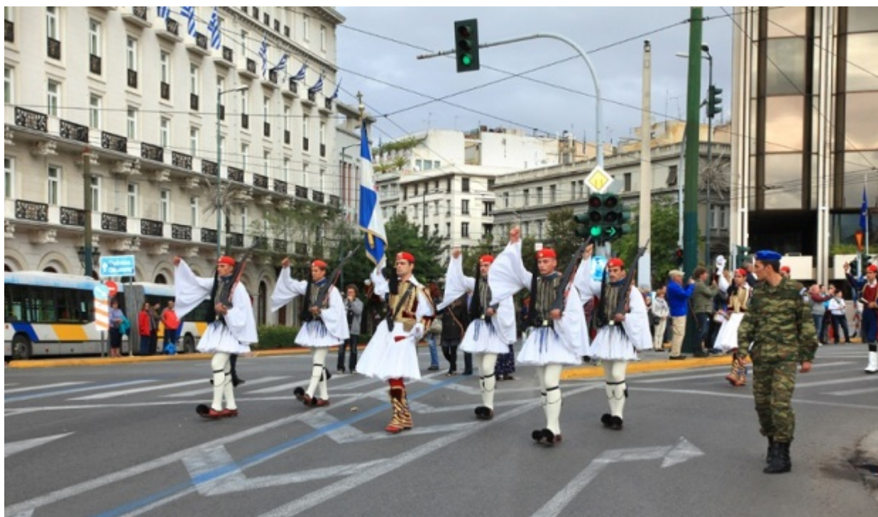
Στιγμιότυπο από την παρέλαση της Κυριακής στη Βασ. Αμαλίας