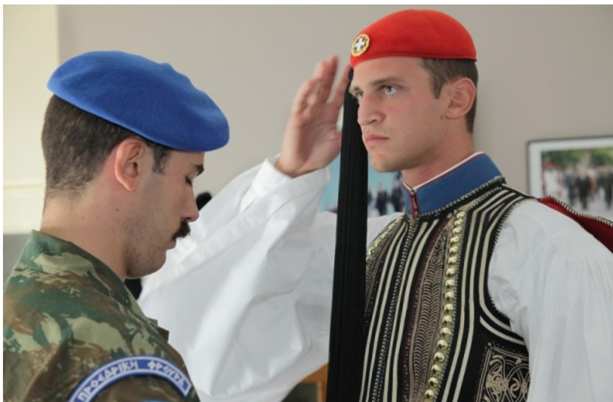
Το κόκκινο στο φάριο είναι για το αίμα των Ελλήνων, το μαύρο για τα δάκρυά τους στην Τουρκοκρατία

Όση εκπαίδευση θέλει ένας Εύζωνας προκειμένου να μάθει να φορά τη στολή του, ακόμα περισσότερη χρειάζεται για να μάθει να περπατάει με τα άκαμπτα τσαρούχια. «Οι υπηρεσίες εδώ δεν είναι εύκολες. Σκεφτείτε ότι πριν από λίγες ημέρες σε μια κατάθεση στεφάνου οι Εύζωνες έμειναν 1 ώρα και 40 λεπτά στο επ' ώμου. Σκεφτείτε επίσης ότι το όπλο ζυγίζει επτά κιλά. Και το χειρότερο ήταν ότι τα παιδιά δεν το περίμεναν πως θα έμεναν τόση ώρα», μας λέει ένας αξιωματικός. Οι παρατάξεις του Προέδρου και τα διαπιστευτήρια είναι εκείνες οι περιστάσεις που απαιτούν, συνήθως, τις μεγαλύτερης διάρκειας ακινησίες.