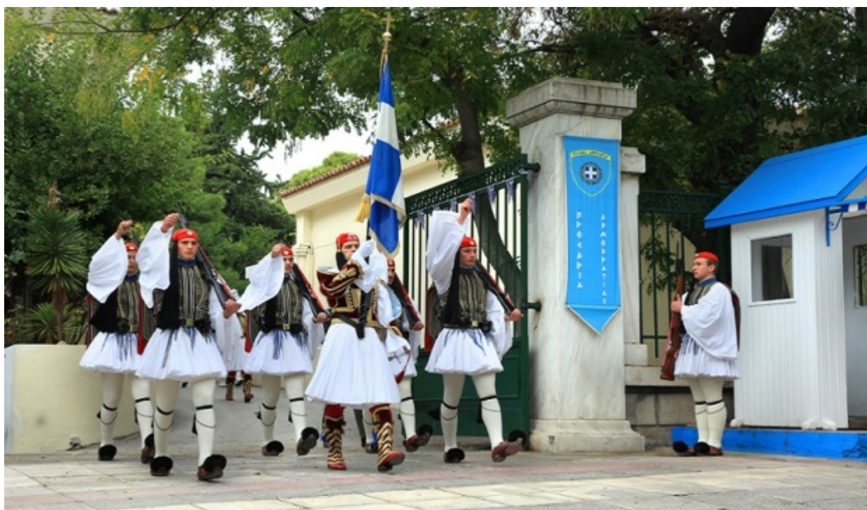
Ο σημαιοφόρος είναι αξιωματικός. Η φουστανέλα του είναι πιο μακριά και η φέρμελη (γιλέκο) κεντημένη με χρυσή κλωστή