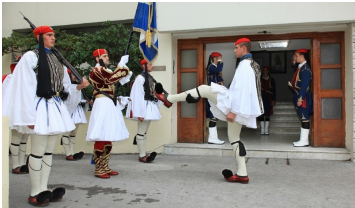
Κάθε Κυριακή πρωί οι Εύζωνες κάνουν παρέλαση έως τον Άγνωστο Στρατιώτη. Προτού ξεκινήσει η παρέλαση, μέσα στο στρατόπεδο γίνεται η παραλαβή της σημαίας με κάθε επισημότητα