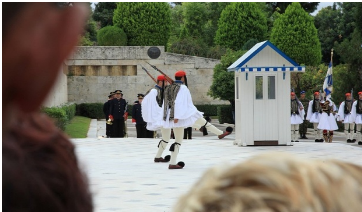
Τα τουριστικά πρακτορεία φροντίζουν να εντάξουν στις ξεναγήσεις τους την ευζωνική παρέλαση