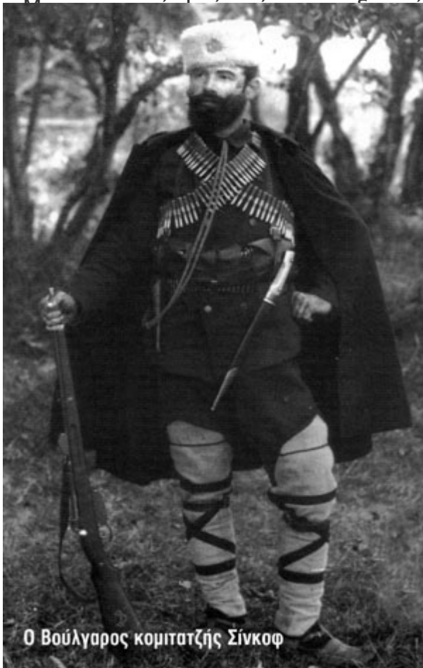
Ο Βούλγαρος κομιτατζής Σίνκοφ

το έβαλε σ' ένα κουπάκι, γέμισε νερό το μπρίκι του καφέ και το έβαλε στα κάρβουνα. Όλα αυτά γοργά, σιωπηλά, χωρίς κρότους. Η προσοχή της ήταν όλη στην πόρτα, το αυτί της τεντωμένο δυνατά κατά το δρόμο. Βήματα πλησίαζαν. Κάποιος χτύπησε δυνατά την πόρτα.