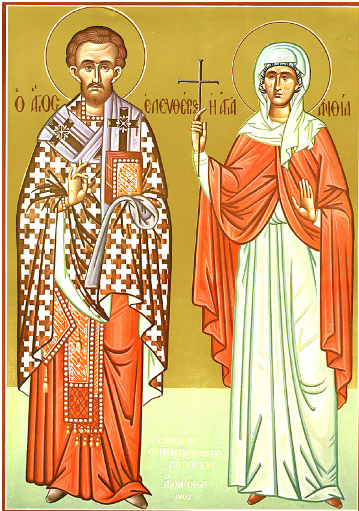
Ο Άγιος Ελευθέριος με την μητέρα του Αγία Ανθία