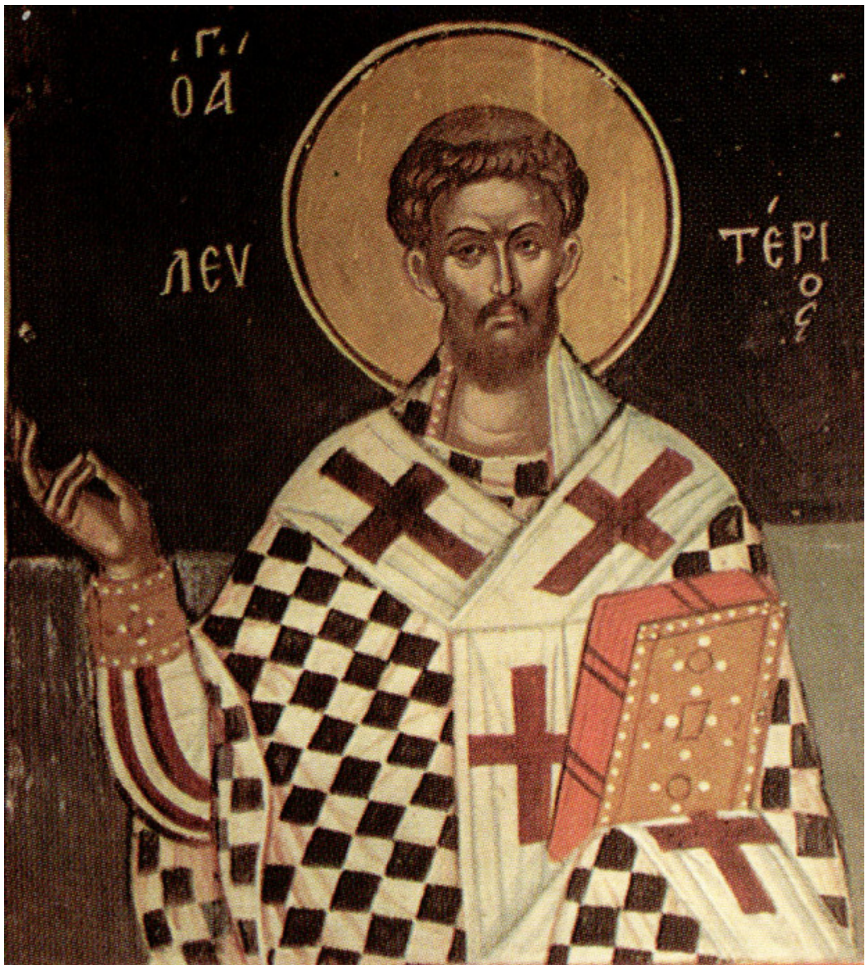
Άγιος Ελευθέριος ο Ιερομάρτυρας