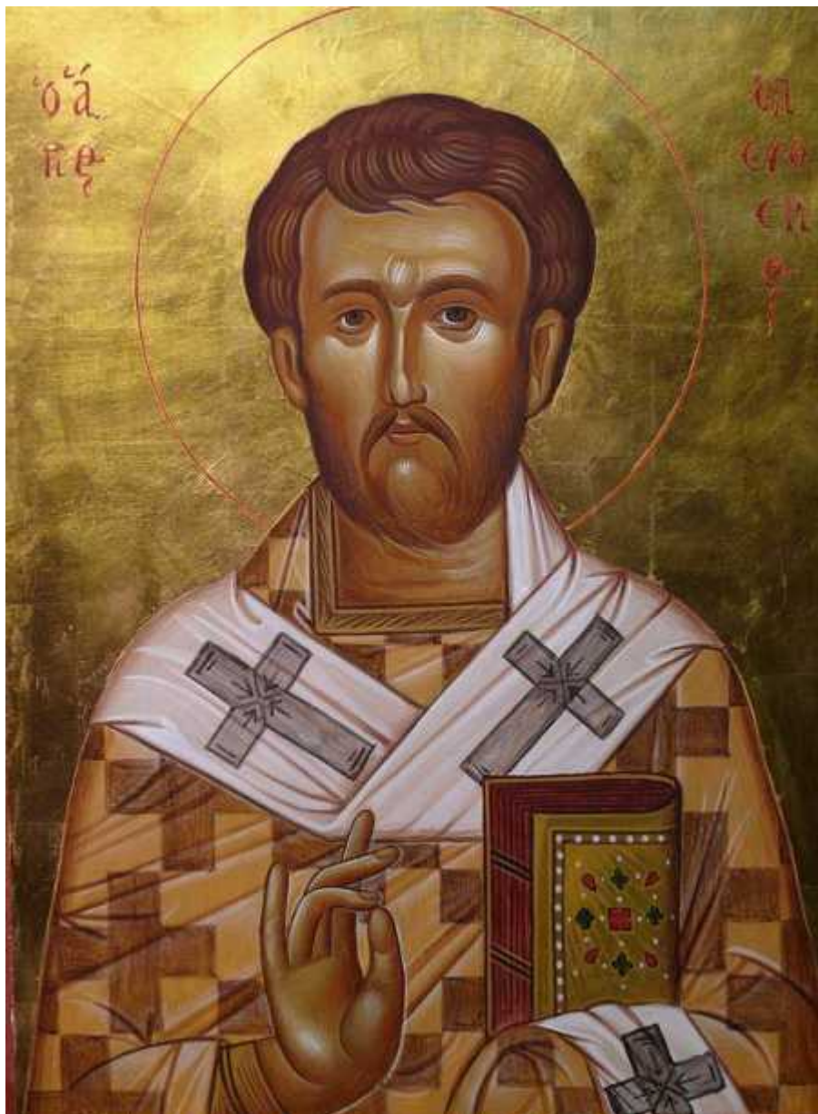
Άγιος Ελευθέριος ο Ιερομάρτυρας - Αυγοτέμπερα επί ξύλου - Βρίσκεται στο Ίδρυμα του Ευαγγελιστού Μάρκου στην Θέρμη Θεσσαλονίκης - Γιώργος Χατζής© ( hatzis-art.blogspot.com )

Εορτάζει στις 15 Δεκεμβρίου εκάστου έτους.