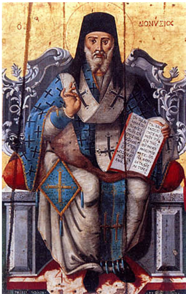
Άγιος Διονύσιος ο Νέος, ο Ζακυνθινός Αρχιεπίσκοπος Αιγίνης. Φορητή εικόνα στο Ναό Αγίου Νικολάου στην Εξωχώρα Ζακύνθου, έργο ιερέως Πέτρου Βόσσου, 1786 μ.Χ.