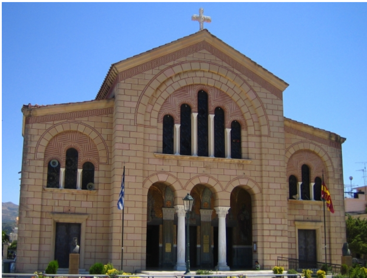
Ναός του Αγίου Διονυσίου στη Ζάκυνθο