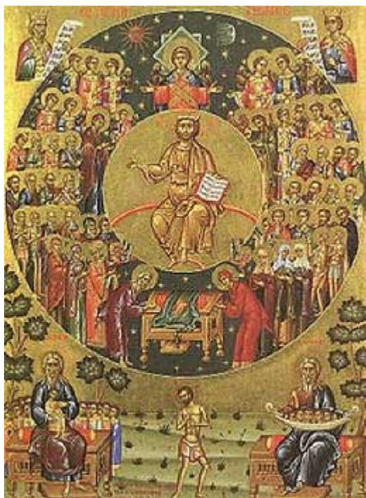
Όσιος Ευθύμιος ηγούμενος Βατοπεδίου και οι Δώδεκα μοναχοί Βατοπεδινοί

Από το βιβλίο του Μοναχού Μωϋσέως Αγιορείτου, Βατοπαιδινό Συναξάρι, Έκδοσις: Ιεράς Μεγίστης Μονής Βατοπαιδίου, Άγιον Όρος, 2007