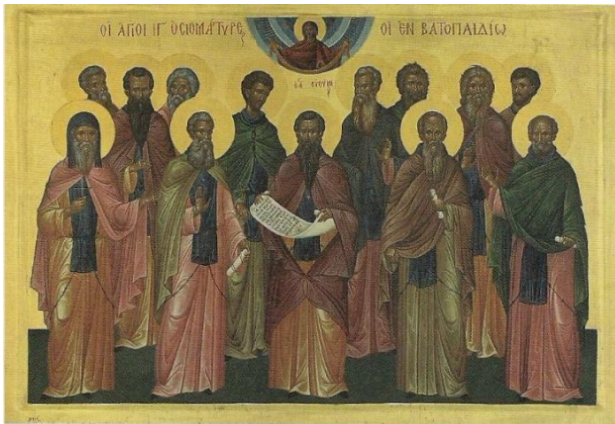
Οι 13 Όσιομάρτυρες Βατοπεδινόι. Σύγχρονη φορητή εικόνα Γ. Μ. Βατοπεδίου.

Η μνήμη των αγίων ενδόξων οσιομαρτύρων τελείται στις 4 Ιανουαρίου. Ο Οσιομάρτυς Ευθύμιος υπάρχει σε τοιχογραφία του νάρθηκα του Καθολικού του 1819.