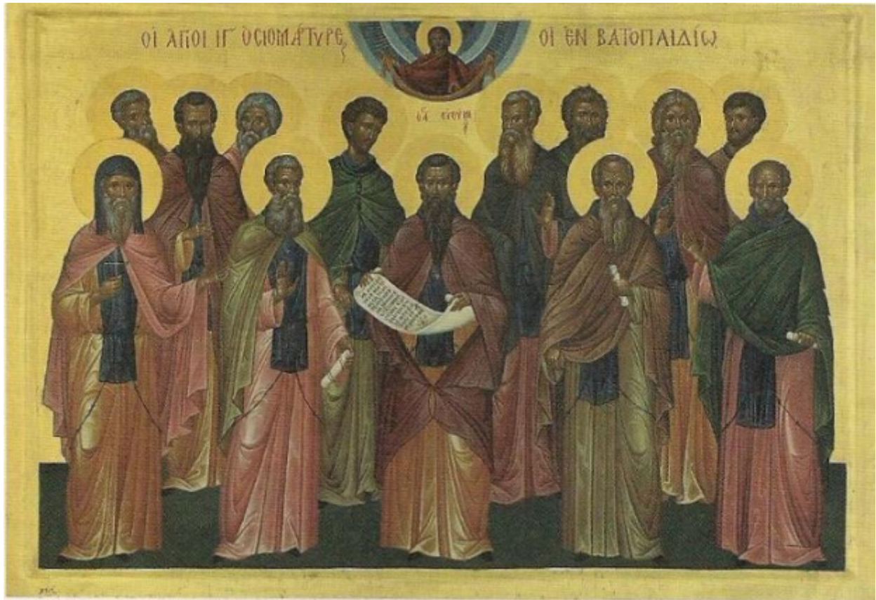
Οί 13 Όσιομάτνρες Βατοπεδινοί. Σύγχρονη φορητή εικόνα Γ. Μ. Βατοπεδίου.