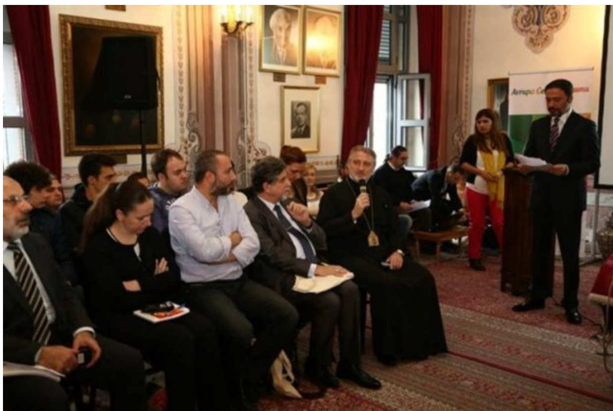
Στιγμιότυπο από εκδήλωση που φιλοξενήθηκε στη Μονή Αγίας Τριάδος.

που αποτελούν αντικείμενο νέας συνεργασίας της βιβλιοθήκης της Θεολογικής Σχολής της Χάλκης με την ελλαδική Βιβλιοθήκη της Βουλής. «Είναι μία από τις υποδειγματικές βιβλιοθήκες στην Ελλάδα και ήρθαμε σε επαφή μαζί της για τη μεταφορά τεχνογνωσίας στην καταλογογράφηση και στην ταξινόμηση αυτού του υλικού». Ομάδα εργασίας από τη Βιβλιοθήκη της Βουλής επισκέφθηκε στα μέσα Δεκεμβρίου τη Χάλκη για την πρώτη επιτόπια εκτίμηση του υλικού. Μνημόνιο συνεργασίας με τη Βιβλιοθήκη της Βουλής έχει προγραμματιστεί να υπογραφεί κατά την επίσκεψη του Προέδρου της Ελληνικής Βουλής στην Κωνσταντινούπολη τον Ιανουάριο - αν βέβαια δεν ακυρωθεί λόγω των πολιτικών εξελίξεων στην Ελλάδα. Προβλέπει τη μεταφορά τεχνογνωσίας και την εκπαίδευση των στελεχών της Βιβλιοθήκης της Θεολογικής Σχολής της Χάλκης από το προσωπικό της Βιβλιοθήκης της Βουλής και υποστήριξη στις εργασίες ταξινόμησης και καταλογογράφησης του υλικού.