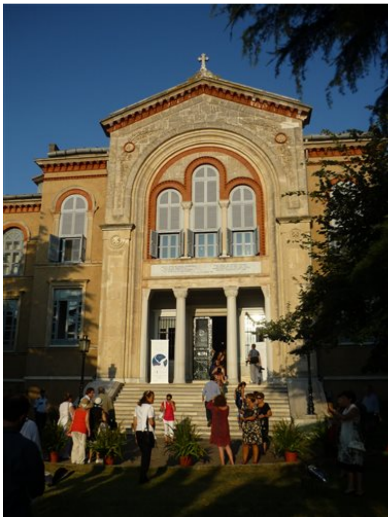
Ο προαύλιος χώρος της Μονής της Χάλκης.