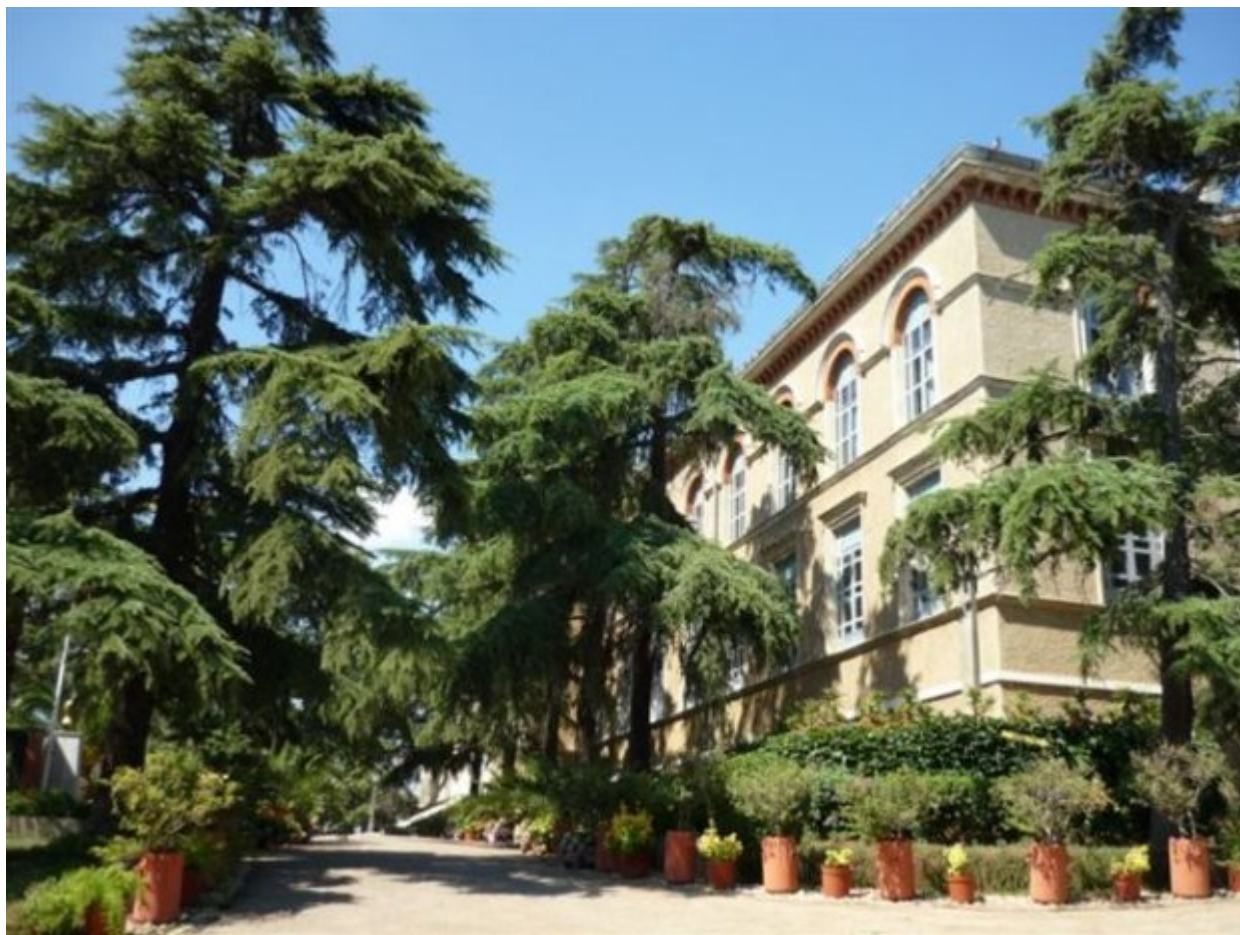
Ο προαύλιος χώρος της Μονής της Χάλκης.