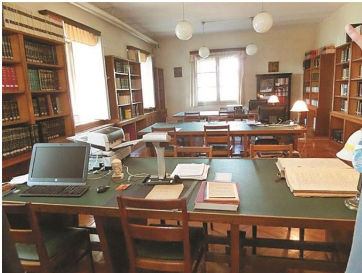
Το αναγνωστήριο και γραφείο του βιβλιοφύλακα.

Σκοπός του είναι γενικότερα «η ανάπτυξη δραστηριοτήτων επιστημονικών και καλλιτεχνικών που φέρνουν στην επικαιρότητα τη Θεολογική Σχολή της Χάλκης και υπογραμμίζουν τις δυνατότητές της και τι μπορεί να προσφέρει στην τουρκική κοινωνία. Πώς το μοναστήρι και η λειτουργούσα σχολή προσφέρουν ευκαιρίες ανάδειξης της χώρας στην οποία βρίσκονται».