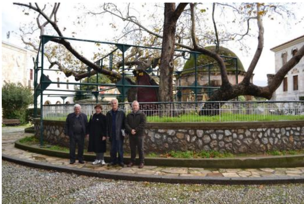
Μπροστά στον Πλάτανο του Ιπποκράτη

Η μετάβαση από το καθαρά ιστορικό μέρος της μελέτης, στο οποίο αναδεικνύονται από τον συγγραφέα ενδιαφέροντα στοιχεία της τοπικής ιστορίας, στο λαογραφικό γίνεται ομαλά με την εμφάνιση της μορφής της Οσίας, η οποία βήμα βήμα, πρώτα με την περιγραφή του ναού της, έπειτα με την αναφορά στην προέλευση και την ετυμολογία του ονόματός της και, τέλος, με την παρουσίαση των στιχηρών που συνέθεσε γι' αυτή ο Μητροπολίτης Ρόδου Μητροφάνης, αναδύεται ζωντανή μπροστά στα μάτια του αναγνώστη.