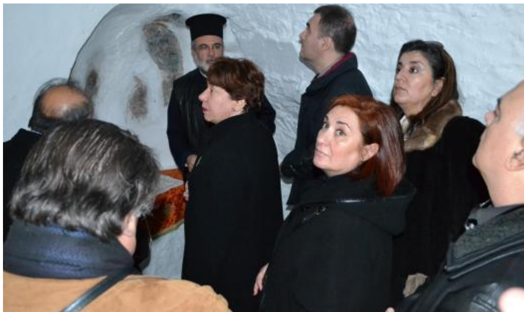
Ο Σεβασμιώτατος με τους επισκέπτες στον Ιερό Ναό της Οσίας Μελούς

Για το λόγο αυτό αμέσως μόλις η Ιερά Μητρόπολις Κώου και Νισύρου ξεκίνησε την προσπάθεια να ξαναζωντανεύσει η μνήμη της Οσίας υπήρξε άμεση ανταπόκριση από τους πιστούς.