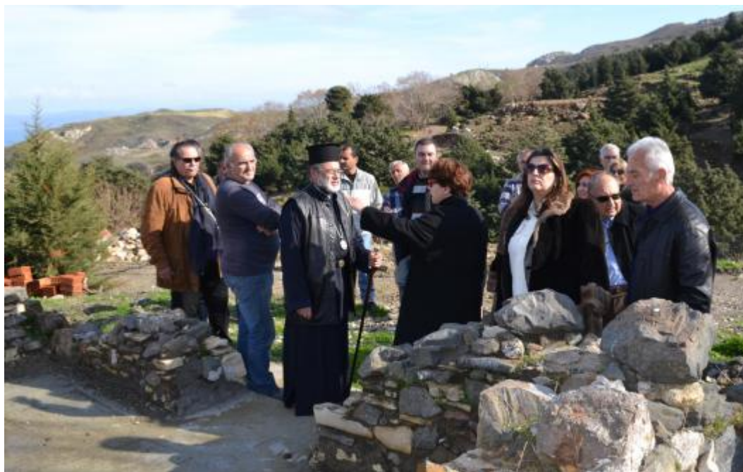
Ο Σεβασμιώτατος με τους επισκέπτες στην Ιερά Μονή Οσίας Μελούς

Καθοριστικό σημείο για την ολοκλήρωση της εργασίας είναι η ανάγνωση από τον συγγραφέα της επιγραφής που βρίσκεται στο ανώφλιο του ναού, η οποία παρέμεινε για πολλά χρόνια καλυμμένη κάτω από στρώμα ασβέστη. Σύμφωνα με την έρευνα τελευταίος την είχε δει ο κώος ιστοριοδίφης Ιάκωβος Ζαρράφτης , ο οποίος, όμως, δυστυχώς, την ανέγνωσε εσφαλμένα. Όλοι οι κατοπινοί μελετητές χρησιμοποίησαν τη δική του μεταγραφή ως βάση για να προχωρήσουν στην έρευνά τους με αποτέλεσμα το λάθος να διαιωνίζεται μέχρι τις μέρες μας και να οδηγεί τους ερευνητές σε δύσβατους και ατελέσφορους δρόμους.