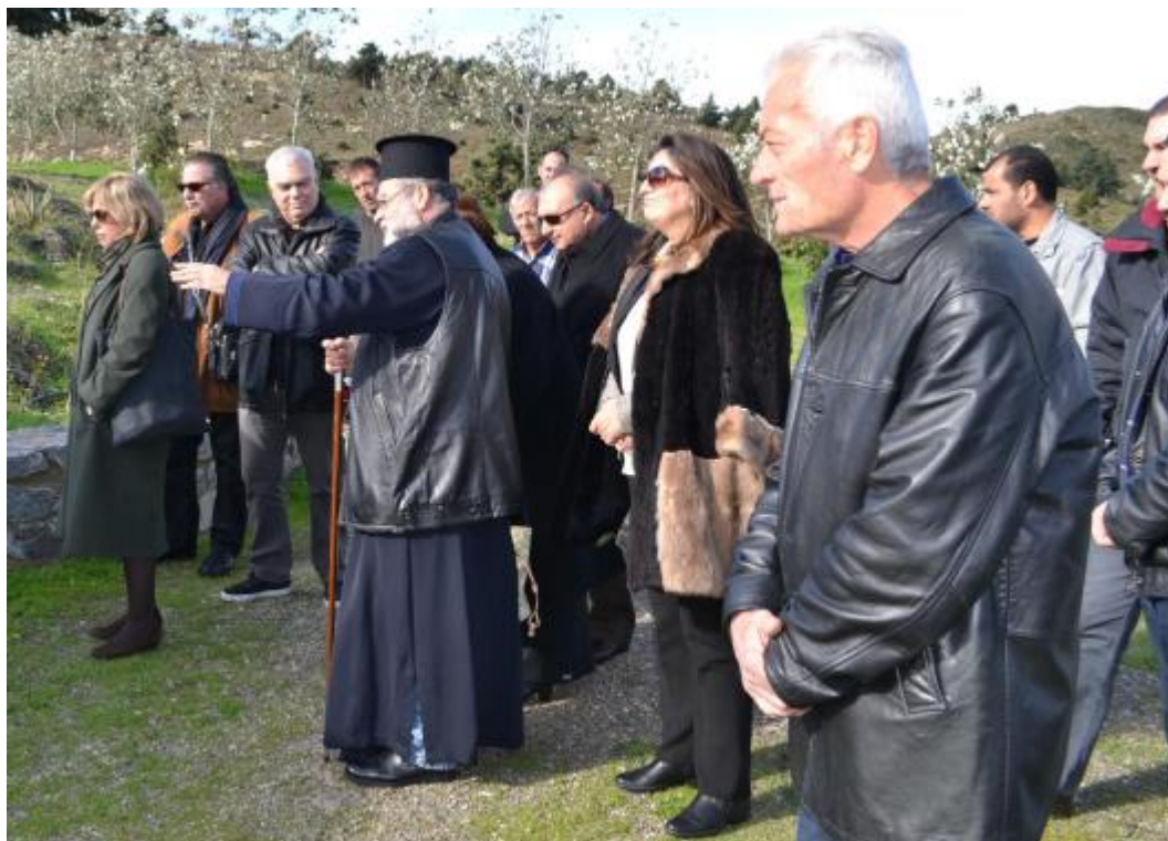
Ο Σεβασμιώτατος με τους επισκέπτες στην Ιερά Μονή Οσίας Μελούς