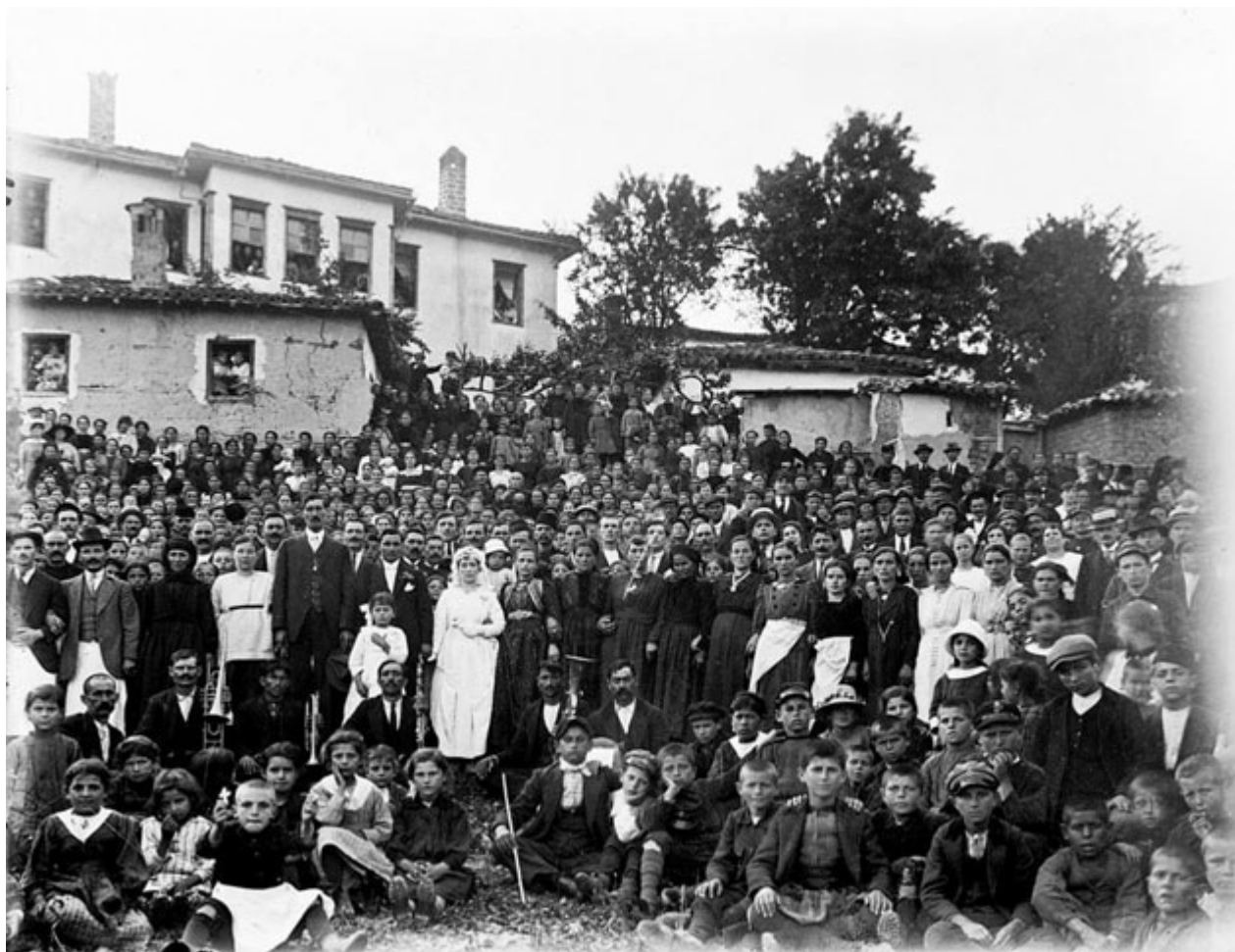
Γάμος, αρχές 20ού αιώνα

Με την έκρηξη του Α΄ Παγκοσμίου Πολέμου οι φωτογραφίες καταγράφουν τα γαλλικά στρατεύματα στην πόλη το Νοέμβριο του 1916, ενώ το Μάρτιο του 1917 την πόλη επισκέπτεται ο επικεφαλής των συμμαχικών δυνάμεων στη Θεσσαλονίκη στρατηγός Μωρίς Σαράιγ. Απεικονίζεται επίσης σε διάφορες κρίσιμες ή καθημερινές στιγμές η πλατεία Αγοράς (από το 1922 πλατεία Αιμιλιανού) που έχει παίξει ζωτικό ρόλο στη ζωή της πόλης. Οι αναπαραστάσεις αποκεφαλισμένων ληστών υπενθυμίζουν τη μάστιγα των συμμοριών που λυμαίνονταν την περιοχή από την Τουρκοκρατία ακόμη, φαινόμενο που εντάθηκε με την απελευθέρωση.