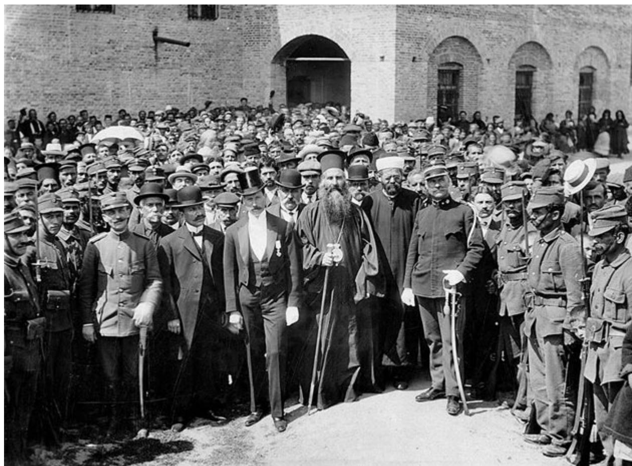
Στον αύλειο χώρο της εκκλησίας του Αγίου Αχιλλείου, 21 Μαΐου 1913.

Ένας αριθμός καλοστημένων ομαδικών πορτραίτων αντίστοιχα, υποδεικνύει τη συγκρότηση του κοινωνικού ιστού της πόλης μέσα από την ίδρυση το 1926 της Φιλαρμονικής Εταιρείας «Ο Ορφεύς» και το 1927 της Φιλοπτώχου Αδελφότητας «Η Αγαθοεργία». Το 1927 ακολουθεί η ίδρυση του Φιλοπροοδευτικού Συνδέσμου Νέων Γρεβενών «Πυρσός». Οι πανηγυρισμοί για την άνοδο της ποδοσφαιρικής ομάδας του Συνδέσμου στη Β΄ εθνική κατηγορία το 1971 αποδεικνύουν τη μεγαλύτερη επιτυχία του. Οι φωτογραφίες φυλλομετρούν πολλά ακόμη σημαντικά σκαλοπάτια στην εξέλιξη της πόλης: τα εγκαίνια το 1928 του Εθνικού Οικοτροφείου Αρρένων στο πρώην τουρκικό νοσοκομείο, τη θεμελίωση το ίδιο έτος εξατάξιου δημοτικού σχολείου και γυμνασίου, τη λειτουργία στην πόλη ρουμανικού γυμνασίου.