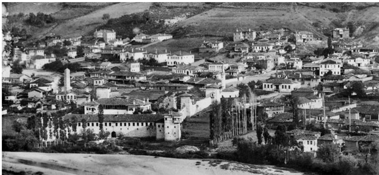
Μερική άποψη των Γρεβενών, 1900.

Τα Γρεβενά, ως κοιτίδα των Δωριέων και τμήμα της Αρχαίας Μακεδονίας, διαθέτουν μακραίωνη ιστορία και δέχθηκαν την επιρροή του θεσσαλικού, ηπειρωτικού και μακεδονικού χώρου. Τα αρχαιολογικά ευρήματα της περιοχής άλλωστε, επιβεβαιώνουν μία πολιτισμική όσμωση χιλιετιών. Στην πορεία αυτή, τα «Γριβάννα», όπως τα ανέφερε ο Βυζαντινός αυτοκράτορας Κωνσταντίνος Πορφυρογέννητος, διετέλεσαν βυζαντινό φυλάκιο που κατελήφθη από τους Οθωμανούς το 1385.