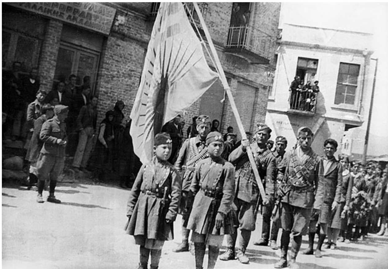
Αντάρτες του ΕΑΜ-ΕΛΑΣ εισέρχονται στην πλατεία Αιμιλιανού, 25 Μαρτίου 1943.

Ακολουθεί τον Ιούλιο του 1944 η λεηλασία και η πυρπόληση της πόλης από τα γερμανικά στρατεύματα, με την καταστροφή 125 εμπορικών καταστημάτων και 350 κτισμάτων, μεταξύ των οποίων η Μητρόπολη, το Γυμνάσιο, το Οικοτροφείο, το Κρατικό Νοσοκομείο και το Δικαστικό Μέγαρο. Τον Ιούλιο του 1947 ο ελληνικός στρατός αποκρούει την επίθεση των ανταρτών για την κατάληψη της πόλης: οι φωτογραφίες φανερώνουν, σε μια σκληρή μαρτυρία εποχής, σωρούς από πτώματα ανταρτών.