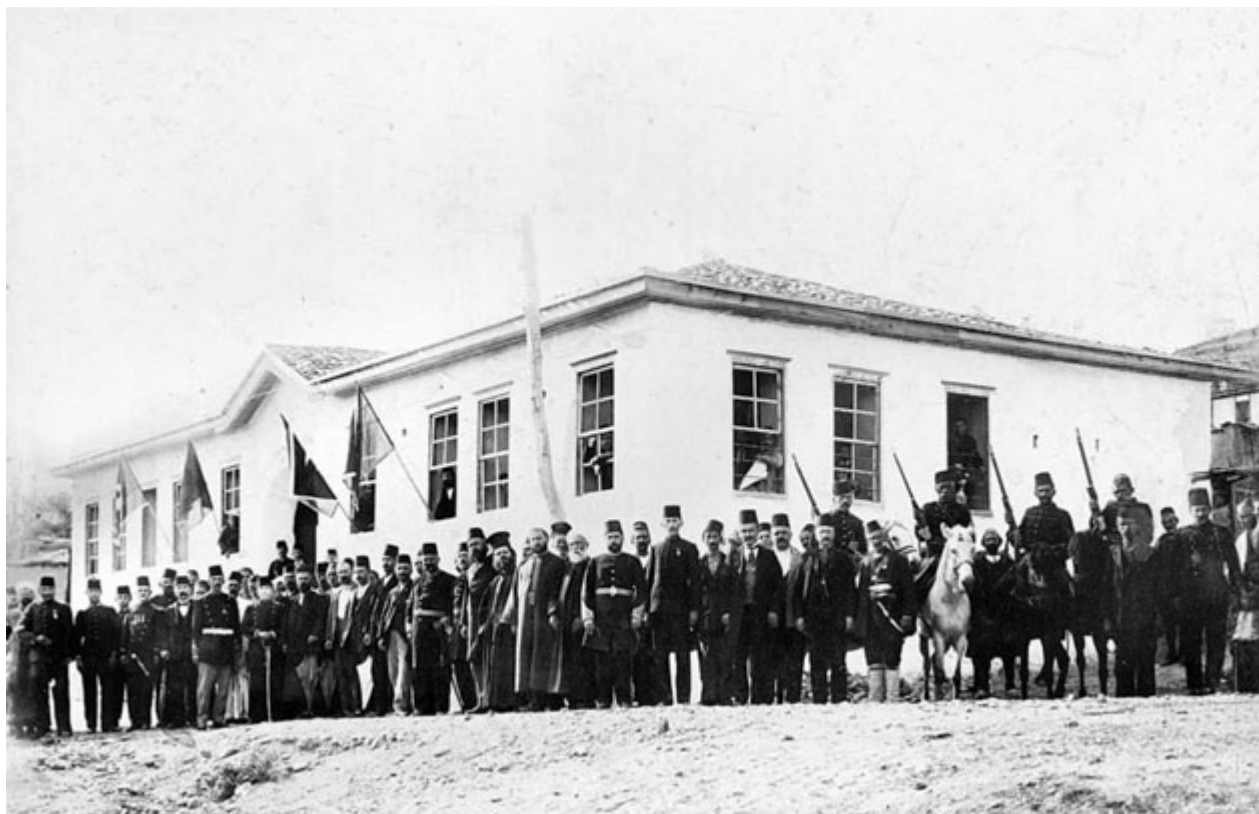
Οθωμανικοί στρατώνες στο λόφο «Κισλά», 1910-1912.

Ενδεικτικό της δημογραφικής σύνθεσης είναι το γεγονός ότι στους εκλογικούς καταλόγους της πόλης το 1914 αναγράφονται, σε σύνολο 653 ανδρών, 157 άνδρες με μουσουλμανικά επίθετα. Δέκα χρόνια αργότερα, στο πλαίσιο ανταλλαγής πληθυσμών που επέβαλε η Συνθήκη της Λωζάνης, οι μουσουλμανικές οικογένειες της πόλης αποχωρούν. Ιστορικά κτίσματα, όπως οι στρατώνες, τα τζαμιά, το επιβλητικό κονάκι του μπέη, το ιεροδιδασκαλείο και το νεκροταφείο (τη μορφή κάποιων από τα οποία διασώζουν οι φωτογραφίες), κατεδαφίζονται και ένα κομμάτι της οθωμανικής αρχιτεκτονικής των Γρεβενών χάνεται για πάντα.