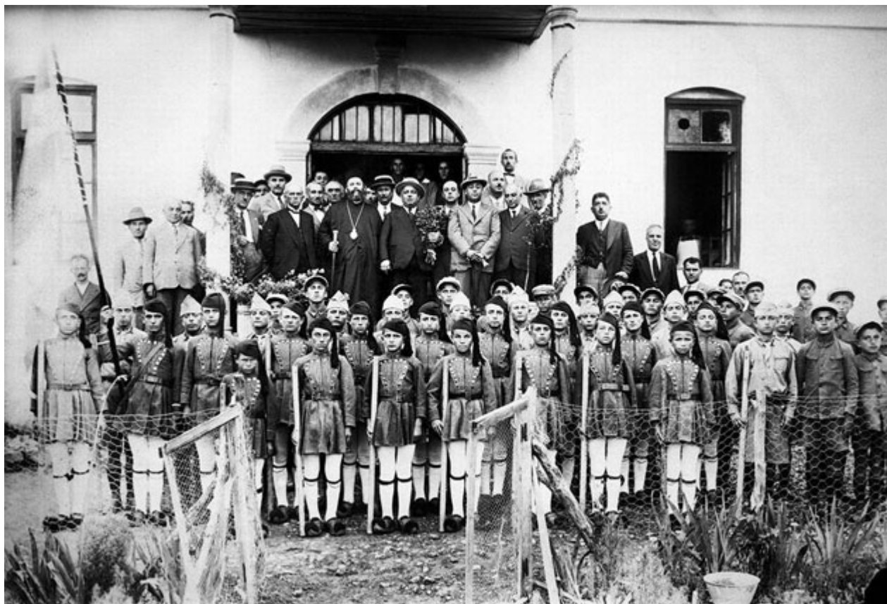
Ο Υπουργός Πρόνοιας Λεωνίδα Ιασωνίδη επισκέπτεται το Εθνικό Οικοτροφείο Αρρένων, 9 Σεπτεμβρίου 1931.

Όμοια, ο φακός καταγράφει, μετά την κήρυξη του Ελληνοϊταλικού πολέμου το 1940, τους άντρες που πύκνωσαν τις τάξεις του ελληνικού στρατού στα Γρεβενά, συντρίβοντας μετά την ιταλική μεραρχία αλпинιστών Τζούλια στο βορειοδυτικό τμήμα του νομού. Απαθανατίζει την απελευθέρωση της πόλης από τις δυνάμεις του ΕΑΜ-ΕΛΑΣ τον Μάρτιο του 1943 μετά τις νικηφόρες μάχες του Σνίχοβου και του Φαρδύκαμπου, και την επίσκεψη των ηγετών του ΕΑΜ-ΕΛΑΣ Μάρκου Βαφειάδη και Στέφανου Σαράφη το 1943-1944.