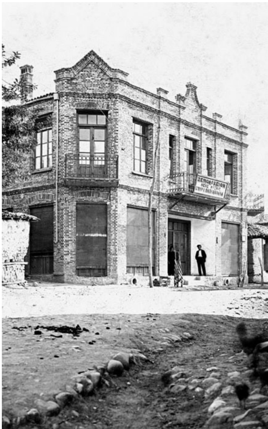
Το Ξενοδοχείο «Νέος Κόσμος» στην οδό Μεγάλου Αλεξάνδρου, 1929 .

Τη δεκαετία του 1960 η εσωτερική μετανάστευση προς τις μεγάλες πόλεις της χώρας καθώς και η μετανάστευση προς το εξωτερικό αποδυναμώνουν και πάλι πληθυσμιακά την πόλη και αλλοιώνουν τη συλλογική της συνείδηση, ενόσω η πρακτική της αντιπαροχής τραυματίζει ευδιάκριτα, κατ' εξακολούθηση και αμετάκλητα την ιδιαίτερη τοπιογραφία της. Στην αυγή της μεταπολίτευσης η πόλη έρχεται αντιμέτωπη με τα προβλήματα που μέχρι σήμερα ταλαιπωρούν το μεγαλύτερο μέρος της ελληνικής ενδοχώρας. Η έκθεση φιλοτεχνεί τελικά ένα σπονδυλωτό πορτραίτο της πόλης των Γρεβενών που φτιάχτηκε ψηφίδα-ψηφίδα μέσα από οκτώ δεκαετίες γεμάτες αγώνες και ανακατατάξεις, πολέμους και