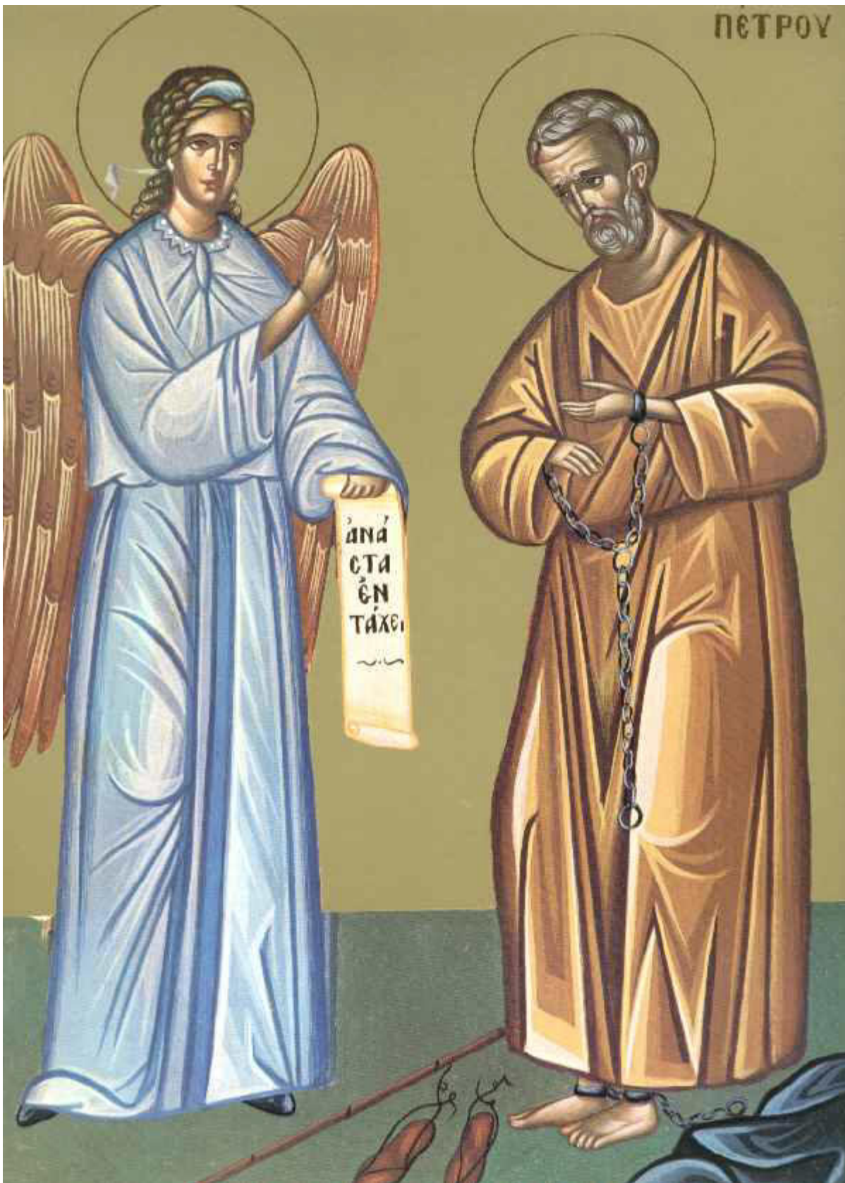
Η Τίμια Αλυσίδα του Αποστόλου Πέτρου