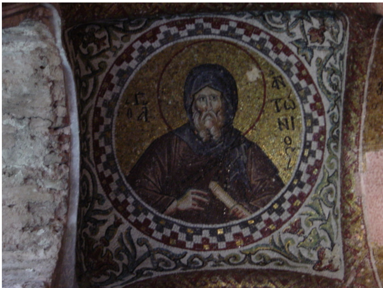
Άγιος Αντώνιος ο Μέγας, Μονή Παμμακάριστου