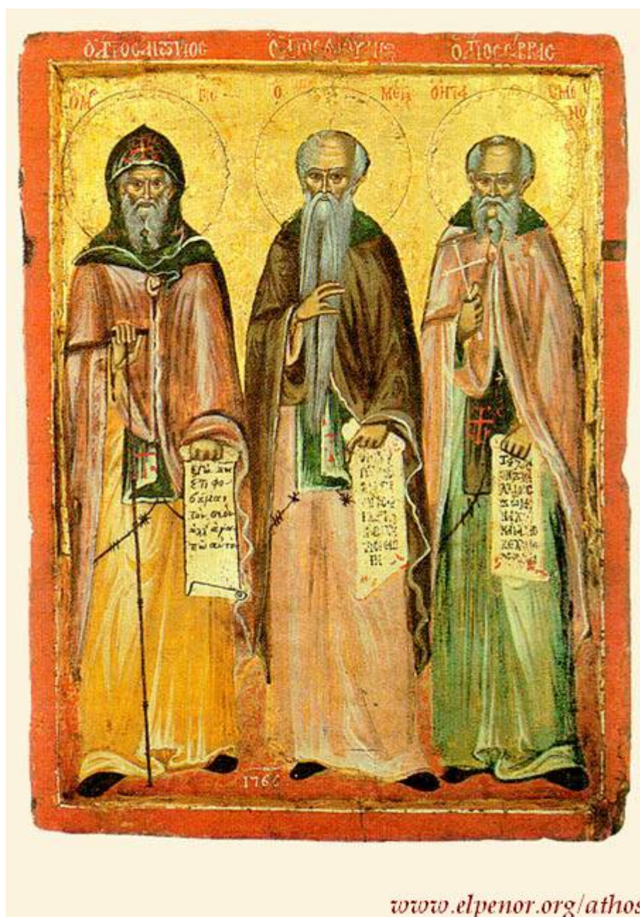
www.elpenor.org/athos Άγιοι Αντώνιος, Ευθύμιος και Σάββας ο Ηγιασμένος - 1766 μ.Χ. - Νέα Σκήτη, Άγιον Όρος