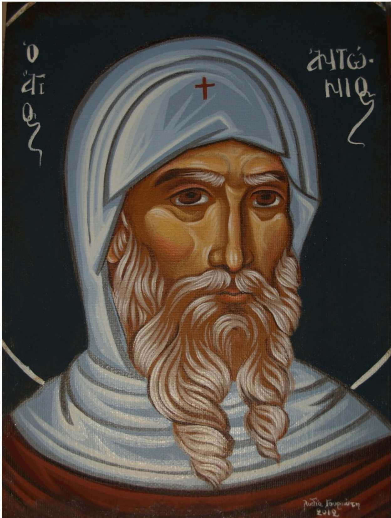
Άγιος Αντώνιος ο Μέγας - Λυδία Γουριώτη© ( lydiagourioti-iconography.blogspot.gr )