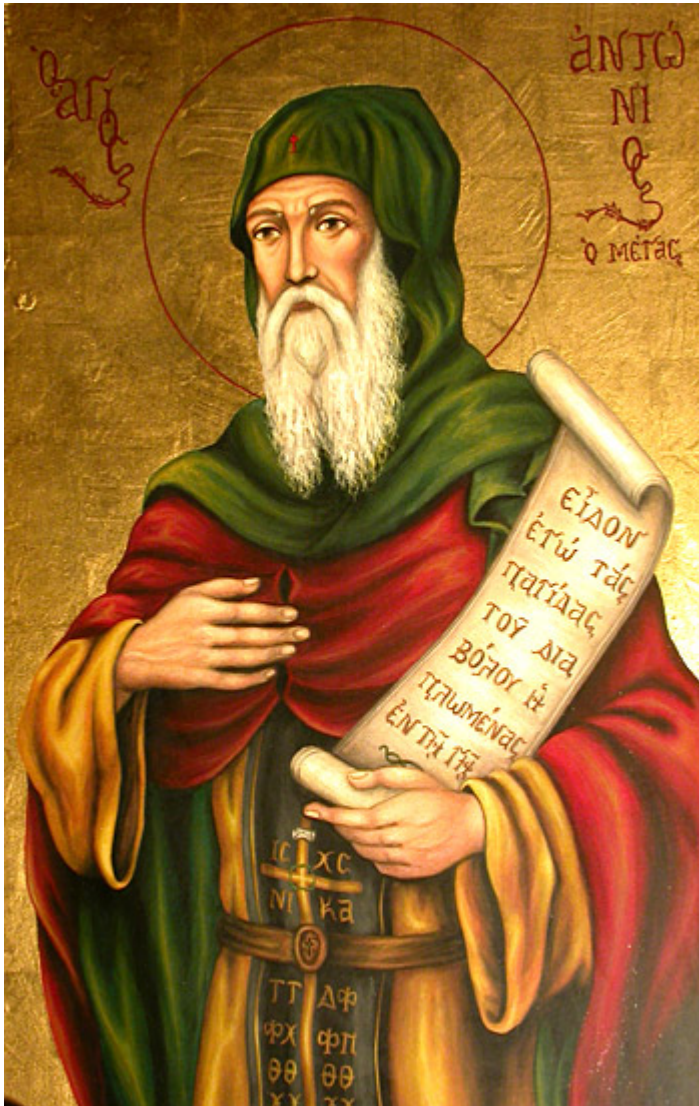
Άγιος Αντώνιος ο Μέγας

Εορτάζει στις 17 Ιανουαρίου εκάστου έτους.