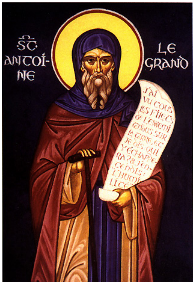
Άγιος Αντώνιος ο Μέγας