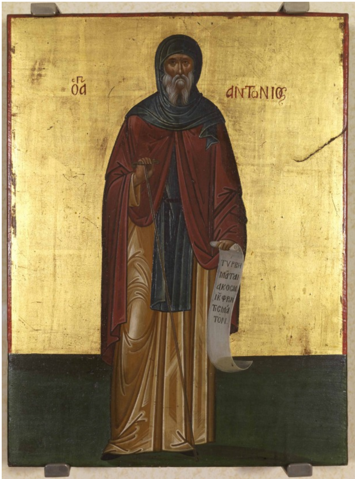
Άγιος Αντώνιος ο Μέγας - άγνωστος ζωγράφος κρητικού εργαστηρίου, τέλη 16ου - αρχές 17ου αιώνα μ.Χ.