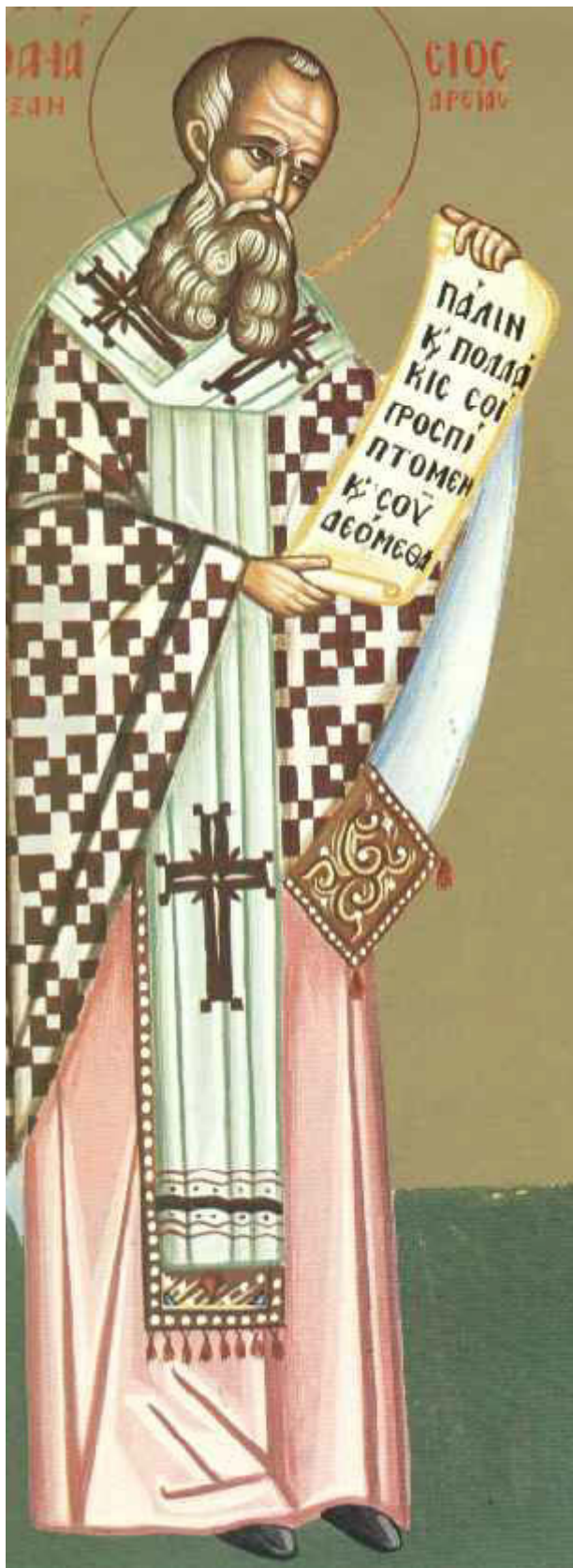
Άγιος Αθανάσιος ο Μέγας