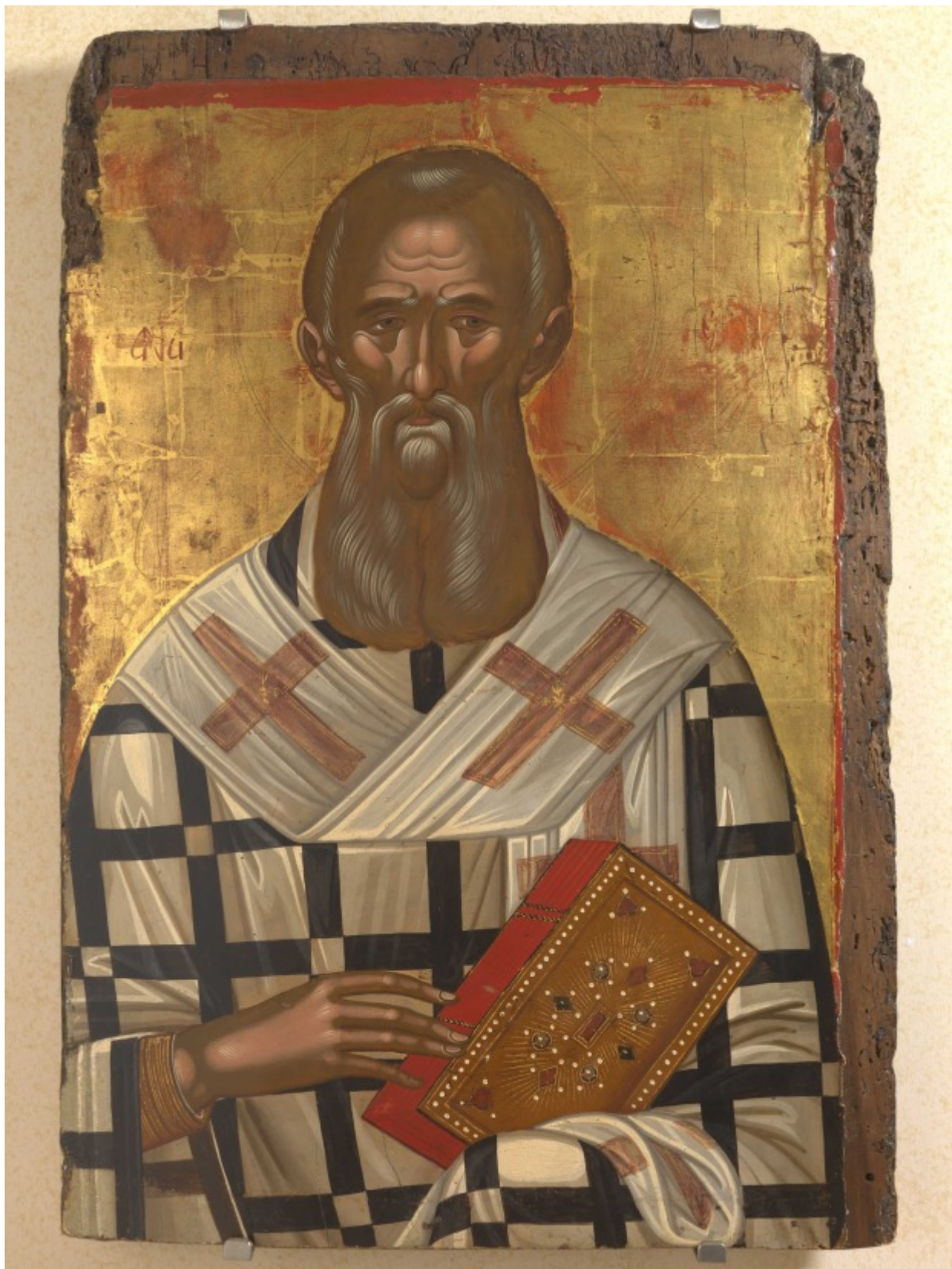
Άγιος Αθανάσιος ο Μέγας - Μιχαήλ Δαμασκηνός, τέλη 16ου αιώνα μ.Χ.