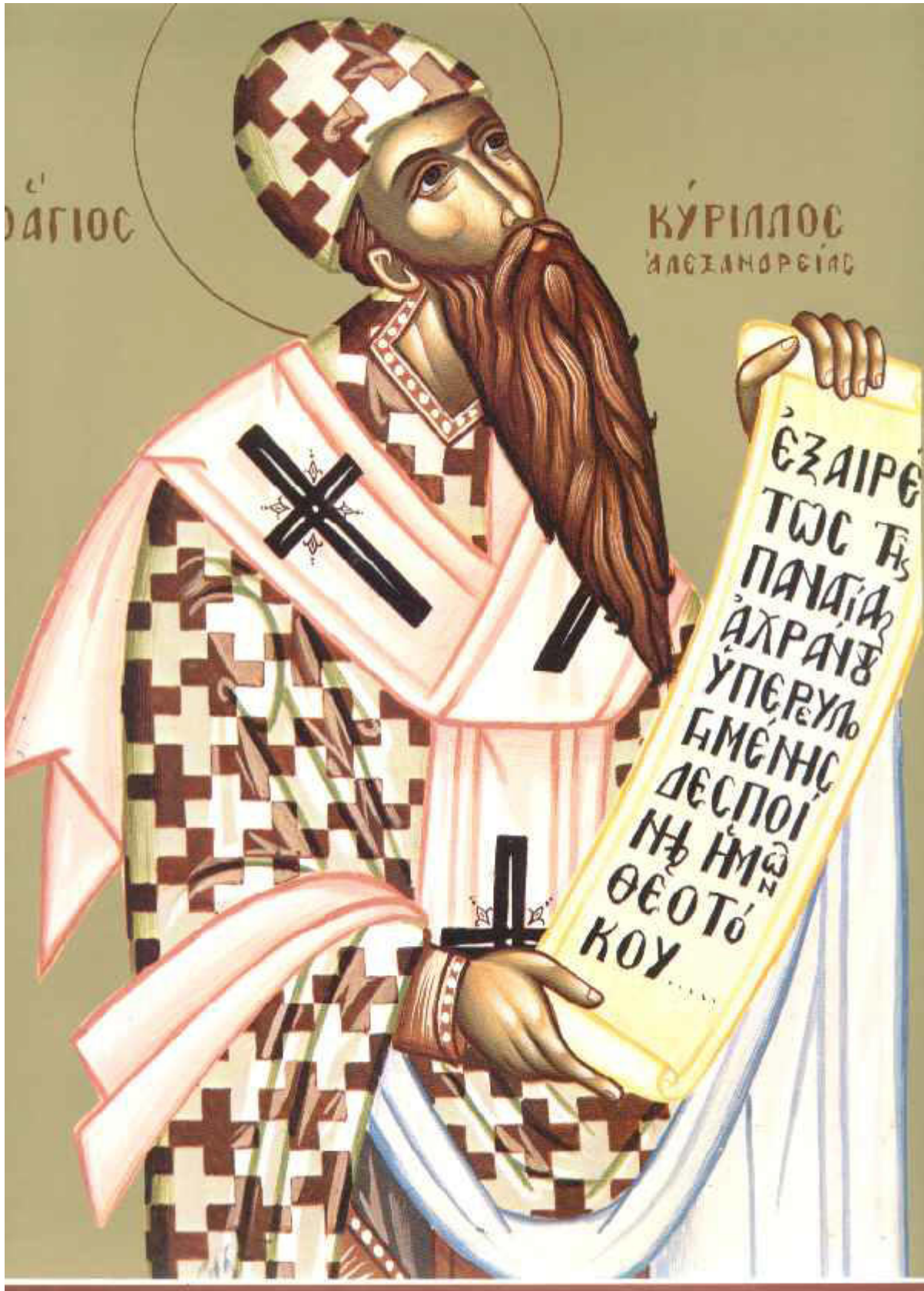
Άγιος Κύριλλος Πατριάρχης Αλεξανδρείας