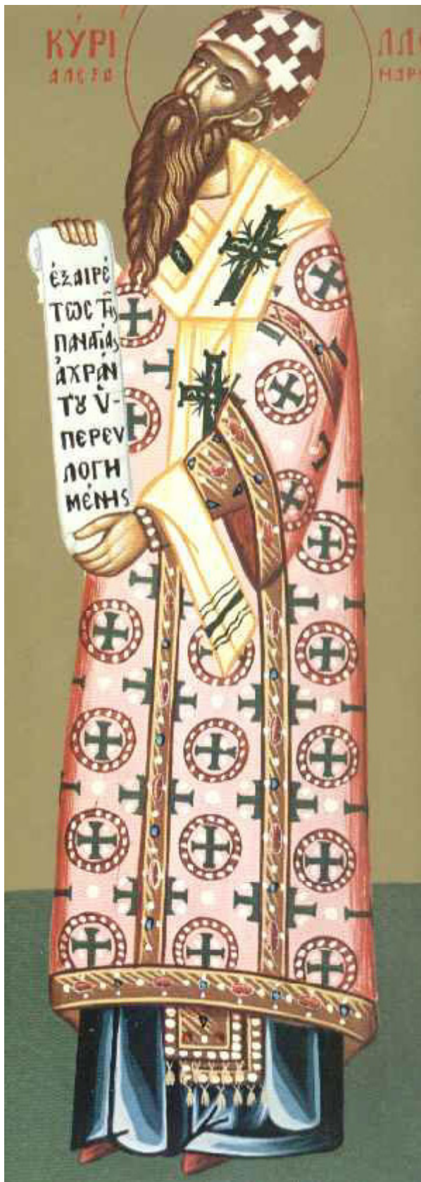
Άγιος Κύριλλος Πατριάρχης Αλεξανδρείας