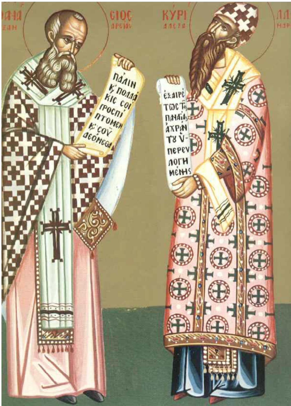
Άγιοι Αθανάσιος ο Μέγας και Κύριλλος Πατριάρχες Αλεξανδρείας

Εορτάζει στις 18 Ιανουαρίου εκάστου έτους.