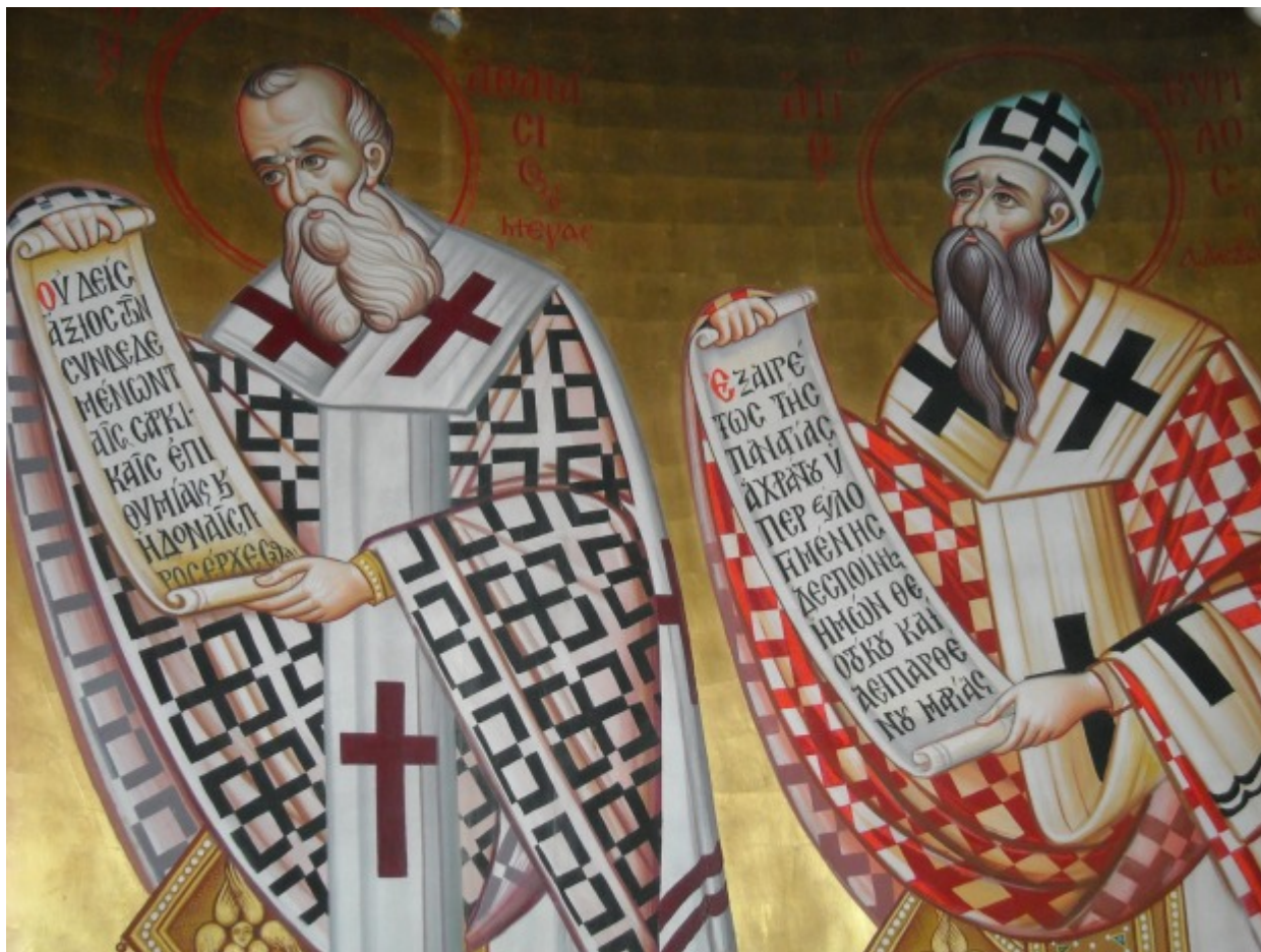
Άγιοι Αθανάσιος ο Μέγας και Κύριλλος Πατριάρχες Αλεξανδρείας