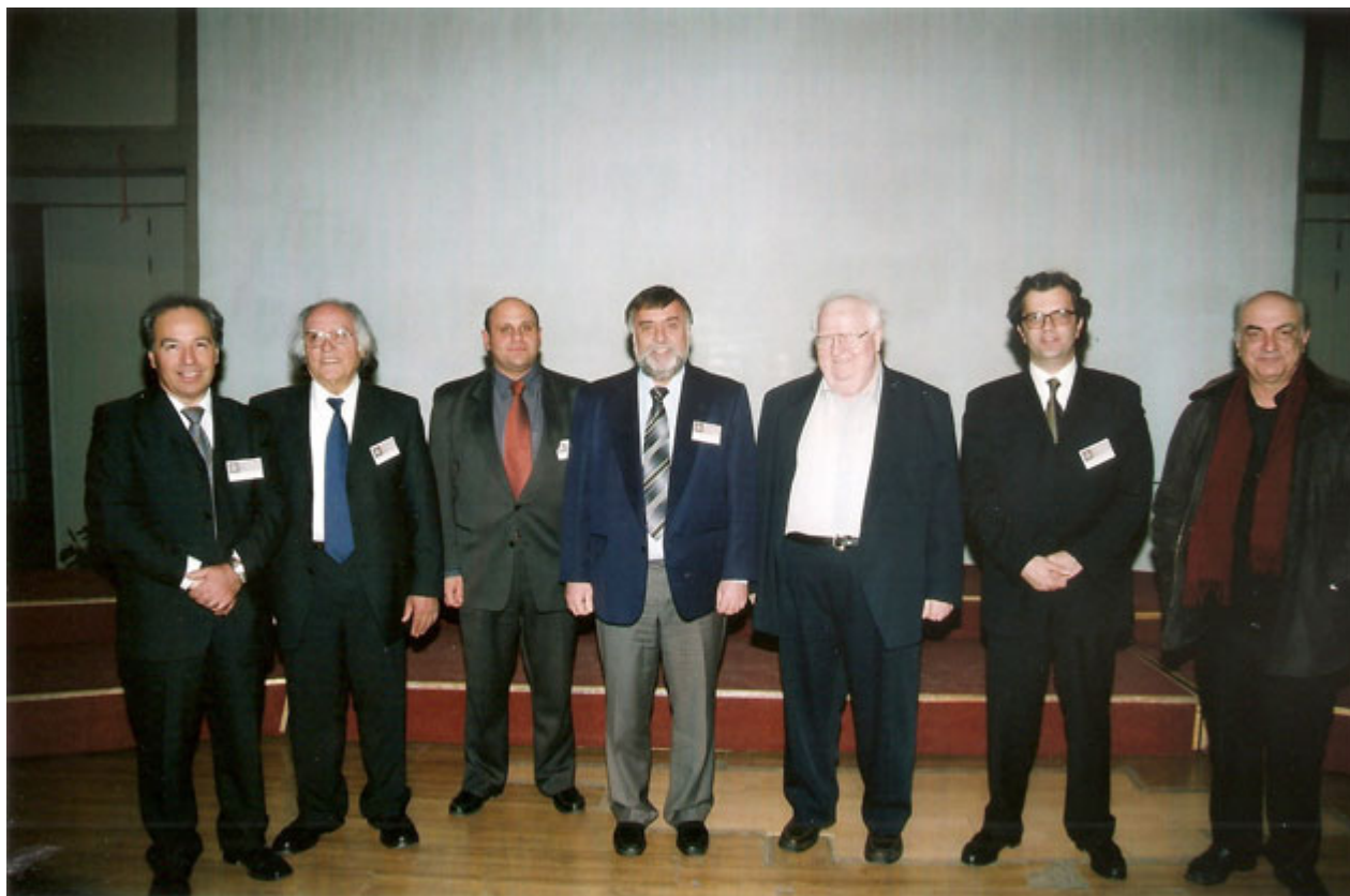
Μέλη του Ιου Δ.Σ. της Στέγης Ελληνικών Χορωδιών.

Με αφορμή την εκδήλωση-αφιέρωμα στον μεγάλο δάσκαλο της χορωδιακής μουσικής Στέφανο Βασιλειάδη που θα πραγματοποιηθεί το Σάββατο 17 Ιανουαρίου 2015 και ώρα 7:00 μ.μ. στο Θέατρο του Κολλεγίου Αθηνών-Ψυχικού υπό την Αιγίδα της Ένωσης Ελλήνων Μουσουργών, η «Πεμπτουσία» μίλησε με τον Γεώργιο Γεωργόπουλο, άμεσο και στενό συνεργάτη του μεγάλου παιδαγωγού και Γενικού Γραμματέας της Στέγης Ελληνικών Χορωδιών.