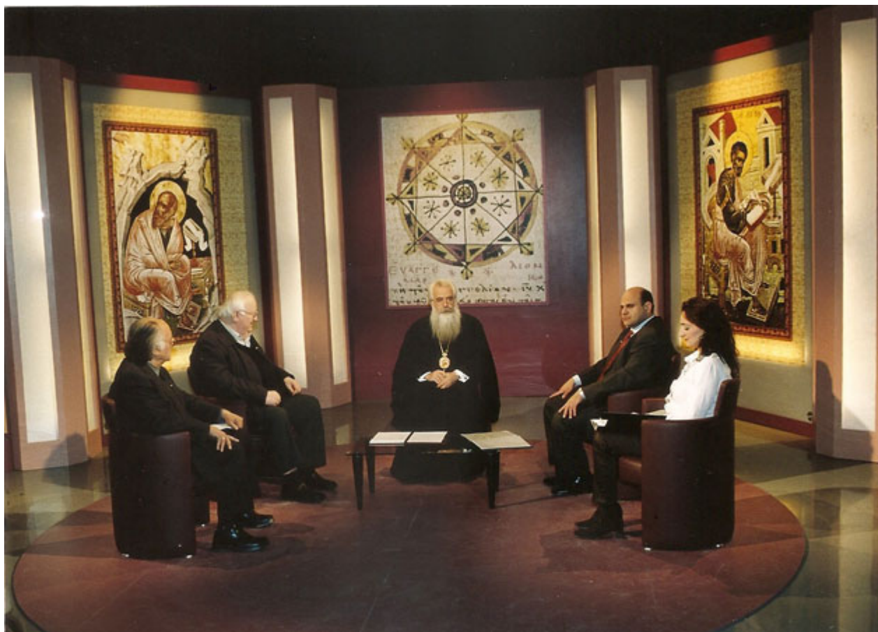
Συμμετοχή Μελών του Δ.Σ. στην εκπομπή «Αρχονταρική» της NET με το Σεβασμιώτατο Μητροπολίτη Δημητριάδος & Αλμυρού κ.κ. Ιγνάτιο.

Ήθελε να έχουμε όραμα και νόημα ζωής, να κοιτάμε εντός μας, να ακούμε τη φωνή της συνείδησής μας, αφού μόνο έτσι μπορούμε να ζούμε πραγματικά.