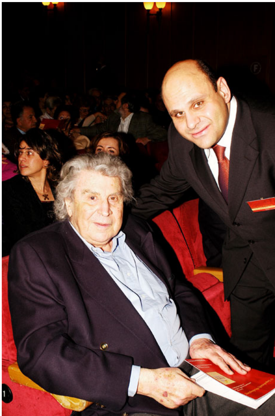
Ο Γιώργος Γεωργόπουλος με τον μεγάλο μαέστρο Μίκη Θεοδωράκη.

Π.: Μιλήσατε για Συλλογικό Φορέα και προφανώς αναφέρεστε στη Στέγη Ελληνικών Χορωδιών. Πως προέκυψε η ίδρυση της Στέγης;