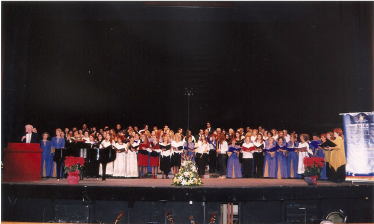
2. Τιμή στις Ελληνικές Χορωδίες Εναρκτήρια Εκδήλωση της Στέγης Ελληνικών Χορωδιών, στο βήμα αείμνηστος Στέφανος Βασιλειάδης Εθνική Λυρική Σκηνή, 9 Δεκεμβρίου 2002.

Η Στέγη μας ήρθε να συμπληρώσει το κενό που υπήρχε στις μέχρι τότε συλλογικές χορωδιακές προσπάθειες. Άλλωστε αυτή ήταν και η τελευταία εν ζωή μουσική πρωτοβουλία του Στέφανου Βασιλειάδη.