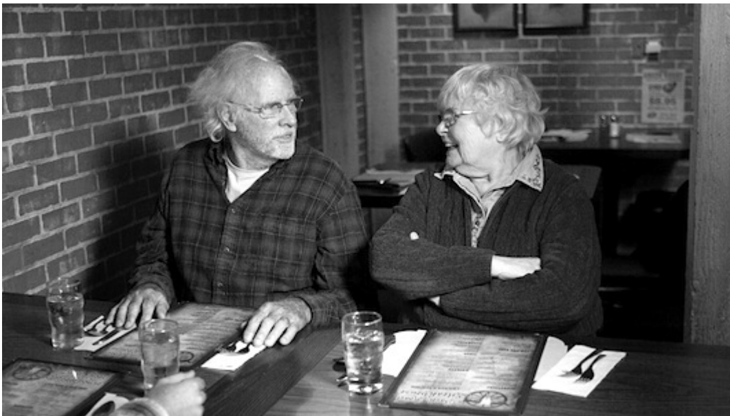
«Nebraska» του Αλεξάντερ Πέιν