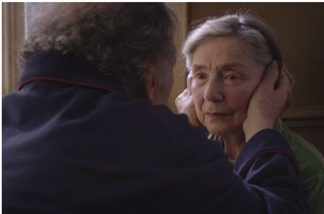
«Amour» του Μίκαελ Χάνεκε

Το γήρας ως ευκαιρία πριν η ζωή ξεφύγει από τα χέρια μας, πριν χαθεί ο πολύτιμος χρόνος και η δυνατότητα για επανόρθωση.