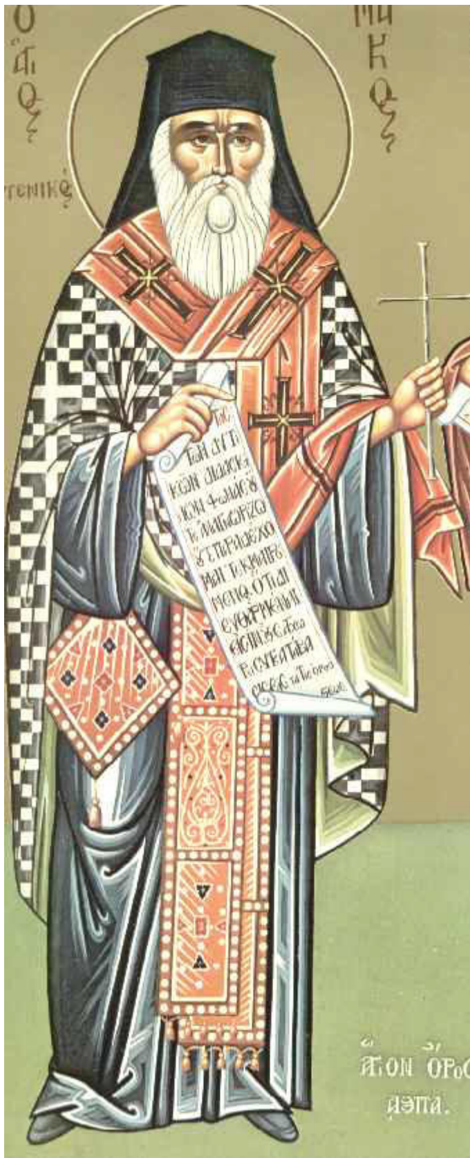
Άγιος Μάρκος ο Ευγενικός