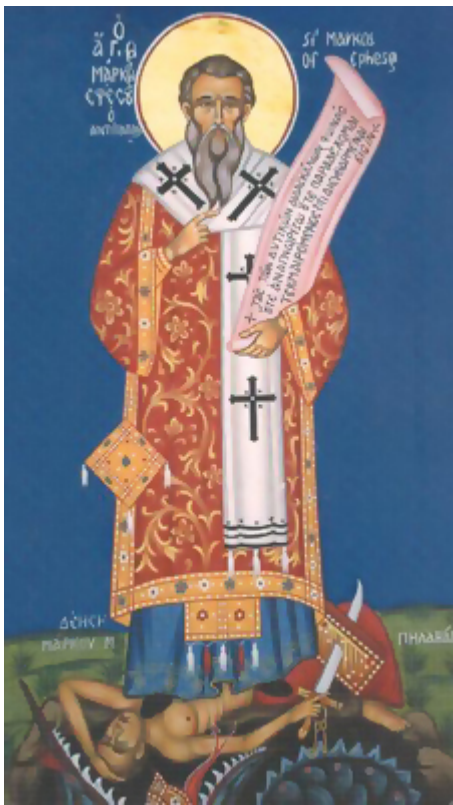
Ἅγιος Μάρκος ὁ Ευγενικός