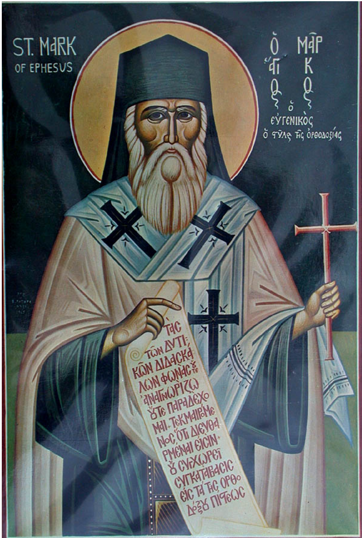
Ἅγιος Μάρκος ὁ Εὐγενικός