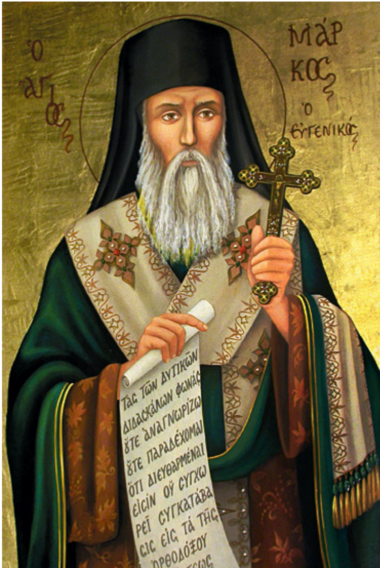
Άγιος Μάρκος ο Ευγενικός

Εορτάζει στις 19 Ιανουαρίου εκάστου έτους.