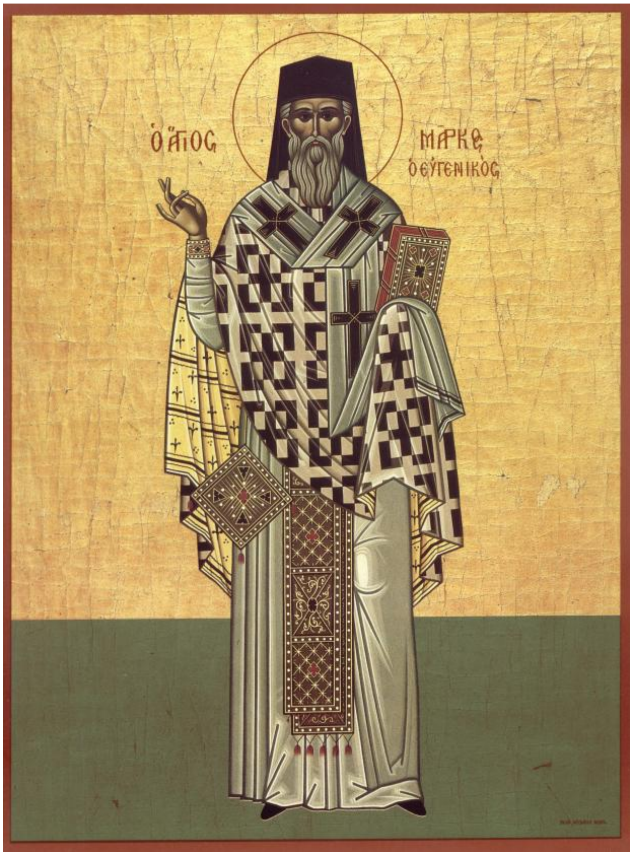
Άγιος Μάρκος ο Ευγενικός