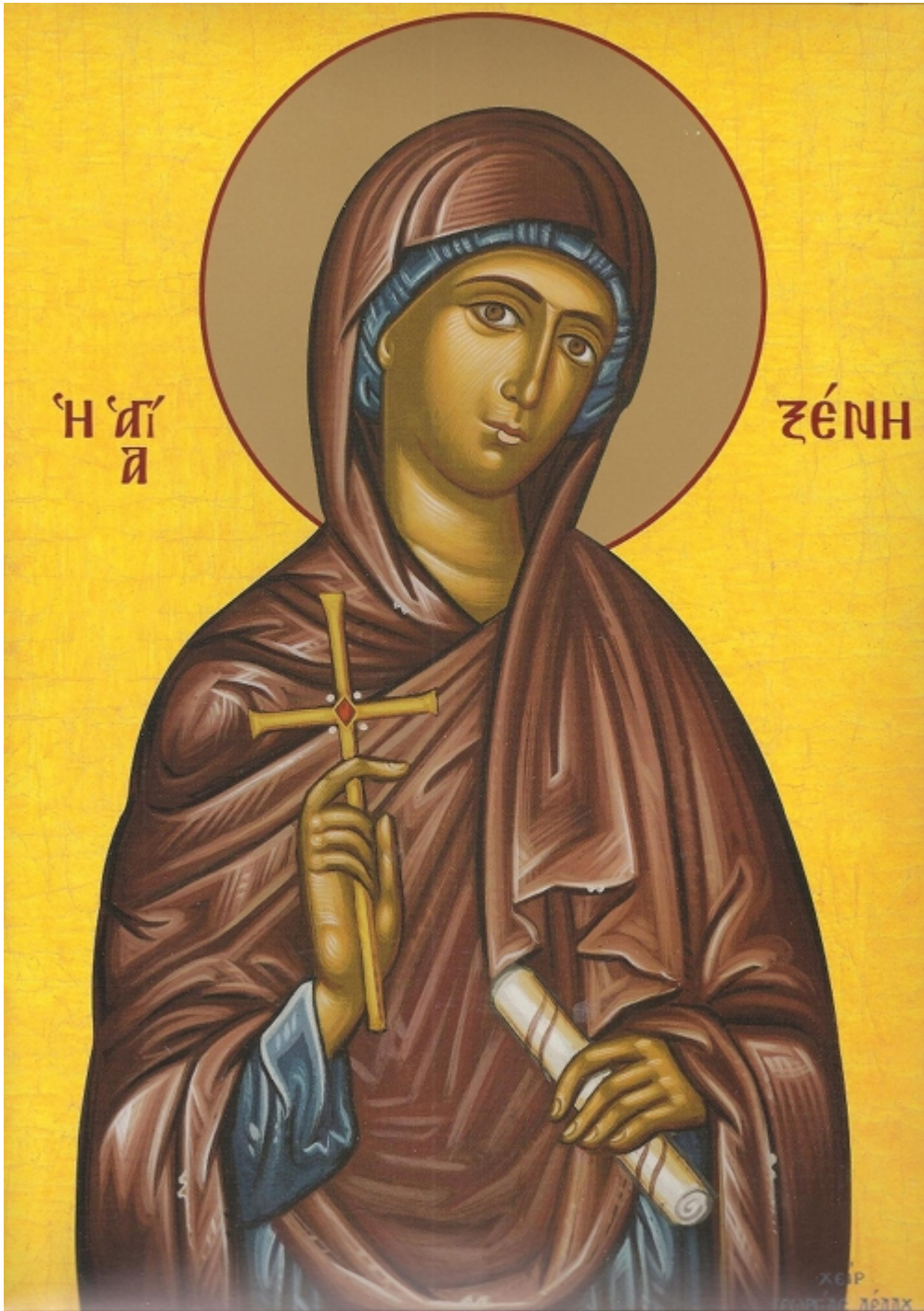
Οσίες Ξένη και οι δύο Θεραπεινίδες της