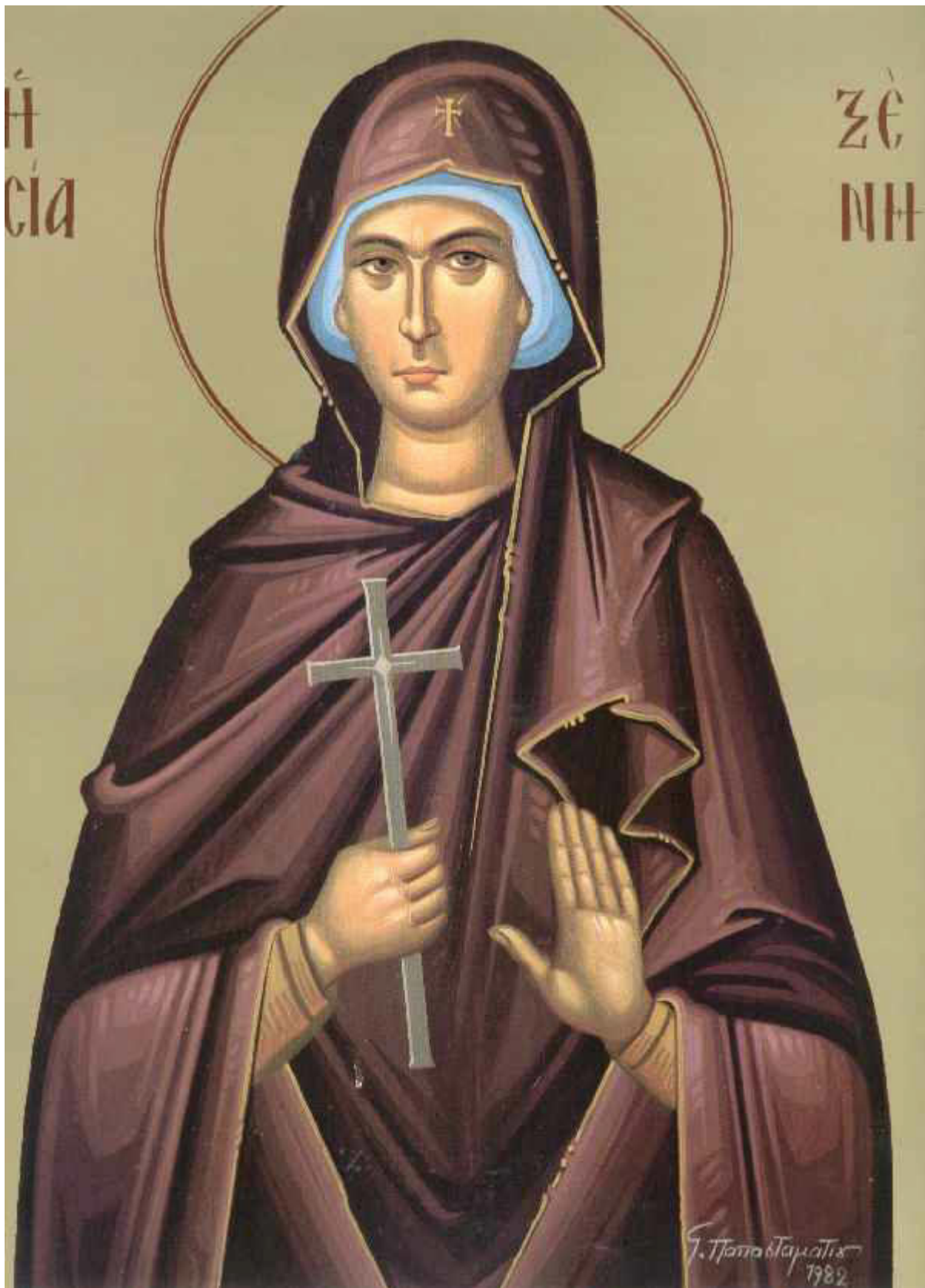
Οσίες Ξένη και οι δύο θεραπαινίδες της