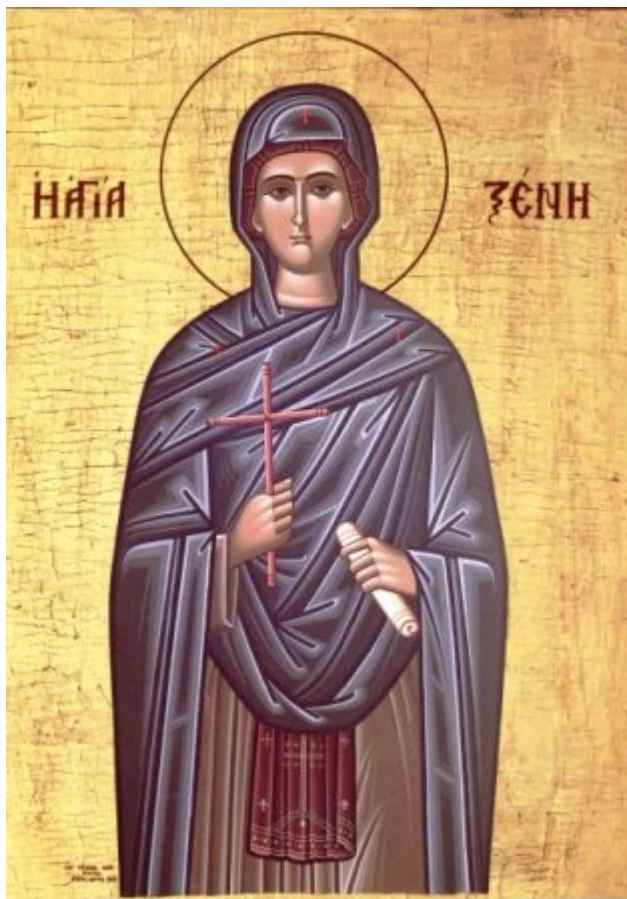
Οσίες Ξένη και οι δύο θεραπεινίδες της