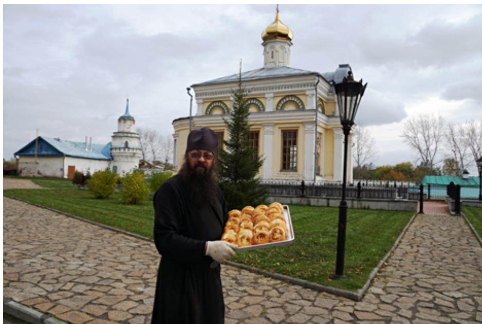
Το μοναστήρι του Αγίου Νικολάου.