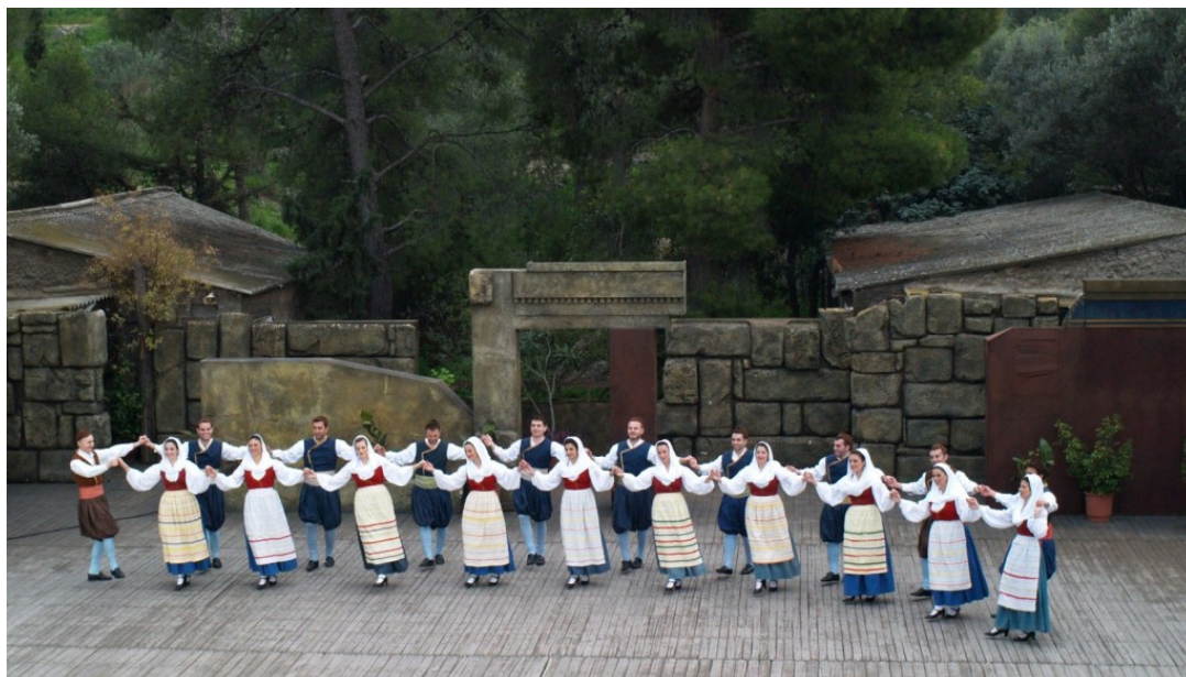
Χοροί απο την Κεφαλονιά

Το 1963 ο Κωνσταντίνος Καραμανλής δίνει εντολή να κατασκευαστεί ειδικά για το συγκρότημα, ένα θέατρο στο Λόφο Φιλοπάππου. Το 1967 παίρνει το Παγκόσμιο Βραβείο Θεάτρου, τη σημαντικότερη διεθνή διάκριση, ενώ βραβεύεται από την Ακαδημία Αθηνών και παίρνει επιχορήγηση από το Ίδρυμα Φορντ. Η Δόρα Στράτου έγραψε τρία βιβλία: «Μια παράδοση, μια περιπέτεια», «Ελληνικοί χοροί, ένας ζωντανός δεσμός με το παρελθόν» και «Ελληνικοί παραδοσιακοί χοροί» και εξέδωσε μια από τις μεγαλύτερες στον κόσμο σειρές δημοτικής μουσικής, που περιλαμβάνει 45 δίσκους.