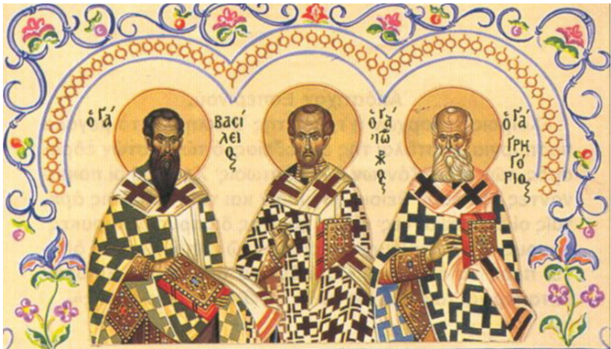
Ἅγιοι Τρεις Ἱεράρχες