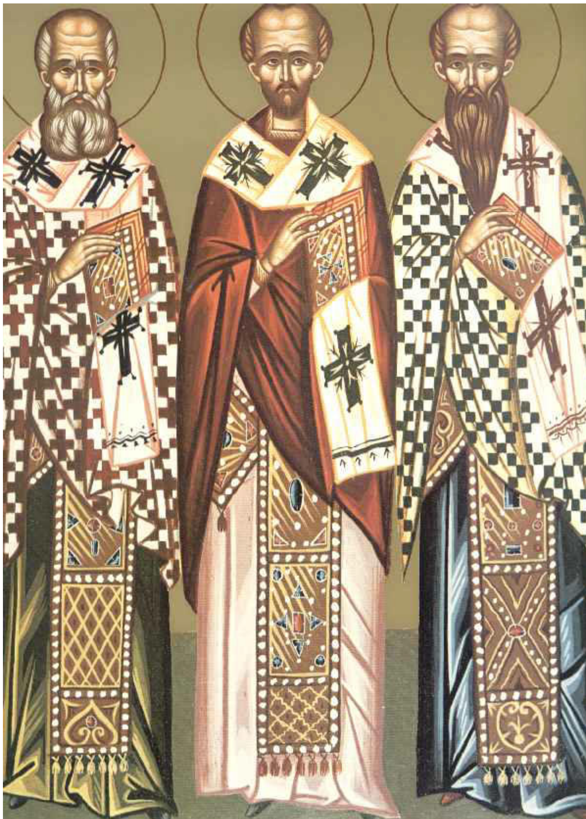
Άγιοι Τρεις Ιεράρχες