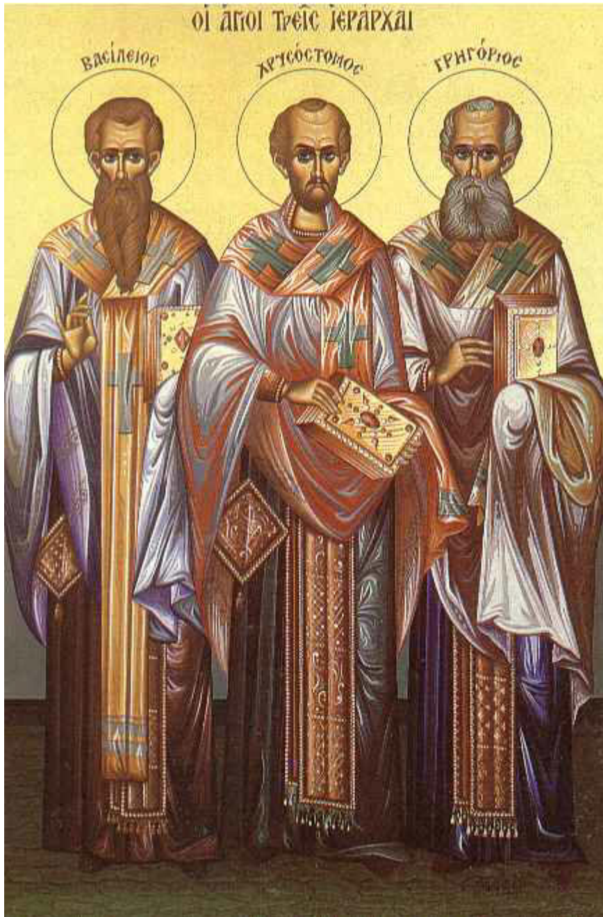
Άγιοι Τρεις Ιεράρχες