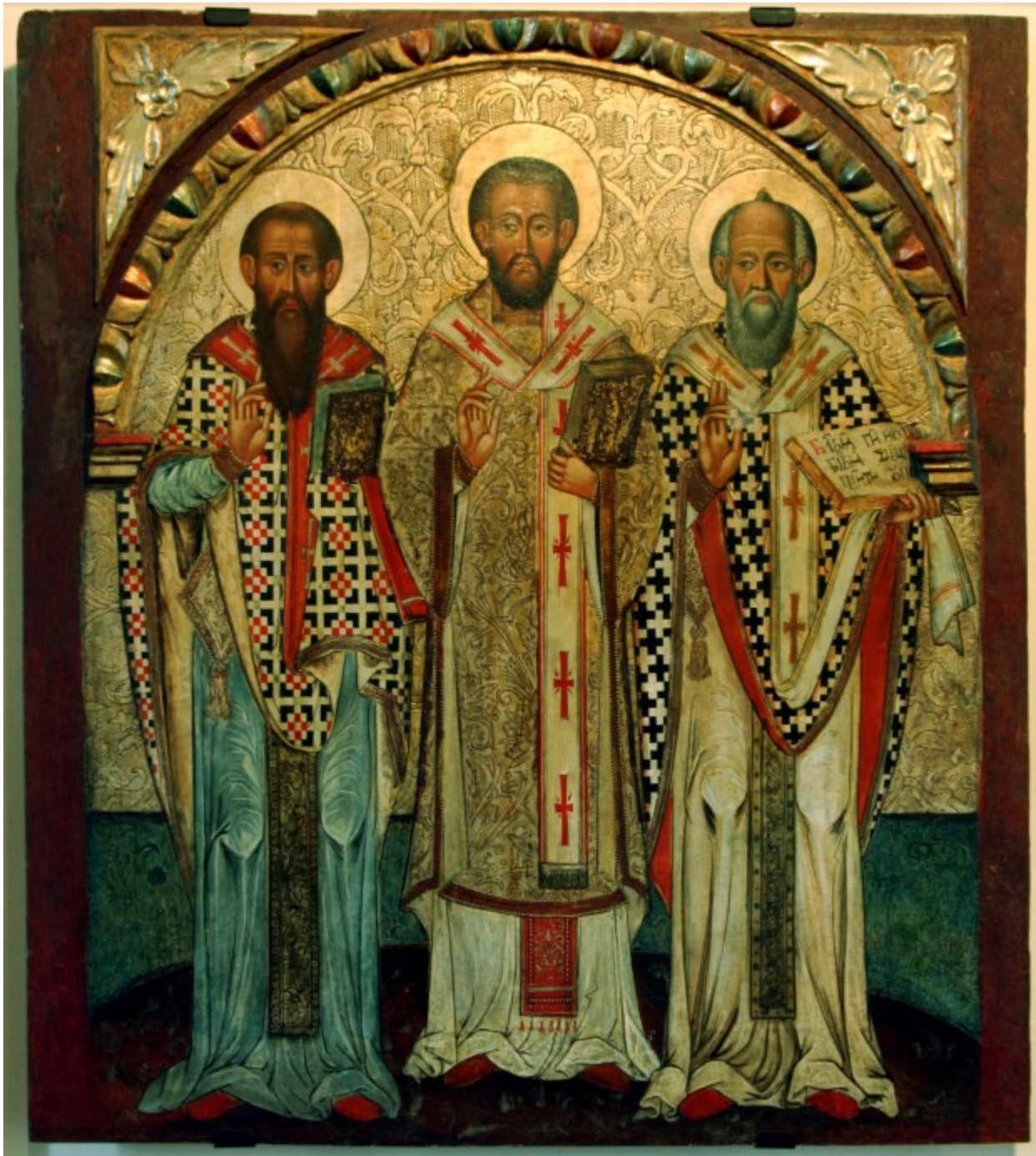
Άγιοι Τρεις Ιεράρχες