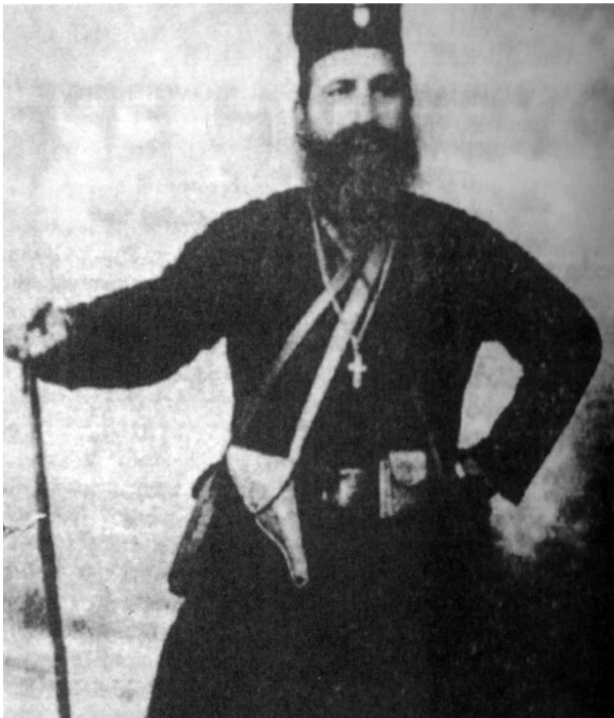
Ο Μακάριος Μυριανθεύς στο Μέτωπο στους Βαλκανικούς Πολέμους του 1912-13, μετέπειτα Μητροπολίτης Κυρήνειας.

Ακολουθώντας η εθναρχούσα εκκλησία τον ανένδοτο ενωτικό αγώνα, αποφάσισε στις 15 Ιανουαρίου του 1950 να διενεργήσει δημοψήφισμα για την Ένωση . Τα αποτελέσματα ήταν εντυπωσιακά. Ψήφισε το 96% του λαού, 215,108 και από αυτούς μόνο 5 άτομα ψήφισαν εναντίον της ένωσης.