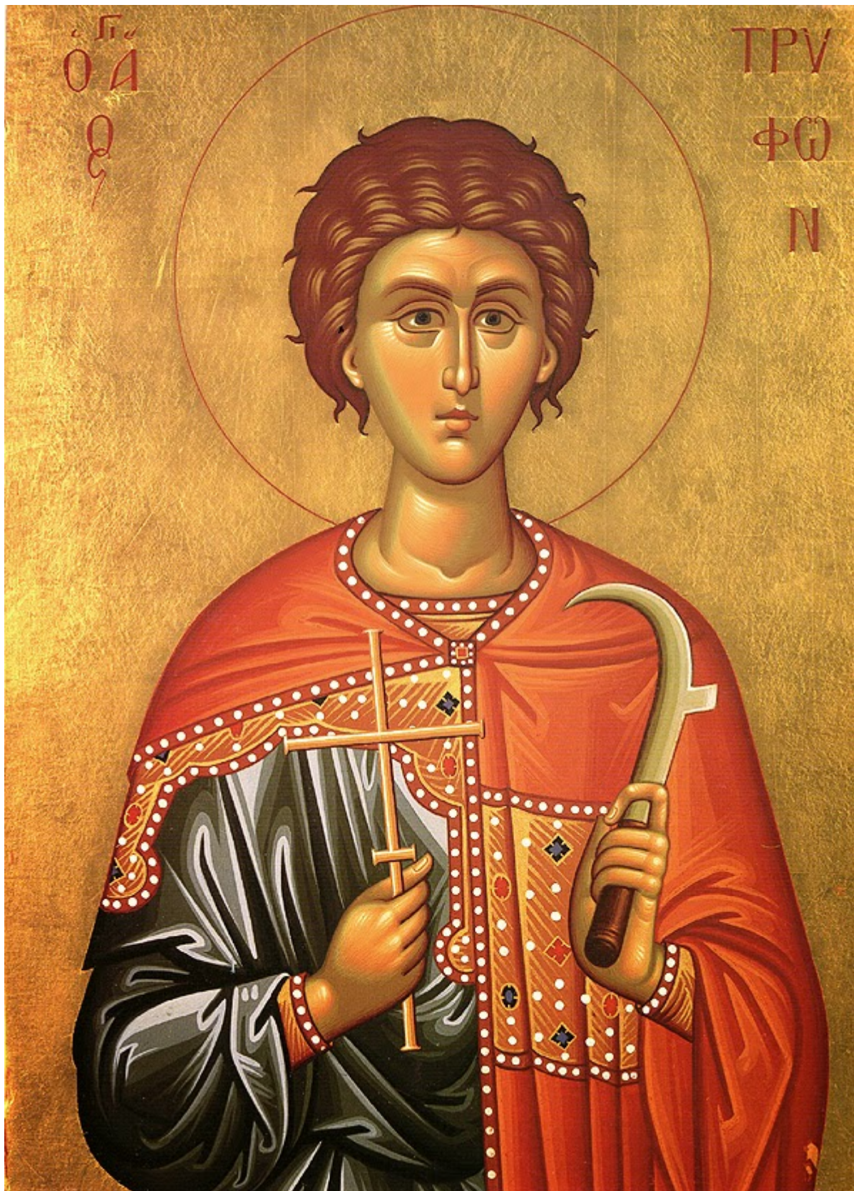
Άγιος Τρύφων ο Μάρτυρας