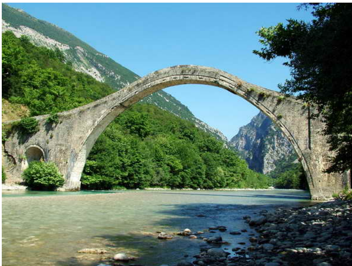
Το ιστορικό γεφυρι πριν και μετά τη χθεσινή κακοκαιρία: