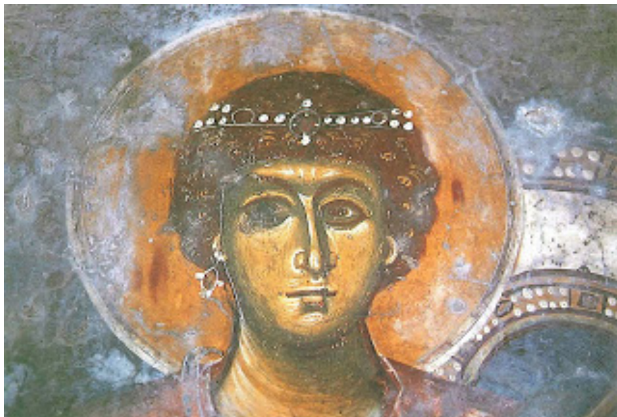
Ο άγ. Γεώργιος με σκουλαρίκι - τοιχογραφία από ιστορικό + θαυματουργό ναό της Παναγίας του 14ου αιώνα στο χωριό Πλατάνια νομού Ρεθύμνης (δήμος Αμαρίου).

Φυσικά, αυτό δε γίνεται απ' τη μια μέρα στην άλλη. Αλλά για ν' αρχίσει να γίνεται, κάνε το πρώτο βήμα και έμπα μέσα!