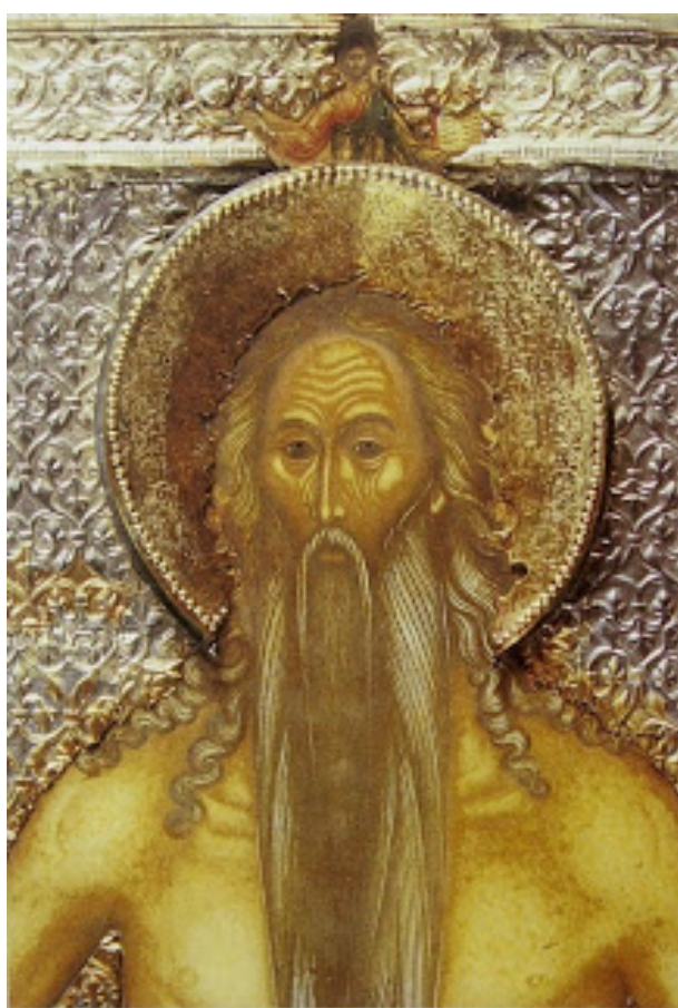
Ο γυμνός ασκητής της αιγυπτιακής ερήμου άγιος Ονούφριος

Χωρίς τον εκκλησιασμό, δεν υπάρχει χριστιανική Εκκλησία, αλλά μόνο δυστυχημένα πρόσωπα, που παλεύουν με τη μοναξιά τους και δεν πρόκειται να σωθούν ποτέ, γιατί σωτηρία δεν είναι να «πείσω» το Θεό πως είμαι δικός Του άνθρωπος, εξασφαλίζοντας μια θεσούλα στον παραδείσιο κήπο, αλλά να ενωθώ μ' Αυτόν διά της αγάπης, πράγμα που σημαίνει και ένωση με τους συνανθρώπους μου.