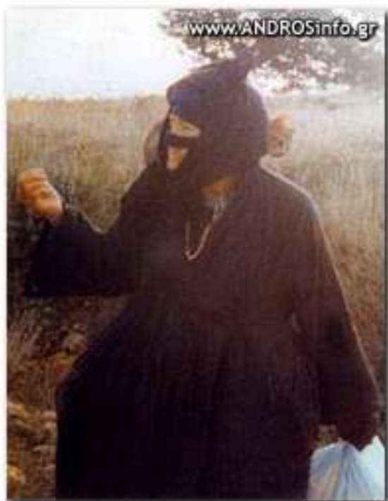
Ταρσώ, η «τρελή» αγία, μία από τους πιο αντισυμβατικούς τύπους του κόσμου, τους «διά Χριστόν σαλούς»

Ας έχουμε υπόψιν ότι σε όλο τον κόσμο, κάθε Κυριακή και εορτή, τελείται μόνο μία λειτουργία, απλωμένη σε όλους τους ορθόδοξους ναούς της Γης. Η λειτουργία αυτή ενώνεται με την ουράνια λειτουργία, που τελείται μυστικά στον ουρανό, από τους αγγέλους και τους αγίους. Κατά την έναρξη της λειτουργίας, τελείται η «αγία προσκομιδή», όπου ο ιερέας σχηματίζει με μερίδες από το πρόσφορο (το ψωμί της θείας Μεταλήψεως) το σύμβολο της παγκόσμιας Εκκλησίας πάνω στο δισκάριο, από το οποίο κατόπιν θα μπει στο άγιο ποτήριο και, με τη χάρη του Αγίου Πνεύματος, θα γίνουν όλοι αυτοί -άγγελοι, άγιοι, η Παναγία, ο Χριστός, οι ζωντανοί και οι νεκροί- το Σώμα του Χριστού, το Οποίο θα κοινωνήσουμε, όταν κοινωνήσουμε, ενώνοντας τον εαυτό μας μ' εκείνους.